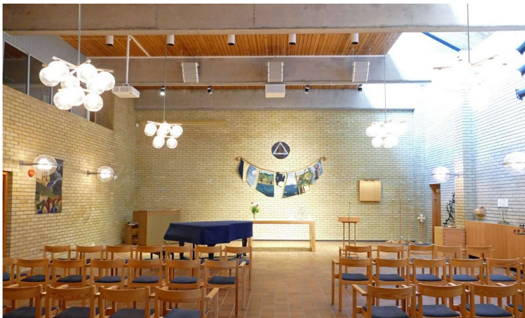
Kyrkorummets orientering ändrades i och med tillbyggnaden 1987. Sedan dess är koret i väster.

takbjälklaget vilket är synligt både interiört och exteriört, där takbjälkarnas ändar sticker ut genom fasaden i norr och söder. Entrépartiet ligger i nordväst. Det har en rundbågig form med glasade dörrar, halvmåneformat överljus och väggar klädda med aluminiumplåt. Fönstren har horisontella spröjs. På västra fasaden finns en utvändig, gjuten trappa med tillika gjuten balustrad som leder till en enkeldörr vilken ansluter till kyrkorummets läktare. Trappan avsågs även fungera som enkel predikstol vid utomhusgudstjänster. Den ursprungliga entrén i södra fasaden är en enkel dörr i ek med lodräta glasrutor i dörrbladet. Taket över kyrkorummet är täckt med falsad aluminiumplåt i flack sadelform med valmat takfall åt söder. I brytningen är ett kors placerat. Norra delen av taket är utformat som ett pulpettak med fönster åt söder vilket ger kyrkorummet ett indirekt dagsljus. Över församlingsdelen är taket flackt och täckt med papp.