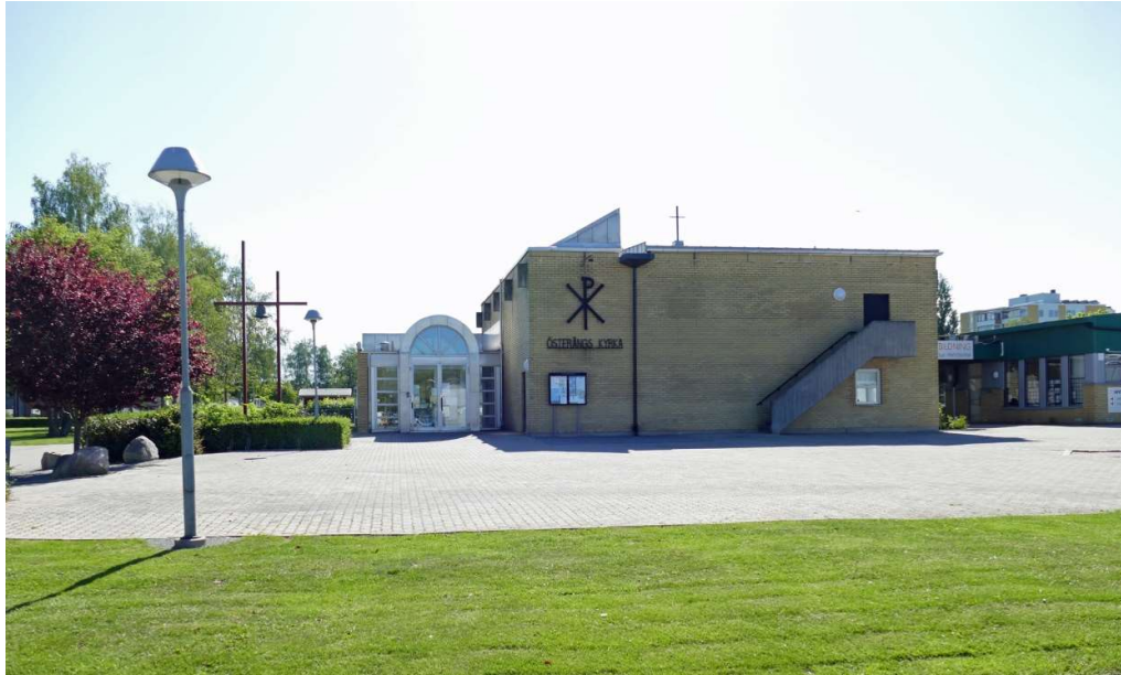
Österäng kyrka i juni 2020. Till höger i bild syns skolan där församlingen ursprungligen hade lokaler för sin sociala verksamhet. 1987 byggdes ett eget församlingshem och en ny gemensam entré till detta och kyrkan syns till vänster i bild. Klockstapeln norr om kyrkan är tillverkad av järnbalkar.