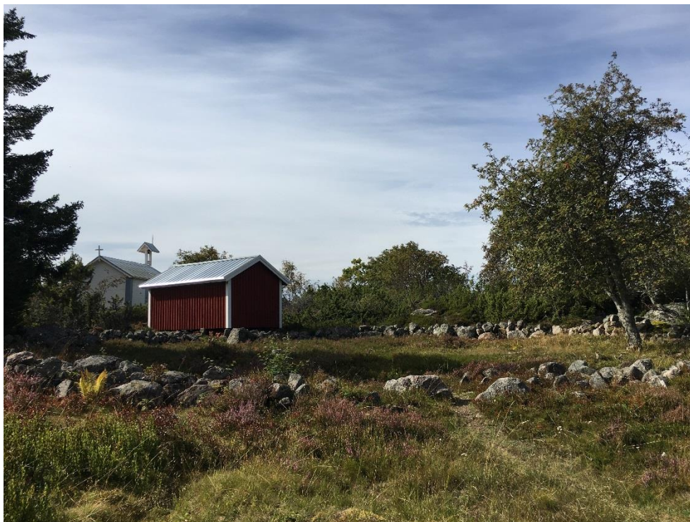
Mangelboden med begravningsplatsen i förgrunden och kapellet i bakgrunden

Mangelboden byggdes så sent som på 1920-talet, men föregicks även av en tidigare mangelbod. Själva mangeln byttes ut 1959, vilket visar att byggnaden fyllt en funktion in i modern tid.