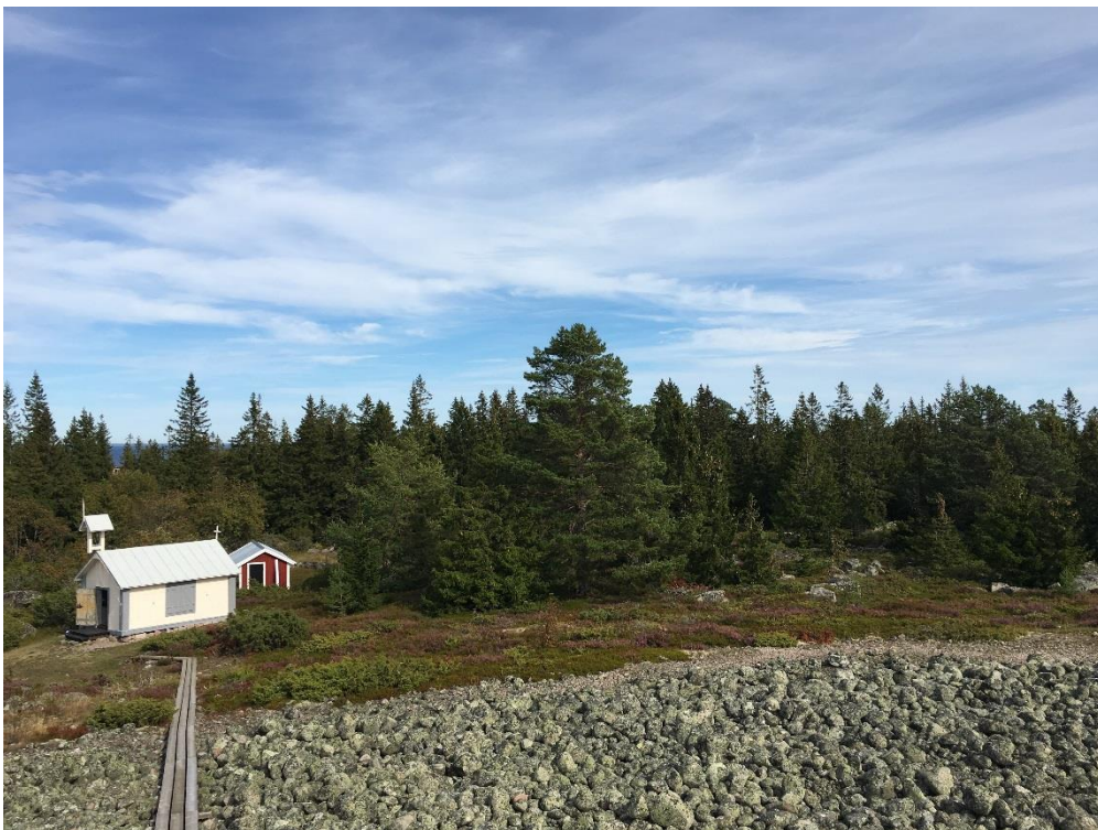
Kapellet med klapperstensfältet i förgrunden och mangelboden i bakgrunden.

Prästgrundets kapell är ett fint exempel på de fiskarkapell som uppförts längs kusten. Kapellet, som är det minsta i sitt slag, är välbevarat såväl interiört som exteriört. I anslutning till kapellet finns även bagarstuga och mangelbod, vanligt förekommande gemensamhetsanläggningar i fiskelägena. Tillsammans berättar de tre byggnaderna om hur det sociala och gemensamma livet i fiskeläget var organiserat och tog sig uttryck. Även om den nuvarande mangelboden är tillkommen så sent som på 1920-talet representerar den en viktig byggnadsfunktion på platsen.