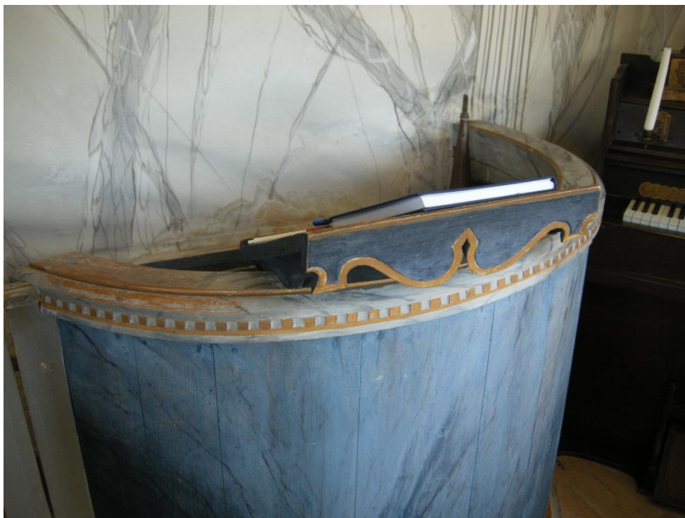
Altarring med bokpulpet.