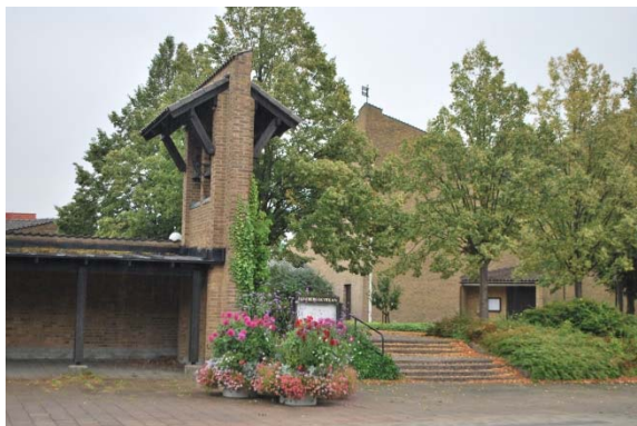
Klockstapel, busskur och trappa till kyrkans entré.

Taken , sadeltak och pulpettak, är täckta av bruna tegelpannor. Avtäckningsplåtar är av koppar. Hängrännorna är av koppar men stuprören är utbytta mot brun plåt.