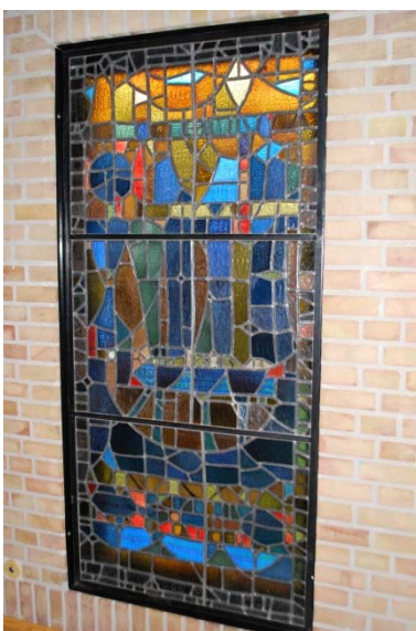
Glasfönster av Randi Fisher.