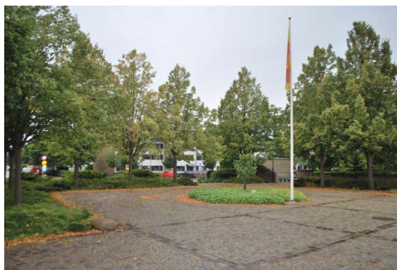
Platån, kyrktorget, mellan väg och kyrka.