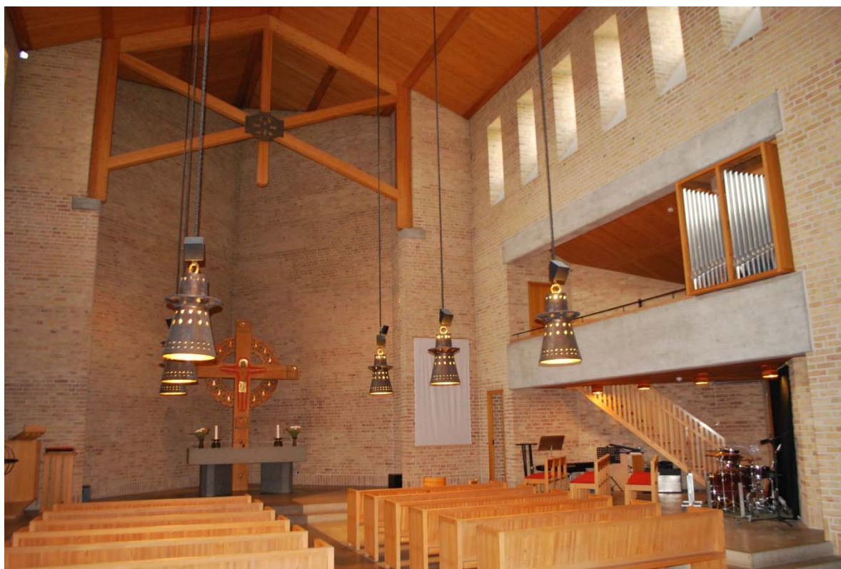
Kyrkan mot altaret.

gjuten betong med brädavtäckning och en förhöjning med ett metallstag. Södra läktaren är orgelläktare med spelbord mot läktaren och ryggpositiv mot långhuset.