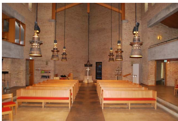
Kyrkan mot dopfunten.