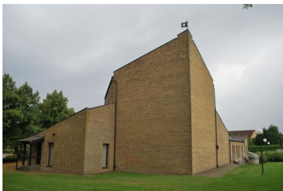
Kyrkan mot öster