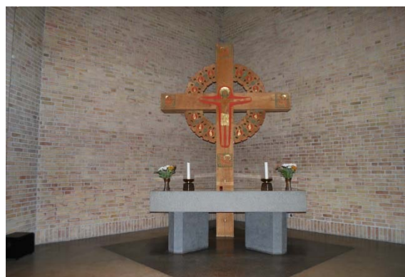
Altare och altarkrucifix.