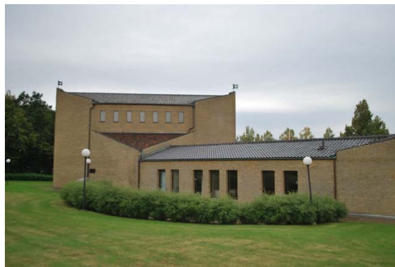
Kyrkan mot norr.