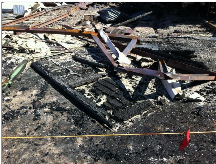
Foto efter branden, från söder mot platsen för magasinen, brandrester av skjutdörrar