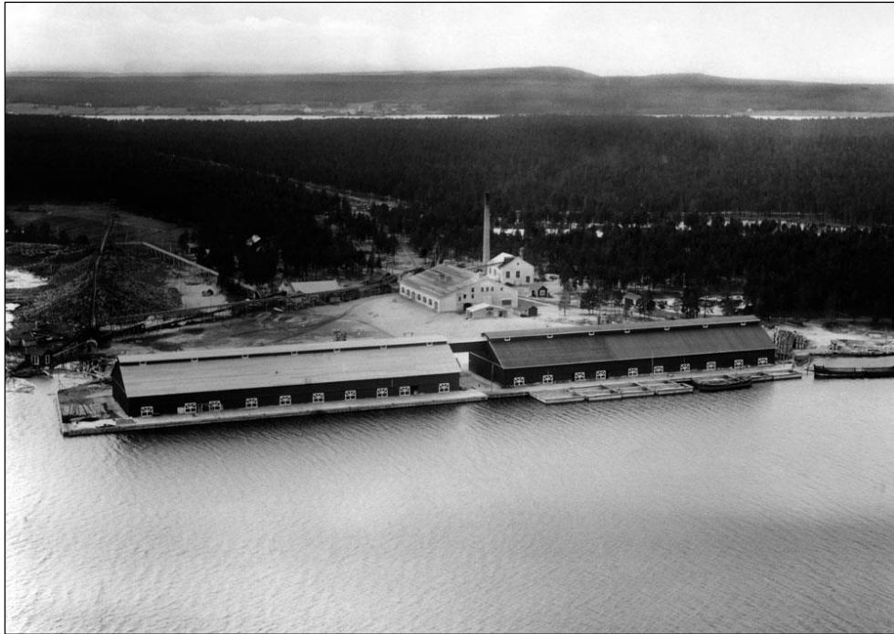
Foto på trämassfabriken med magasinerna och kaj, från 1929

industrierna, enkla kajplatser och lämningar samt bostadsområdet och nämnda torkeribyggnad.