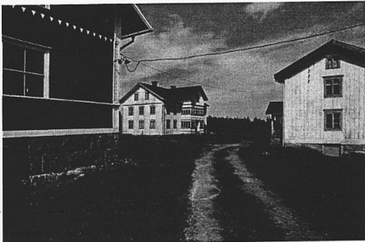
Från vänster ladugården, mangårdsbyggnaden och bryggstugan.

Tutabo, Grängsbo 9:3, Alfta socken, Ovanåkers kommun.