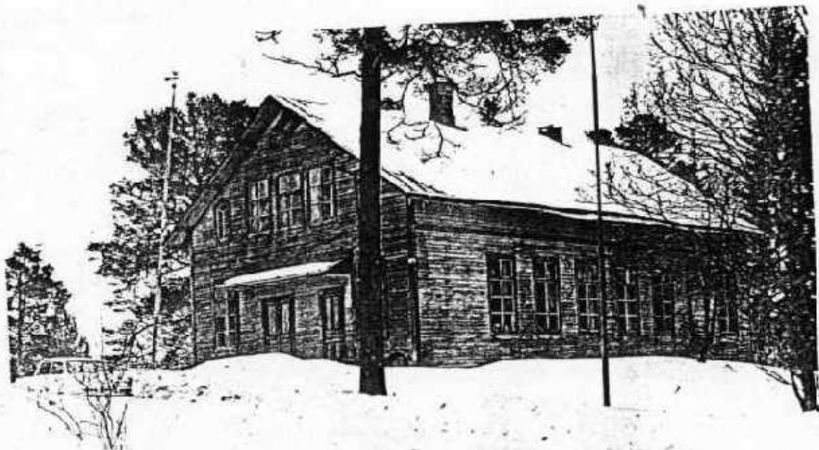
Föreningshuset mot sydväst. JLM 83 S 17/21