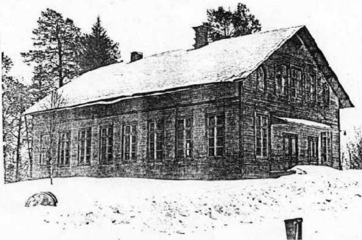
Föreningshuset mot nordväst. JLM 83 S 17/22