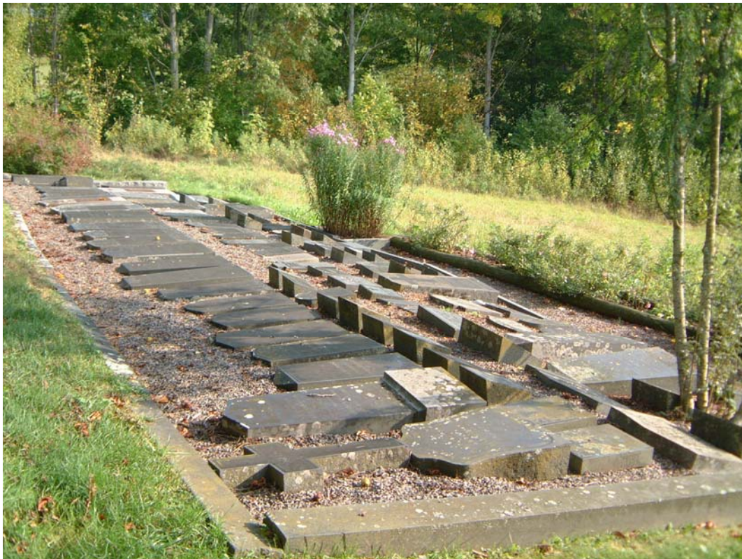
Arrangemang för borttagna gravvårdar

De är placerade på en grusbädd inom en ram lagd med ramar till borttagna stenramsgravar eller stockar.