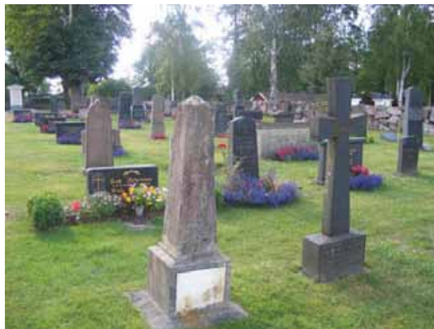
Stora kyrkogården, kv. I norr om kyrkan. Bild tagen mot väster. Påkostade familjegravar. (KI Misterhult 0227)