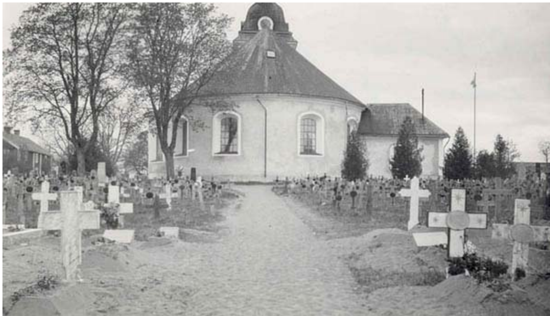
Stora kyrkogården i Misterhult 1927. Området bakom koret i öster med linjegravar markerade av träkors. Gravplatserna verkar vara anlagda med sand. Märk de uppskottade gravhögarnas form.

Fotografier tagna 1936, d v s året före, visar ett delvis glest linjegravsområde öster om kyrkan, stora granar längs kyrkans östra och norra fasad som ytterligare stora träd på kyrkogården.