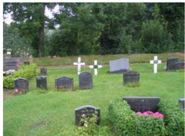
Kvarter B med rester av linjegravssystem, från öster. KI Misterhult 0176