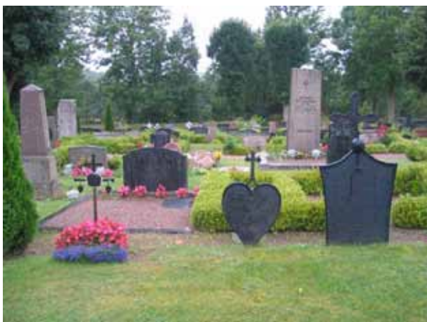
Kvarter A från öster, med bl a gjutjärnsvårdar från 1830-tal. KI Misterhult 0157

Gravkapell av sten, vitputsat med tak av kopparplåt. Ingång från söder. Interiört finns några rester av i väggen inmurade väggskåp av trä. Kapellet fungerade ursprungligen som sakristia till gamla kyrkan. Sakristian byggdes om i samband med att gamla kyrkan revs omkring 1780. I kapellets fasad finns fästa kopparplåtar som anger namnen på socknens kyrkoherdar.