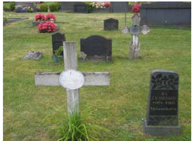
Stora kyrkogården, kv E mot väster. Linjegravsområde. (KI Misterhult 0204)