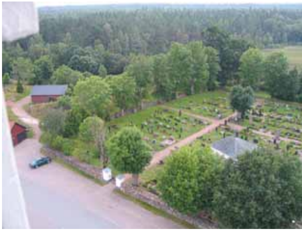
Gamla kyrkogården från nordost. KI Misterhult 0117

Nämndemannen, Mästerlostsen, Byggmästaren blandat med de mer vanliga Hemmansägaren och Lantbrukaren. Angivande av ortnamn är vanligt förekommande på vårdarna.