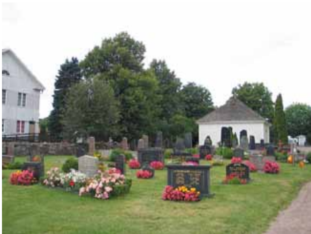
Stora kyrkogården, kv. A mot väster. Gravkapellet i bakgrunden, fd kommunalhuset till vänster. (KI Misterhult 0194)

Plan kring västtornet av grus samt kalkstensflisor i området framför västportalen. Gångar av grus delar upp kyrkogården i dess olika kvarter. Mest markanta är gången i öst-västlig riktning i kyrkogårdens östra hälft och den norr-söder gående grusgången i mitten av samma område. Inom kvarteren finns inga gångar.