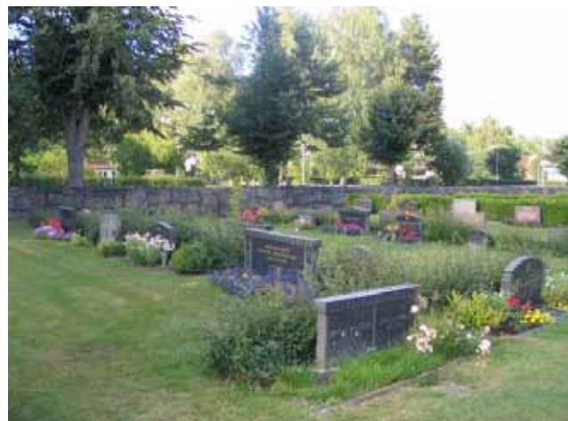
Norra kyrkogården. Kvarter H mot norr. (KI Misterhult 0233)