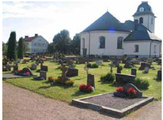
Stora kyrkogården mot sydväst. Kvarter G i förgrunden. Det fd kommunalhuset vänster om kyrkan. (KI Misterhult 0218)