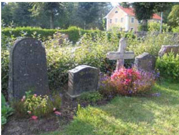
Norra kyrkogården. Kvarter E mot nordväst. (KI Misterhult 0231)

Bland familjegravarna mestadels mellanstora vårdar av svart och grå granit samt enstaka av röd granit. Många bär klassicerande drag i form av exempelvis pilastrar. I linjegravsområdet mestadels mindre vårdar av svart eller grå granit samt enstaka träkors. Träkorsen är målade i vitt och försedda med inskriptionsplåt.