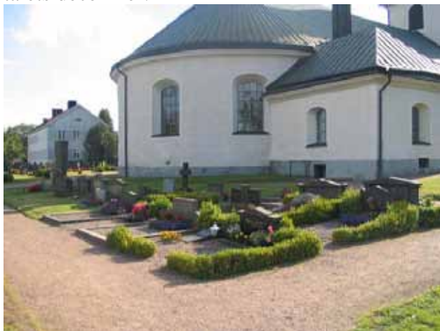
Stora kyrkogården, kv. H mot sydväst. Område med grusgravar omgärdade av stenramar eller buxbom. (KI Misterhult 0220)

Kyrkogårdens gravvårdar daterar sig från 1800-talets mitt och framåt. Endast ett fåtal är dock bevarade från 1800-talet och några av dem har sannolikt en sekundär placering. Från 1900-talets första decennier finns relativt många vårdar bevarade främst norr och söder om kyrkan. Linjegravarna kan dateras till 1923 och framåt. Stora delar av kyrkogården rymmer vårdarmed en koncentration från 1940-60-talen. Enstaka vårdar finns dock från alla av 1900-talets decennier.