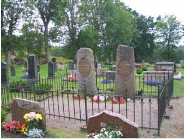
Kvarter C från nordost. KI Misterhult 0186