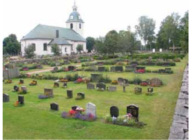
Norra kyrkogården mot sydväst. Kvarter C med rester av ett linjegravsområde i förgrunden. (KI Misterhult 0108)