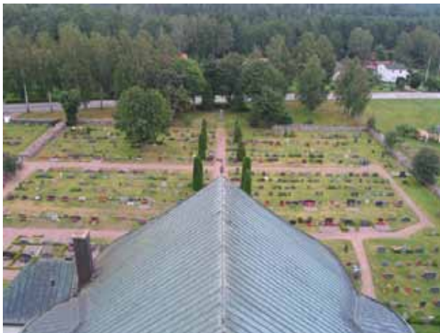
Stora kyrkogården mot öster. (KI Misterhult 0126)