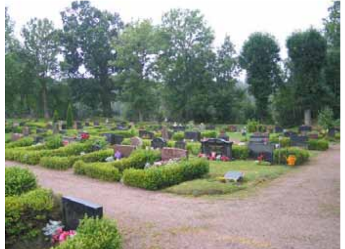
Kvarter B från nordost. KI Misterhult 0163