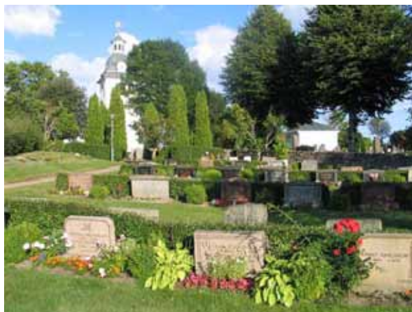
Nya kyrkogården, kvarter D mot öster. (KI Misterhult 0243)