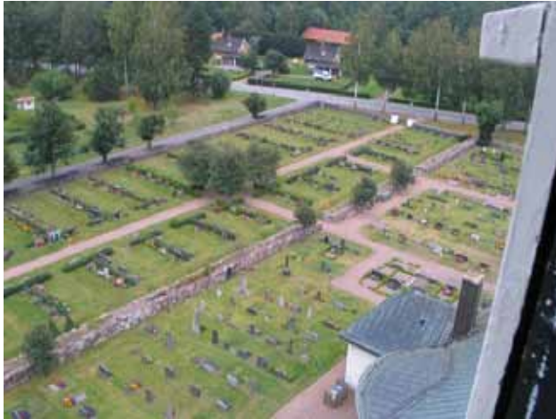
Norra kyrkogården mot nordost. Delar av Stora kyrkogården i förgrunden. (KI Misterhult 0128)

Övrigt: Mittparti där de två gångarna möts markerat av fyra träd av oxel. Rygghäckar av häckoxbär utom närmast mittpartiet där rygghäckarna består av tuja.