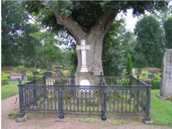
Vården över Maria Lembke daterad 1778. Kvarter B. KI Misterhult 0170