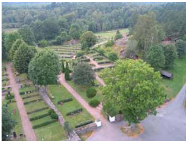
Nya kyrkogården mot väster. (KI Misterhult 0119)

Nya kyrkogården är belägen norr om Gamla kyrkogården och består av kvarter A-G, L. Området har en oregelbunden form som följer förutsättningar som skapats av den lokala topografin. Här finns platser för både kistgravar och urngravar liksom minneslund. Arkitekten Erik Palmgårds ritning verkar ha följts väl. Kvarter B och C ligger på en naturlig terrass i vars slänt plats finns för urngravar. Ett fokus på kyrkogården skapas mitt i områdets östra del i mötet mellan gångsystem. Platsen markeras av en rund grusad yta omgiven av fyra höga tujor samt häckar. Området domineras av dubbla rader vårdar i gräs med mellanliggande rygghäck. I de senast anlagda kvarteret L, saknas dock rygghäckar. Så är även fallet i urngravsområdena. Vegetationen på kyrkogården är blandad och en känsla ges av trädgård i nära anslutning till natur. Minneslundan har väl inpassats i området mellan Gamla och Nya kyrkogården. Kyrkogården försvinner nästan ut i ett intet i nordväst där kyrkogården övergår i omgivande naturområden. Titlar förekommer på ett fåtal vårdar, likaså ortnamn.