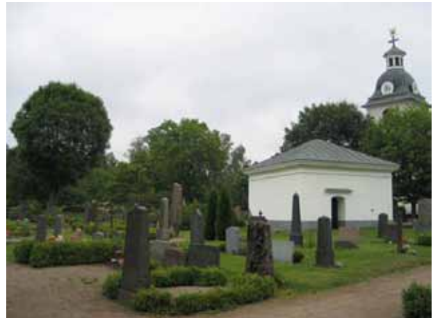
Gamla kyrkogården och kapellet (kv.A) från sydväst. KI Misterhult 0150