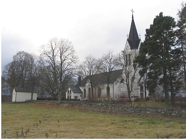
Omgärdning från nordväst (KI Fågelfors kyrkog 008)

Kyrkogården omgärdas i väster, norr och öster av en mur byggd av sten. Den äldre delen är uppförd av stora huggna granitblock och den del som tillkom på tidigt 1960-tal då kyrkogården förlängdes åt väster är av naturstenar. I söder avgränsas kyrkogården av en hög tujahäck.