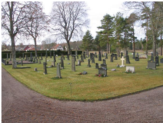
Översikt över kvarter I från nordost (KI Fågelfors kyrkog 036)