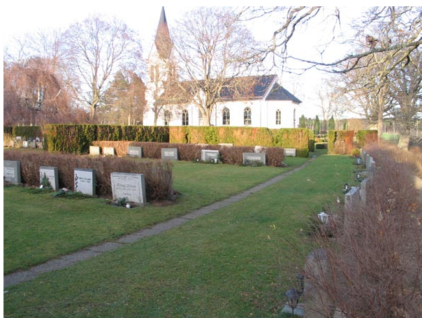
Översikt över del av kvarter V från sydöst (KI Fågelfors kyrkog 141)