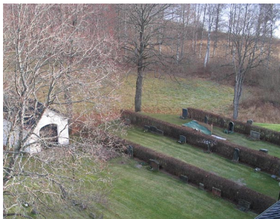
Översikt över del av kvarter IV från sydväst (KI Fågelfors kyrkog 043)

Kvarter IV är beläget i kyrkogårdens nordöstra hörn och avgränsas i norr och öster av kyrkogårdsmuren. I söder står kyrkan och i väster är en yta insådd med gräs mellan kvarter III och IV. Mellan kvarter III och IV finns bårhuset uppfört som ett suturänghus. I kvarteret finns enligt gravkartan cirka 50 gravplatser. De består av tre rader ryggställda gravvårdar. Mellan raderna är det rygghäckar av oxbär. En av gravplatserna är fortfarande täckt av grus medan resten av området består av gräsmatta. Gravvårdarna är vända mot öster och väster.