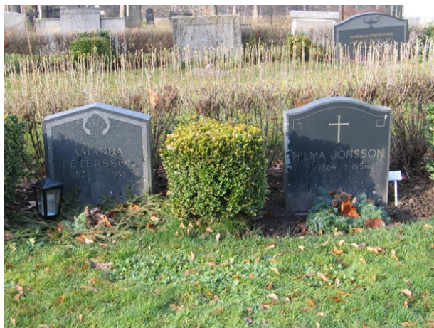
Linjegravvårdar i kvarter II (KI Fågelfors kyrkog 070)