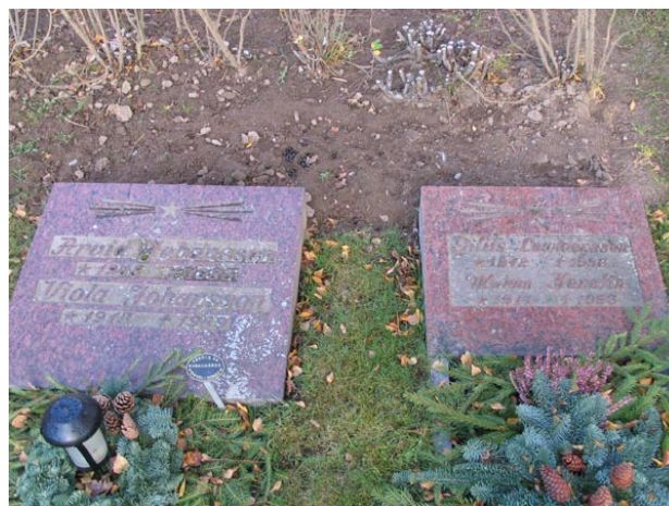
Liggande vårdar i röd granit i urlunden, kvarter V (KI Fågelfors kyrkog 145)