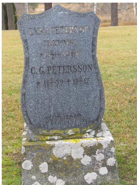
Sköldformad granitvård i kvarter I (KI Fågelfors kyrkog 065)