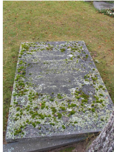
Liggande vård, kvarter I (KI Fågelfors kyrkog 047)