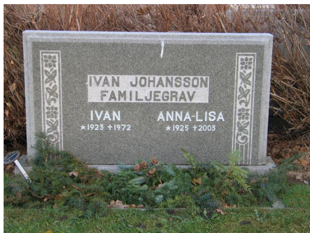
Tidstypisk vård i kvarter V (KI Fågelfors kyrkog 142)

I urlunden finns det en uppmurad åttkantig brunn av röd kalksten som folk brukar kasta pengar i.