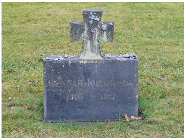
Enkel korsformad linjegravvård från 1927 i kvarter III (KI Fågelfors kyrkog 106)