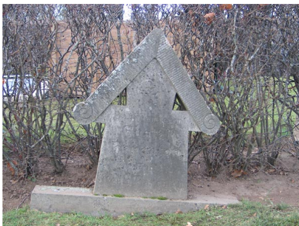
Ovanlig gravvård i granit (KI Fågelfors kyrkog 126)

Det som utmärker kvarteret är den stora variationen av gravvårdar. Här finns enstaka små enkla vårdar i svart granit. Enstaka breda låga vårdar från 1930-talet finns samt höga, stående vårdar från 1920- och 30-talet. Vårdarna är företrädesvis av svart granit men även grå eller röd förekommer. En vård är av kalksten och en av marmor. En av gravarna omgärdas av ett smidesstaket och gravplatsen är grusbelagd. Den tidigaste vården, ett kors i järn, står innanför smidesstaketet och är från 1918. Majoriteten av vårdar är från 1930-talet. Den yngsta vården är en sarkofag från 1963. På ett mindre antal vårdar uppges den dödes yrkestitel. Vanligast förekommande är hemmansägaren. Övriga titlar som finns är kyrkoherden och läroverksadjunkten, kyrkvården, komministern, folkskolläraren och mjölnaren. Den dödes hemort anges på en mindre del av vårdarna.