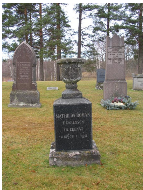
Granitvård med urna från 1911 i kvarter I (KI Fågelfors kyrkog 060)

talets senare hälft har i stort sätt hela området sått in med gräs. Kvarterets äldre karaktär bör bevaras och de spår av kvarterets historia som grusgravar och stenramar utgör bör sparas. Flera av gravvårdarna har ett lokal- och personhistoriskt värde för socknen och församlingen. Gamla gravvårdar kan återanvändas av familjemedlemmar eller nya gravrättsinnehavare genom att man vänder på vårderna och gör en ny inskription på den forna baksidan.