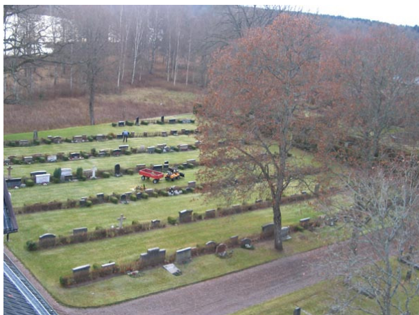
Översikt över kvarter II från nordväst (KI Fågelfors kyrkog 040)