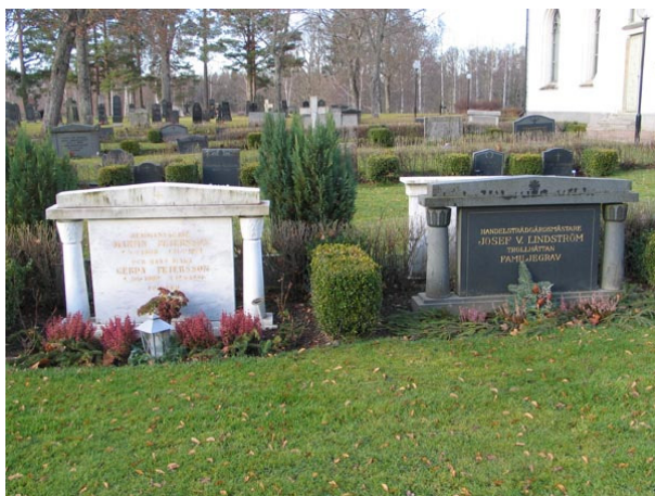
Klassicistiska vårdar i kvarter II (KI Fågelfors kyrkog 081)

Kvarter II består av sju rader av ryggställda gravvårdar med rygghäckar av måbär mellan raderna. Kvarteret domineras av stående låga gravvårdar med klassicistiska drag så som tempellika gavelpartier och pelare. Materialet är främst grå och svart granit men även röd granit förekommer. Ett 10-tal vårdar är tillverkade i marmor. Mellan i stort sätt varje gravplats är det planterat en kort buxbomhäck. Den äldsta vården är från år 1885 och den yngsta är daterad till 2003. Vårdar från 1940- och 50-tal dominerar. Delar av den allmänna linjen, från 1939-51, går fortfarande att följa i kvarteret. Den dödes yrkestitel finns på ett mindre antal av vårdarna. Titlar som finns är f d fjärdingsman, maskinisten, f d byggmästare, verkstadsförmannen, skogsvaktaren, snickaren, maskinsnickaren, grundläggaren, hemmansägaren, lantbrukaren, nämndemannen, smeden, handelsträdgårdsmästaren, disponenten, kusken, kyrkvärden och mjölnaren.