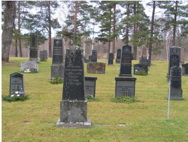
Tidstypiska vårdar från tidigt 1900-tal i kvarter I (KI Fågelfors kyrkog 052)