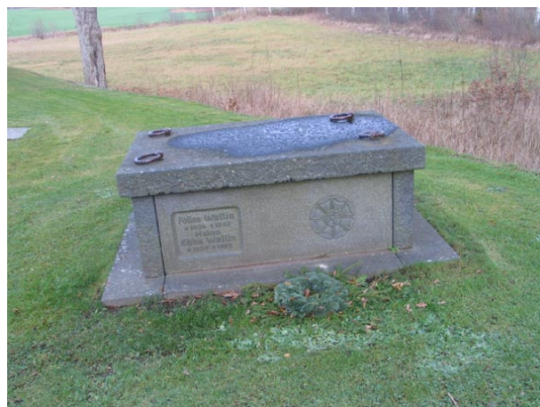
Sarkofag från 1963 (KI Fågelfors kyrkog 128)