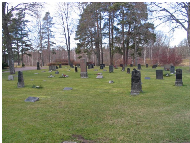
Översikt över kvarter III från nordöst (KI Fågelfors kyrkog 096)

Kvarteret ligger norr om kyrkan och består enligt gravkartan av 154 gravplatser. Kvarteret gränsar i väster mot minneslunden och de lönnar som tidigare utgjorde den västra kyrkogårdsbegränsningen. I norr är kyrkogårdsmuren gräns och i öster är en gräsyta mot kvarter IV. I söder finns kyrkan och delvis en grusbelagd gång. I kvarter III är ett linjegravskvarter från 1920-30-talet. Kvarteret har tagits i bruk från det sydöstra hörnet och det går sedan att följa linjen väster ut. Alla vårdar är vända mot öster. Hela området är besått med gräs.