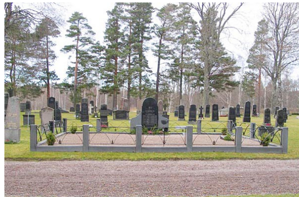
Gravplats med omgärdning av sten och järn, kvarter I. Notera kvarterets enhetlighet (KI Fågelfors kyrkog 048)