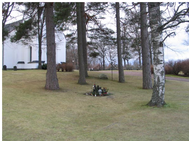
Minneslundan från nordväst (KI Fågelfors kyrkog 010)

I väster och norr är björkar planterade och buskar av typen cornus, forsythia, spirea och potentilla. I gränsen mot kvarter III, vilken tidigare utgjorde kyrkogårdens västra gräns, växer det lönnar.