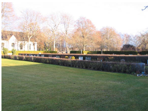
Översikt över kvarter VI från sydväst (KI Fågelfors kyrkog 160)