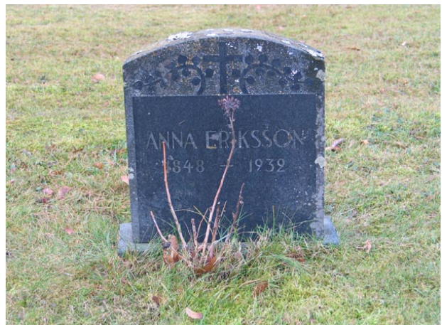
Tidstypisk gravvård från 1932 i allmänna linjen, kvarter III (KI Fågelfors kyrkog 107)