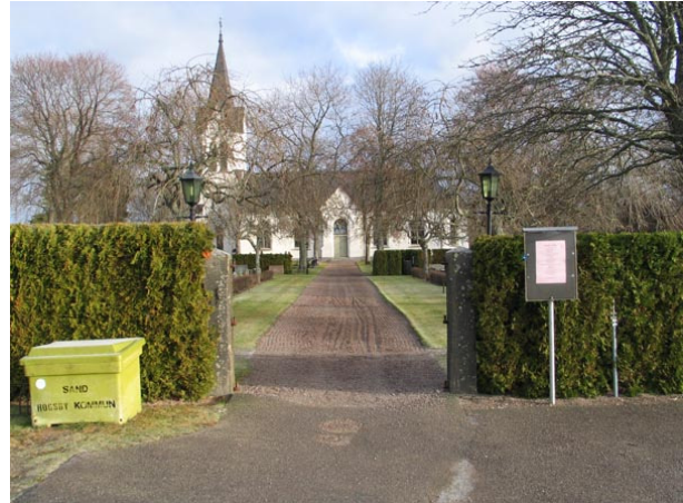
Ingång i söder (KI Fågelfors kyrkog 025)