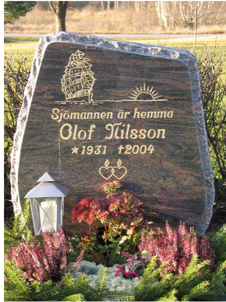
Korsformad vård i kvarter V (KI Fågelfors kyrkog 137) Modern vård i kvarter VI (KI Fågelfors kyrkog 134)