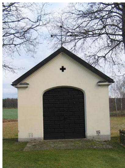
Bårhuset uppfört 1943 mellan kvarter III och IV (KI Fågelfors kyrkog 015)