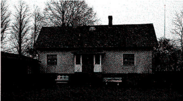
Bostadshusets (huvudbyggnadens) exteriör.