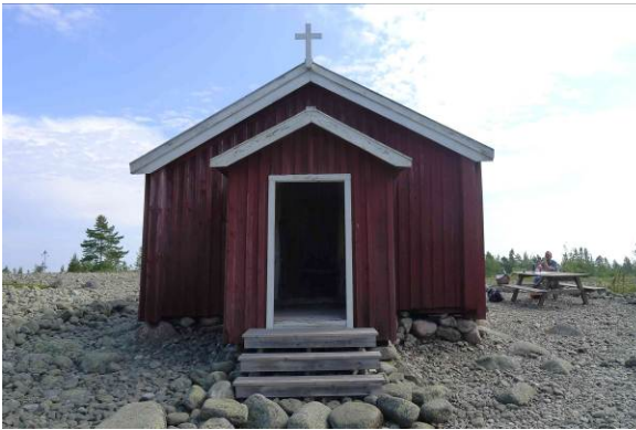
Fasad mot väster

Kapellet ligger på den sydöstra delen av Snöan som heter Österskatan. Vid udden på öns västra sida, Västerskatan, finns äldre fiskebebyggelse som numera används för fritidsändamål. Ortofoto från Länsstyrelsens webbgis.