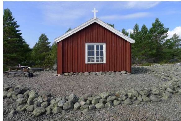
Fasad mot öster och kyrkotomten med antydd bogårdsmur