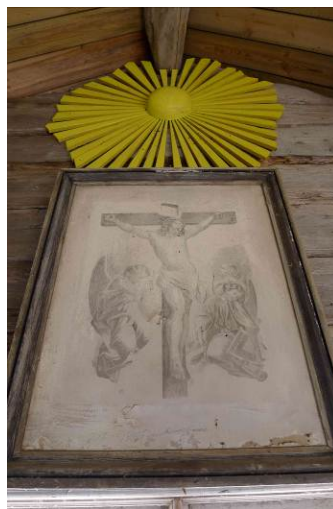
Altartavlan från 1882