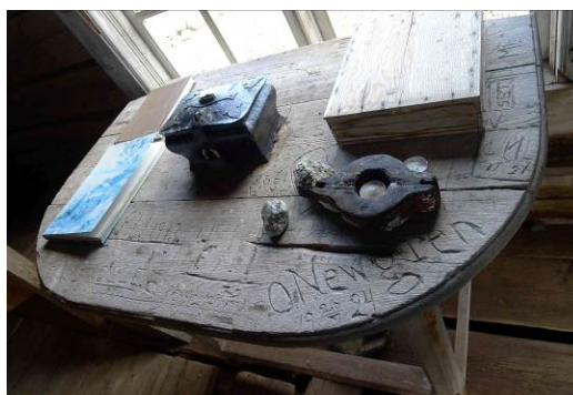
Bordsskivan med inristningar.