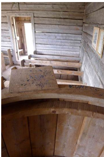
Interiören sedd från predikstolen.