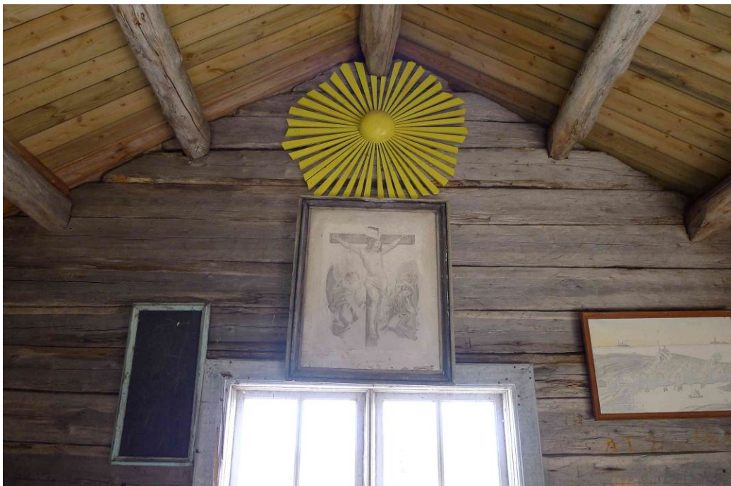
Interiör mot öster. Ovan korfönstret hänger altartavlan från 1882 och en sentida strålsol. Psalmnummertavlan är en griffeltavla med ram. Tavlan till höger är från 1910 och föreställer kapellet och fiskestugorna som låg i havsviken sydväst om kapellet.