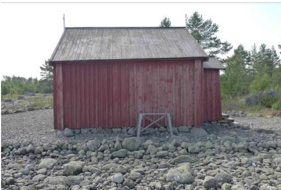
Fasad mot norr