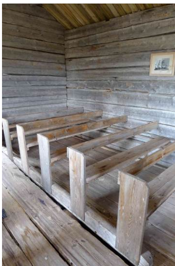
Den väggfasta bänkinredningen.