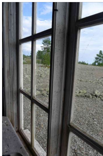
Korfönstret med sexrutiga fönsterbågar och fina profiler.