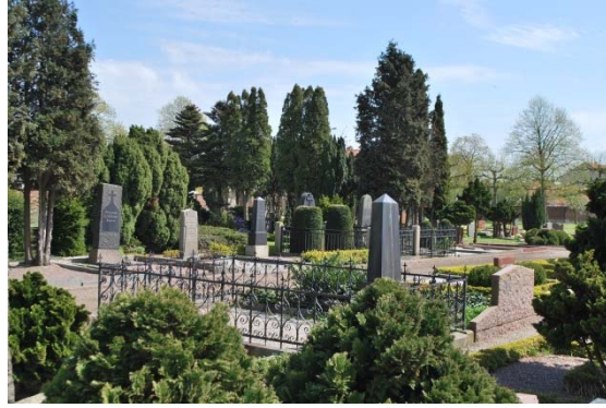
Rund plats på del från 1922. Ekelund och Emonds gravar. Rik växtlighet.

”Gröna kyrkogården”, innehåller minneslund, urngravar och askgravplatser. Minneslundens centralpunkt är en rund damm med skulptur. Utanför ligger som ”ringar på vattnet” urngravplatser där gravstenarna står mot böjda rygghäckar av vintergrön häck. Askgravplatserna är liggande stenar med ett metallöv med namn placerade i planteringar med böjda former. På Gröna kyrkogården växer övervägande lövträd, inte barrträd. En del är mer naturlig med höga träd och liggande gravstenar i gräsmatta utan inramningar.