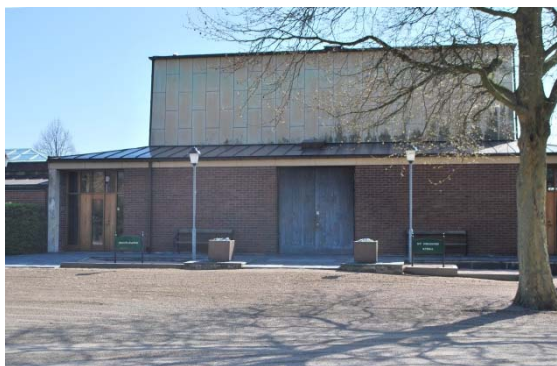
Entré till kyrkan.