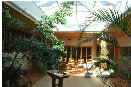
Glasöverbyggd gård. "Livets rum".

Till Græbes ursprungliga delar hör ett rum vid sidan om kapellet som tidigare var körrum men numera fungerar som barnrum. Rummet har kalkstensgolv, vitmålade tegelväggar och tak av träpanel med synliga balkar. En vägg är glasad från golv till tak med vertikala indelningar i trä. Glasväggen är vinklad så att rummet är smalt i ena änden och brett i andra. Utanför finns en kringbyggd gård.