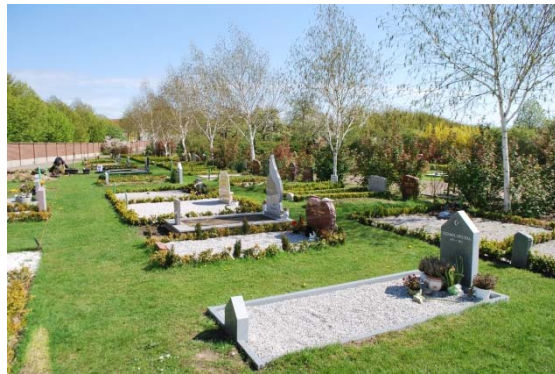
Urngravplatser med stenar längs rygghäckar.