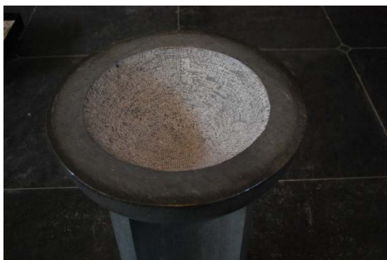
Dopfont i kalksten.

Dopfont , från 1961, av slipad kalksten, tillverkad av AB Komstasten, Gärsnäs. På en rund fot står en tresidig pelarform med insvängda sidor. Cuppan är halvklotformad med plan blankslipad översida och skålformad nedhuggning för dopskålen. Huggmärken i skålen bildar ett dekorativt element. Troligen ritad av Eiler Græbe.