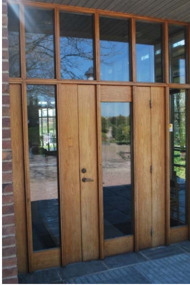
Entré till vänthall intill kyrkan.