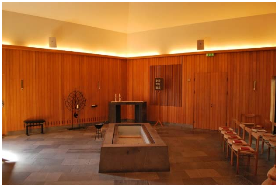
S:t Jakobs begravningskapell.

Rummet är femkantigt och ljuset är dämpat. Golvet är av hyvlade kalkstensplattor. Fyra av hörnen är glasade med blyinfattat glas, vid det femte hörnet står stenaltaret. Ett av de glasade hörnen är omgjort till en dörr med utgång till den överglasade gården. Mitt i rummet står en katafalk klädd med slipad kalksten. Mot öster står orgeln. Väggarna täcks till 3/4 av stående ekpanel, därovan är väggarna vitmålade. En sockel av kalksten finns i underkant. Ventilationen är dold genom springor i panelen. Ett träraster i väggpanelen är kvar sedan orgeln var inbyggd i ett intilliggande rum. Tekniken till klockringningen är dold i ett skåp infällt i väggen med panellucka. All belysning är uppljus, dold i ovankant av panelen. Taket är ett femdelat vitmålat pyramidtak. Dörrarna är ekdörrar med vertikala spår, entrédörren med infällt glas i smala slitsar.