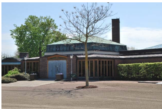
Entré till kapellet mot norr.

beklädnadsförband, med en halv stens förskjutning. Kyrkorummet sticker upp med en kub och höjer sig över de övriga utrymmena och dess fasad är klädd med marmor. Fönstren är höga, smala, vertikala och av ek med fönsterbleck av koppar. Portarna till kyrkan och kapellet är dubbeldörrar klädda med ärgad koppar i ett reliefmönster med kors. Kyrkporten har smala ljusslitsar med bågar av koppar vid sidorna. Kapellporten har ett trekantigt överljusfönster av trä. Förbindelsegången består delvis av rödaktigt tegel och glaspartier av ek med en sockel av svart skiffer. Dörrar till vänthall och urnutlämning är glasade ekpartier. På södersidan finns tre portar klädda med koppar till krematoriedelen.