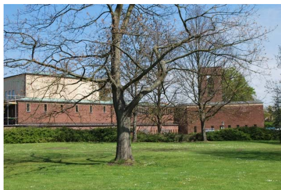
Fasad mot söder.