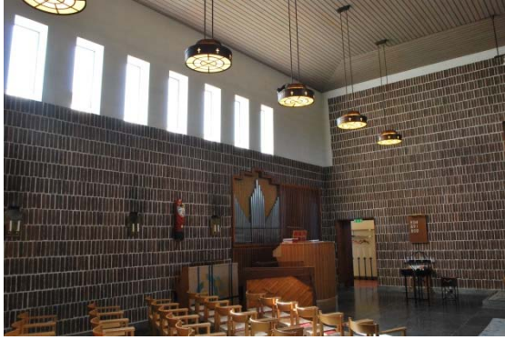
Kyrkorummet mot orgeln i öster.