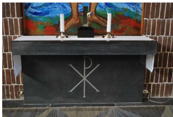
Altare av polerad kalksten.

Predikstolen är från 1961, troligen ritad av Eiler Græbe. Predikstolen har en sockel av kalksten och en tresidig korg av lackad stående ekpanel med en gråmålad sarg överst med en lutande pulpetskiva. Predikstolen är ansluten till väggen.