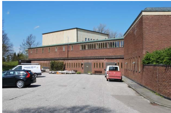
Fasad mot sydöst, entré till krematorium.

Klockorna hänger i en öppen klockstapel av tegel, som också fungerar som skorsten till krematoriet.