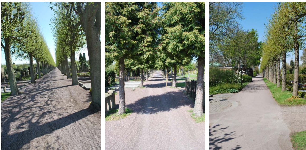
Gångar med trädalléer och långa siktlinjer.

”Nya begravningsplatsen” kännetecknas av symmetri och axialitet med långa siktlinjer och gångar med trädalléer. Gravplatserna är omgärdade med stenram, smidesstaket eller vanligast buxbom.