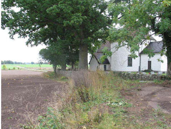
Vallmuren och träden på norra sidan. (KI Voxtorp kyrkog 013)

norra. På den del av muren som löper vid klockstapelns finns dock ingen vall och muren är av en annan karaktär och murad i en annan tid än den övriga. Troligen skedde detta i och med att kyrkmurens sträckning ändrades i samband med uppförandet av ekonomibyggnaden 1960. Runt om kyrkogården är det ask, ek, lönn och poppel planterade.