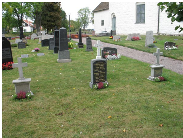
Gravvårdar med kors i marmor, södra delen (KI Voxtorp kyrkog 032)

Södra delen omfattar området söder och öster om kyrkan. Området delas i två delar av grusgången som löper i öst – västlig riktning genom kyrkogården. Åt söder avgränsas området av kyrkogårdsmuren och i norr av grusgången och kyrkan. Den södra delen av kyrkogården rymmer 351 gravplatser. Generellt är det de höga resta vårdarna som ger området dess karaktär. Kronologiskt finns här en jämn spridning under alla 1900-talets årtionden. Alla gravvårdarna står i rader vända mot öster. Förutom ett fåtal bevarade grusgravar är hela området insått med gräs.