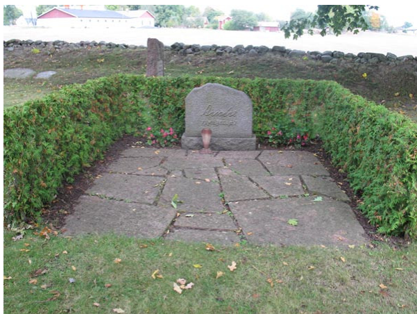
Den enda gravplatsen som omgärdas av en häck på kyrkogården (KI Voxtorp kyrkog 041)