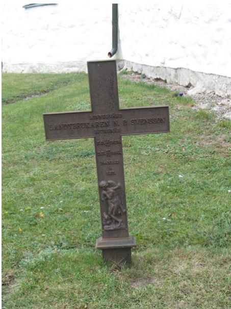
Gjutjärnsvård, kyrkogårdens äldsta gravvård från 1829 (KI Voxtorp kyrkog 034)