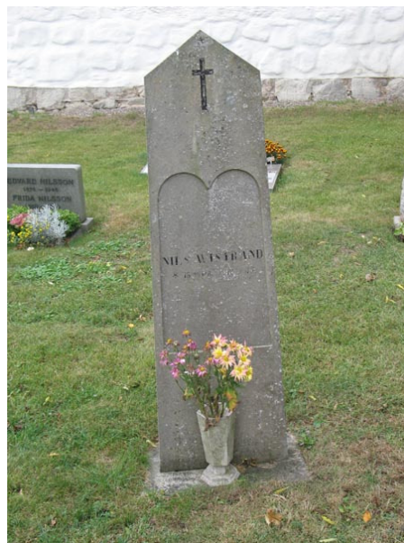
Kalkstensvård rest 1875 över Nils Wistrand (KI Voxtorp kyrkog 037)