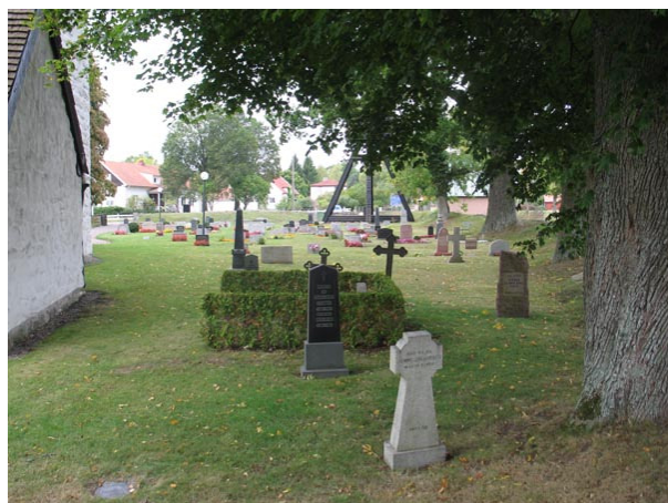
Översikt norra delen från öster (KI Voxtorp kyrkog 039)

Den södra delen av kyrkogården rymmer flertalet av de äldsta gravarna. Området karaktäriseras av en stor blandning och gravvårdar från alla 1900-talets årtionden men domineras av höga resta i framförallt svart granit. De vårdar som är från mitten av 1800-talet och äldre samt gjutjärnsvårderna skall föras in på inventarieförteckningen. Grusgravar var tidigare vanliga på Voxtorps kyrkogård och de få som finns kvar bör bevaras. Liksom även detaljer, så som stenramar, som påminner om grusgravarnas tid.