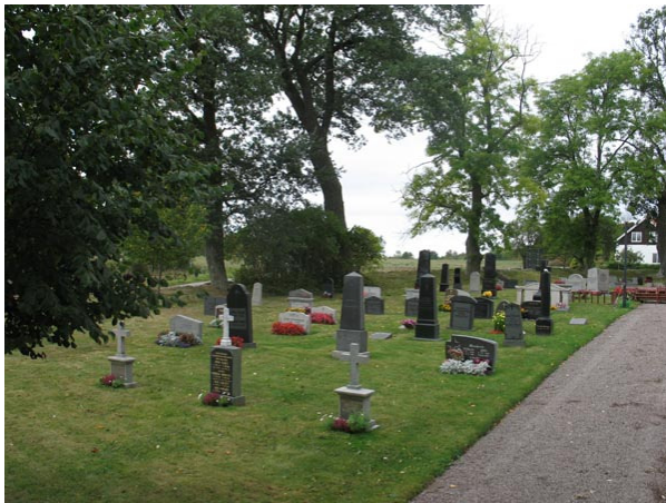
Södra delen från nordöst (KI Voxtorp kyrkog 019)