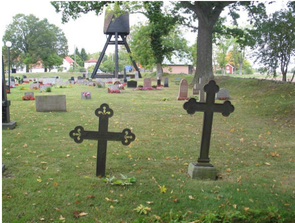
Gjutjärnsvårdar på norra delen. Det vänstra rest över S Johansson 1881 det högra saknar text (KI Voxtorp kyrkog 042)

Norra delen utgörs av de gravvårdar som finns på den norra sidan om kyrkan. I söder avgränsas området av grusgången och kyrkan och åt norr avgränsas området av kyrkogårdsmuren. Alla gravvårdarna, utom en, står i rader vända mot öster. Området rymmer 300 gravplatser. Generellt är de låga rektangulära vårdarna som ger området dess karaktär. I det nordvästra hörnet är klockstapelns placerad. Endast en grusgrav är bevarad och resten av området är insått med gräs.