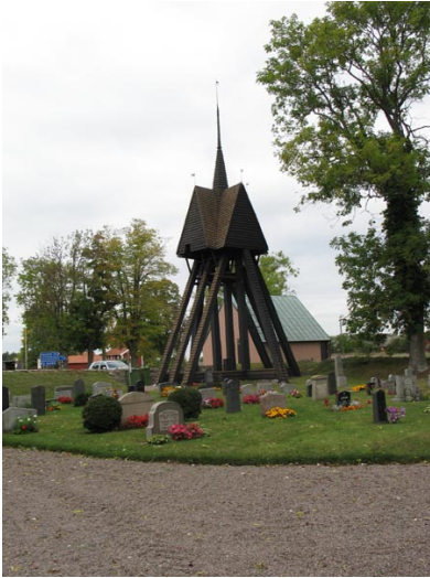
Klockstapeln av okänd ålder (KI Voxtorp kyrkog 052)

Utanför muren i det nordvästra hörnet intill klockstapeln finns pannhuset. Det uppfördes under åren 1959-60 i lättbetong, med putsad fasad och koppartak. Huset innehåller också förråd. På andra sidan gatan i sydväst är församlingshemmet.