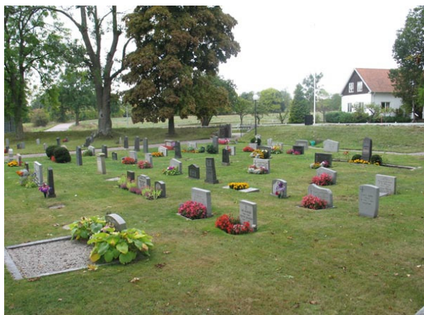
Översikt norra delen från norr (KI Voxtorp kyrkog 047)