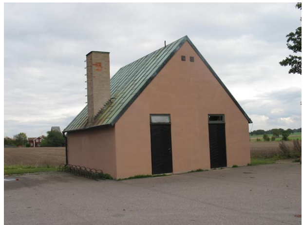
Ekonomibyggnad byggd 1960 utanför kyrkogårdens nordvästra hörn (KI Voxtorp kyrkog 053)