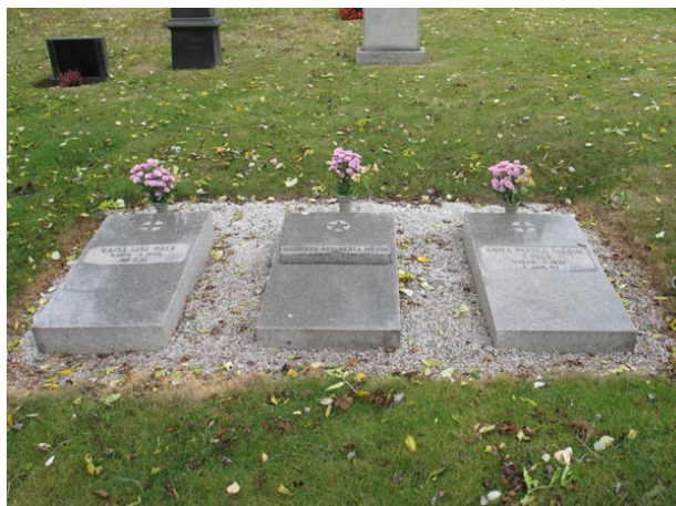
Liggande gravvårdar på södra delen (KI Voxtorp kyrkog 029)