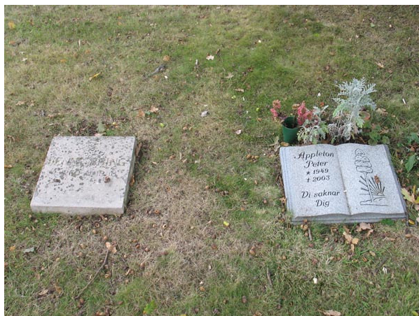
Liggande gravvårdar (KI Voxtorp kyrkog 044)