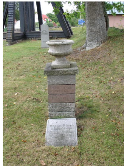
Kalkstenspelare med urna från 1936 (KI Voxtorp kyrkog 046)