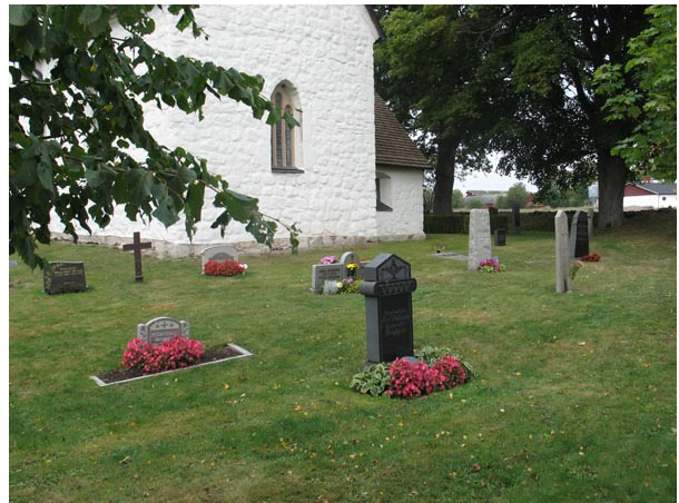
Södra delen, öster om kyrkan från sydväst (KI Voxtorp kyrkog 021)