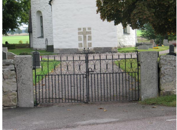
Ingång från norr. Det står år 1896 på grindarna (KI Voxtorp kyrkog 001)