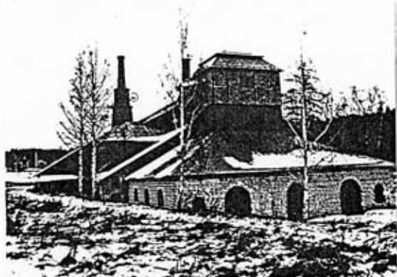
Movikens masugn efter avslutad renovering 1979