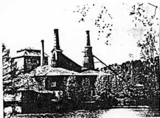
Masugnen vid 1900-talets början

Den första masugnen i Moviken byggdes 1795-96 för att förse hamarsmedjorna vid det närbelägna Strömbacka bruk med tackjärn. Tidigare hade tackjärnet hämtats från Österbo masugn ytterligare en och en halv mil från bruket, vilket medförde besvärliga och kostsamma transporter av malm och tackjärn. Genom att den nya masugnen placerades nära stranden av Norra Dellen kunde malmen nu också skeppas direkt till hyttan utan den sista omlastning för vidare fortransport som tidigare varit nödvändig.