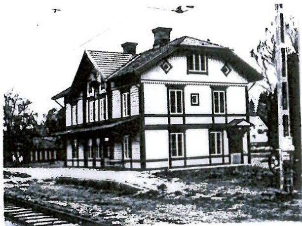
Stationshuset 1985