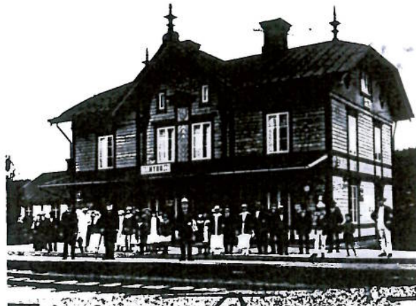
Hybo station i början av 1920-talet Repronegativ hos Ljusdalsbygdens museum