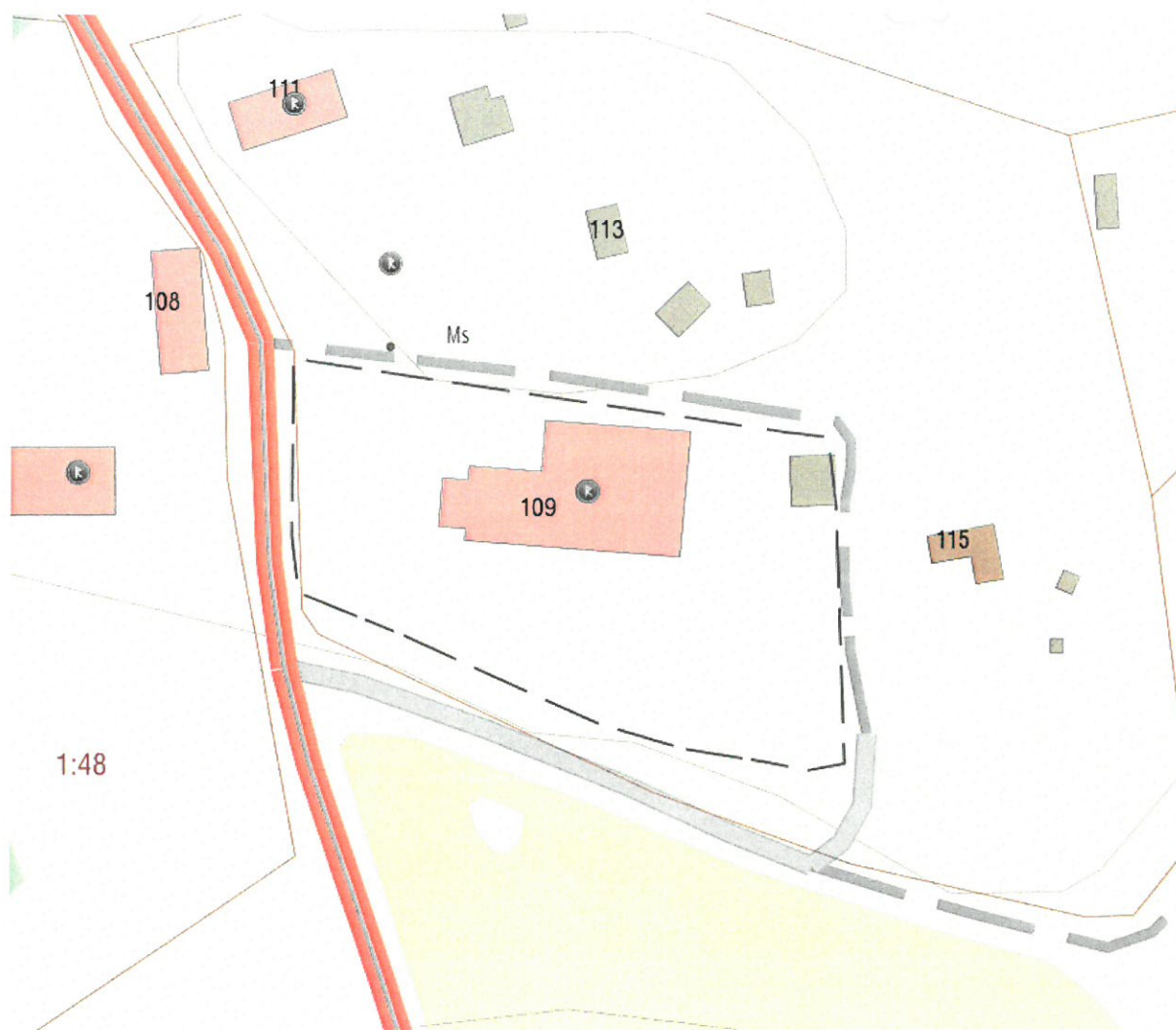
Risinge gamla kyrka (byggnad 109 på kartbilden, den medeltida boden till höger om kyrkobyggnaden)