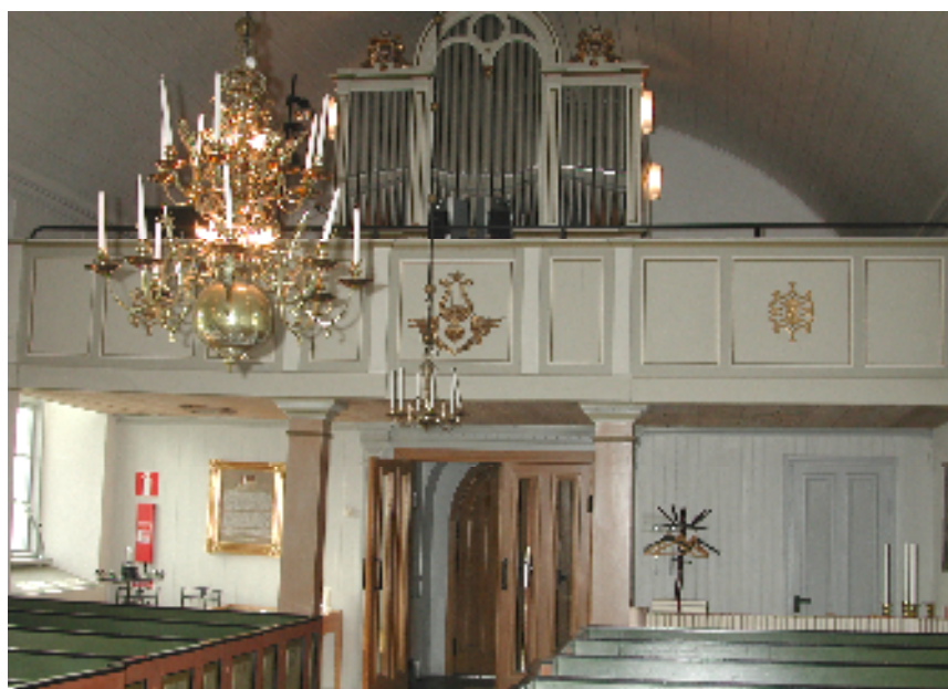
Kyrkans nyklassicistiska orgelfasad är från 1876, men orgelverket blev utbytt 1955. Den panelklädda underbyggnaden rymmer WC och förråd. Ursprungligen kom besökaren från västra ingången direkt in i kyrkorummet, men 1893 avdelades en liten förhall och 1955 tillkom dagens underbyggnad, liksom de inre och yttre pardörrarna