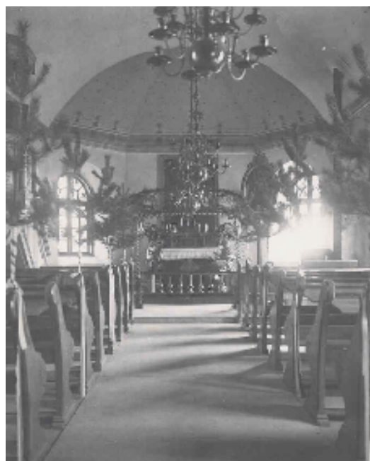
Kyrkorummet år 1911 – foto Eva Timm (digital kopia)

Knappa trettio år senare hade rötskador på nytt uppstått, i brädgolvet under bänkarna och i läktarens bärande pelare. Reparationer skedde 1930 efter arkitekt Ärland Noréens handlingar.