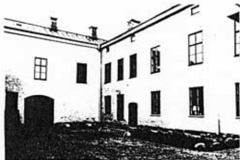
Gården efter restaurering 1986

I gatufasaderna har originalfönstren med sina innanfönster kunnat bevaras. Invändigt har planlösning och rumsanvändning bibehållits med mycket små förändringar och ursprungliga snickerier har bevarats.