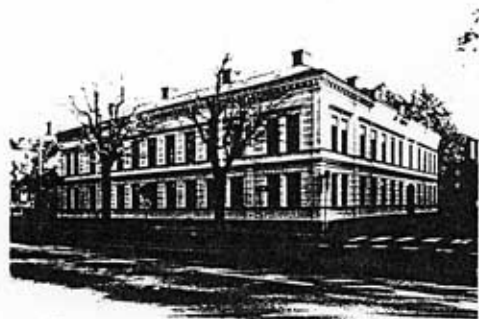
Kvarteret Kollegan 1 1986

KV KOLLEGAN 1, bostadshus Norr 4:1 Gävle stad, Gävle kommun