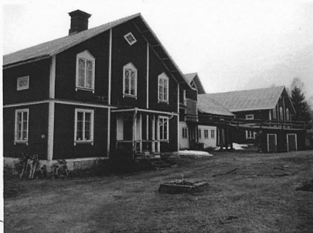
Ladugården av byggmästaren Jonas Holm som daterat ritningarna 1902. I delen närmast fotografen är bostadsdelen inrymd.