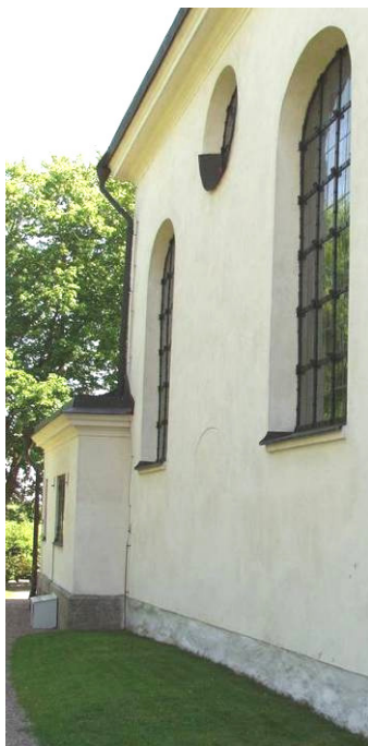
Norra sidan, med sakristian i bakgrunden – digitalfoto Rolf Hammarskiöld

upp till fönstrens underkant. Tornets översta del består av gråsten uppblandat med tegel, långhusets övre murar och sakristian helt av tegel. Långhusets brutna, valmade tak täcks sedan 1986 av kopparplåt, tornets lanternin av äldre kopparplåt och längst upp av spån.