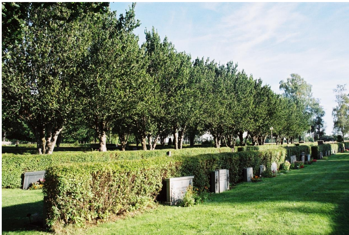
Nya kyrkogården söder om kyrkan. Foto: Niss Maria Legars, Stockholms läns museum, 2004.