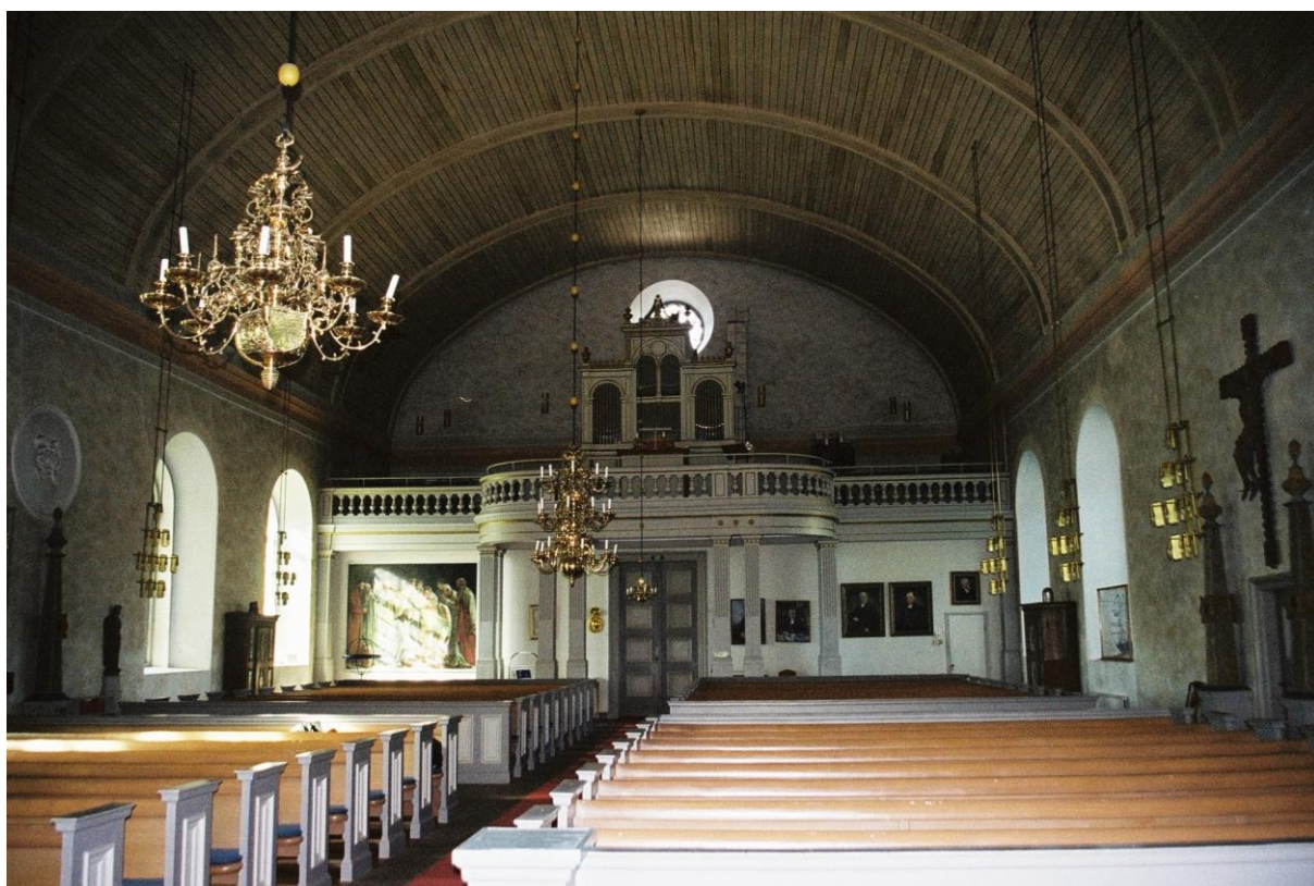
Kyrkorummet mot norr. Foto: Niss Maria Legars, Stockholms läns museum, 2004.