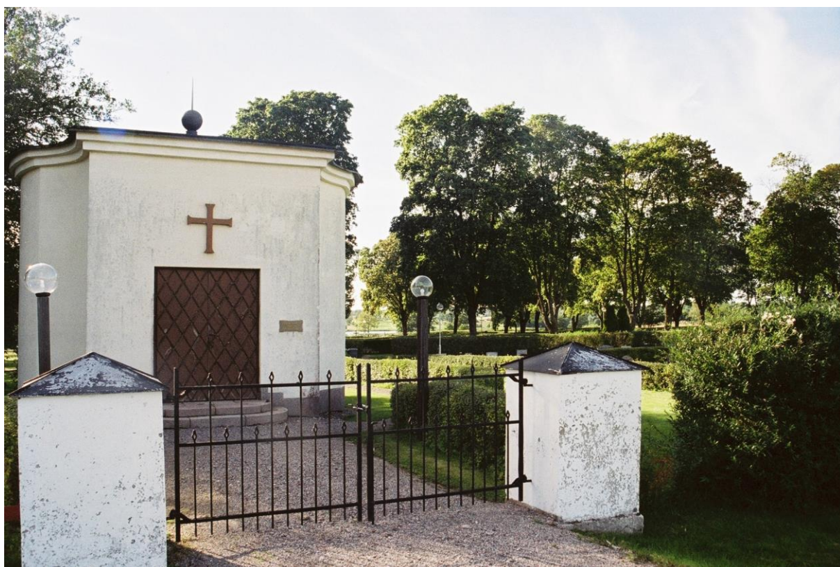
Gravkapellet på Norra kyrkogården. Foto: Niss Maria Legars, Stockholms läns museum, 2004.