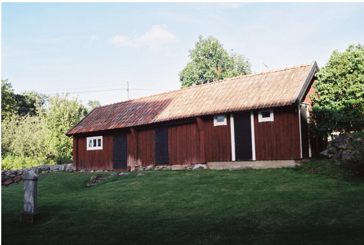
Äldre ekonomibyggnad öster om kyrkan. Foto: Niss Maria Legars, Stockholms läns museum, 2004.