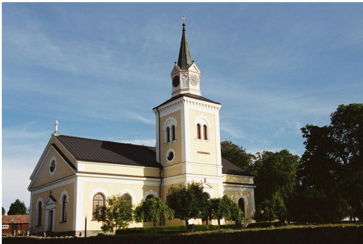
Väddö kyrka från nordväst. Till vänster skimtar stenmuren samt den äldre ekonomibyggnaden. Foto: Niss Maria Legars, Stockholms läns museum, 2004.