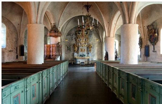
Kyrkorummet åt öster.

Kyrkorummets nuvarande form härrör från tidigt 1600-tal, då kyrkan utvidgades åt väst och ändrades till en treskeppig kyrka med fyra travéer . Kryssvalven är från samma tid och bärs upp av kraftiga pelare. Väggar och valv är vitkalkade med undantag för korets och norra långhusväggs fragment av 1530-talets kalkmålningar, framtagna vid 1915-års restaurering.