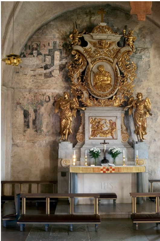
Altaruppsatsen och kalkmålningar från 1500-talet.