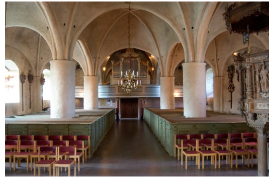
Kyrkorummet åt väster.

två förgyllda änglar. Bildhuggaren Rohsenberg var inflyttad från Tyskland och medarbetare till tidens ledande barockkonstnär Burchardt Precht. En likadan altaruppsats finns enligt uppgift i Frösö kyrka i Jämtland. 1979–80 tillkom det nuvarande altaret med tillhörande altarring efter ritningar av arkitekten Uno Söderberg.