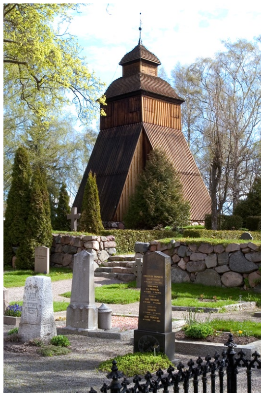
Klockstapeln vid Danderyds kyrka.

Kyrkogårdens första utvidgning söder om gamla muren utfördes 1916 efter ritningar av Lars Israel Wahlman, en av dåtidens stora arkitekter. Redan 1922 utvidgades kyrkogården ytterligare och ett gravkapell uppfördes, även det efter ritningar av Wahlman. Intill kapellet byggdes ett bisättnings- och blomsterrum 1976 efter ritningar av arkitekten Uno Söderberg. Strax öster om kyrkan står klockstapeln på en naturlig bergshöjd i landskapet med björkar, stigar och utplacerade stenbänkar. Klockstapeln är upp-