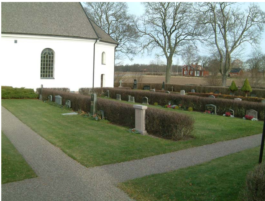
Södra kvarterets östra del.

Kvarteret präglas av raka rader gravvårdar mellan rygghäckar. Avslutningen på två av dessa i T-form gör att halvslutna rum bildas på två ställen. Kvarteret delas i två lika stora delar av gången från södra portalen ut till nya kyrkogården.