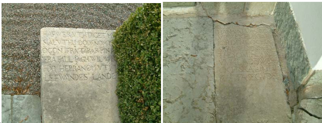
Exempel på äldre gravstenar som trösklar i södra portalen.

Ett flertal av de för 16- och 1700-talen typiska kalkstensvårdarna har funnits på kyrkogården. Vid byggnationen av den nya kyrkan kom de att användas i kyrkbygget. Ett flertal ligger som tröskelstenar vid södra portalen och ytterligare en ligger som tröskel mellan tornet och långhuset. I tornet förvaras små fragment av ytterligare tre.