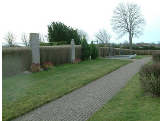
Kvarter M. Västra delen till vänster och södra delen ovan.

Gammalt köpegravskvarter utmed trädkransen och muren. Huvudsakligen höga smala gravvårdar från sent 1800-tal och tidigt 1900-tal. Flera säkerligen ursprungligen ditkomna direkt efter kyrkogårdsomläggningen 1867. En större grusgrav bevarad av ett säkert mycket större ursprungligt antal.