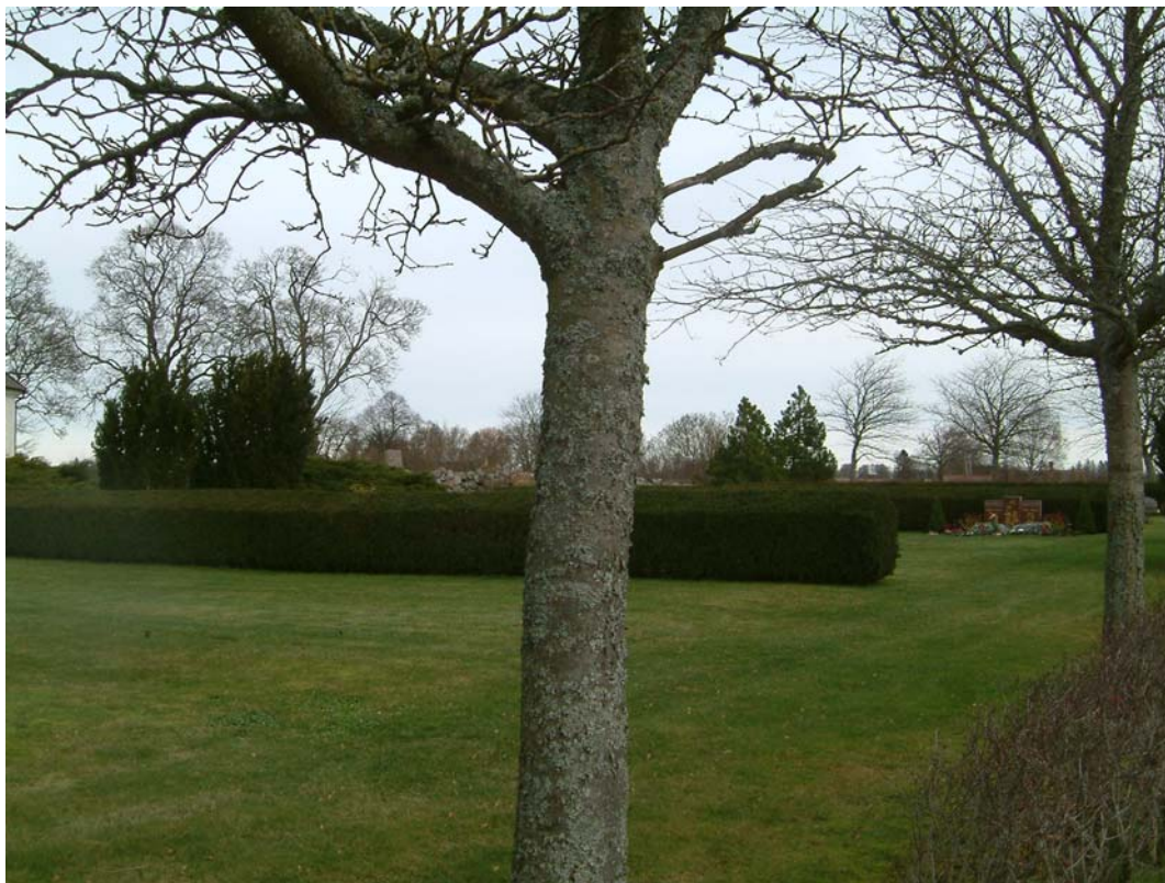
Nya kyrkogårdens östra del sett från söder.

Kvarteret anlades för urnebegravningar under tidigt 1970-tal. Det präglas av den relativt nyanlagda muren, trädkransen och hagtornshäcken samt av minneslundan i nordväst. De flesta rygghäckarna är uppväxa och kraftiga men gravvårdar saknas helt utom ett fåtal längst i öster.