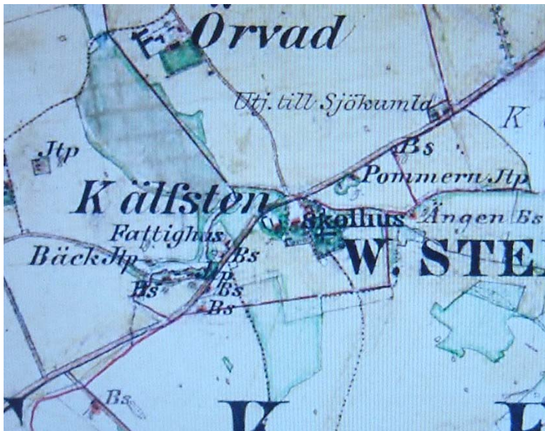
Västra Stenby på häradskartan från 1870-talet. Kartan visar öppet jordbrukslandskap och småskalig bebyggelse, skola och fattighus sydväst om kyrkan.

Väster om kyrkogården finns den gamla skolan och lite längre bort låg socknens fattigstuga. Bortom skolan ligger ett litet samhälle med småskalig bebyggelse och mindre verkstäder bland annat. Norr om kyrkan ligger öppen jordbruksmark. I öst och nordöst höjer sig marken upp mot Sjökumla. På vägen ligger öppen jordbruksmark och utspridd (utskiftad) jordbruksbebyggelse. Mot söder ligger öppen jordbruksmark.