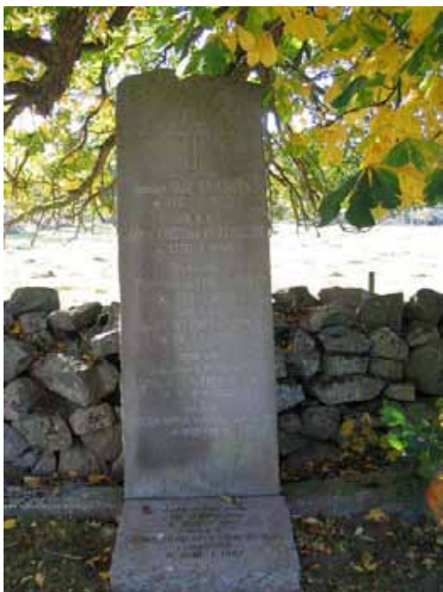
Gravvård i kvarter VI. Här ligger fyra generationer begravda (KI Tveta kyrkog 089)

De framträdande gravvårdar som finns i kvarter VI är höga stående vårdar vilka är placerade längs med kyrkogårdsmuren. I övrigt finns mestadels låga rektangulära vårdar. I kvarteret finns två vårdar utformade som kors och ett par större liggande gravvårdar. Svart och grå granit är de dominerade materialen men här finns även en del vårdar i röd granit. Den äldsta vårdan, som står på ursprunglig plats, är från 1853 och den yngsta från 2000-talet. I övrigt är det en jämn spridning från 1920-talet och fram till 2000-talet. Den dödes hemort anges på de flesta vårdarna. Titlar som finns på vårdarna är riksdagsmannen (2), furiren, ingenjören (2), hemmansägaren, f d handlaren, tandläkaren, överläkaren, professor av nordstjärneordern, bonden, fanjunkaren, kapten och riddaren, banktjänstemannen, kommunalordföranden, historikern och författaren samt kaptenen vid flygvapnet och Riddare av Finlands Vita Rosen Ordern.