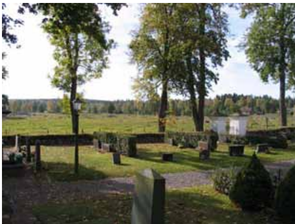
Översikt över kvarter I från nordost. (KI Tveta kyrkog 032)

Kvarter I och IV är belägna söder om kyrkan. Kvarter I avgränsas i söder och öster av kyrkogårdsmuren och i norr och väster av grusbelagda gångar. Kvarter IV avgränsas i söder av kyrkogårdsmuren och omgärdas i övrigt av grusgångar. Mellan kvarter I och IV finns en grusgång. Kvarteren består av ungefär 56 respektive 107 gravplatser. Gravvårdarna är placerade i ryggställda rader och vända mot öster eller väster. I kvarter I finns det häckar av häckoxel planterat som rygghäckar mellan raderna medan kvarter IV endast har en häck mellan raderna längst i öster. Längs grusgången mot kyrkan är en rad med vårdar vända mot norr. Raden av vårdar längst i öster, i kvarter I, består av ett par höga vårdar medan övriga området mestadels har en låg profil med låga eller medelhöga vårdar. I kvarter IV kan man urskilja rester efter ett linjegravssystem. Båda kvarteren är anlagda i gräsmatta.