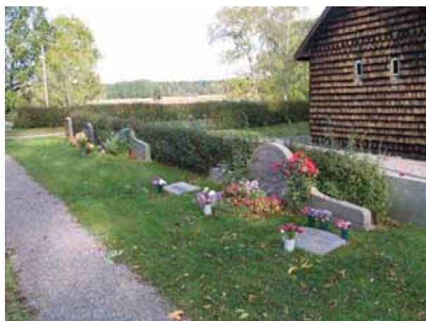
Kvarter V från sydväst. Notera de riktigt breda vårdarna. (KI Tveta kyrkog 007)