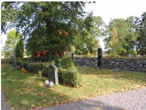
Översikt över kvarter II från sydväst.(KI Tveta kyrkog 041)