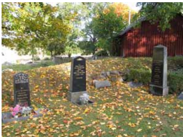
Vårdar från sent 1800-tal och tidigt 1900-tal i kvarter II (KI Tveta kyrkog 049)

I kvarteret finns både höga stående stenar samt liggande vårdar. Materialet är företrädesvis svart granit. De liggande stenarna finns framförallt i anslutning till familjegravarna, där de ofta finns som senare tillägg vid en äldre stående vård. Här finns kyrkogårdens äldsta gravvård i form av ett gjutjärnskors från 1824 vilket ingår i familjen Ugarphs familjegrav. Övriga familjemedlemmar har liggande vårdar runt om. Intill står en mindre gravvård, från 1855, i sandsten med marmorplatta. Vården har tidigare också haft ett marmorkors fäst på ovansidan, vilket nu är borta. I övrigt finns ytterligare fem vårdar från 1800-talet. Resterande gravvårdar representerar 1900-talets alla årtionden. Yngst är en smidesvård från 1995. Kring tre av gravplatserna finns stenomgärdningar. Titlar som finns på gravvårdarna i kvarteret är advokat/fiskal, hemmansägare, ryttmästare, fanjunkare, kaptan, nämndeman och doktor. På de flesta vårdarna anges den dödes hemort.