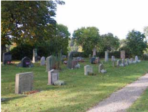
Kvarter VI från sydväst (KI Tveta kyrkog 014)

Kvarteret rymmer några av kyrkogårdens äldsta gravvårdar. Kvarteret har delvis en ålderdomlig karaktär. Här har flera av Tveta sockens inflytelserikare familjer sina familjegravar. De flesta vårdarna är vända mot öster och ett mindre antal mot söder.