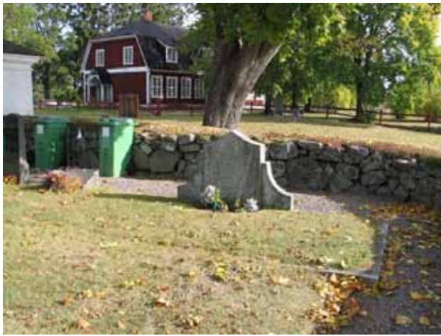
Gravvård med bevarad stenram, kvarter I (KI Tveta kyrkog 036)

det en jämn spridning från 1900-talets alla årtionden. Titlar som förekommer i kvarter I och IV är hemmansägare (6), vaktmästare, skomakarmästare, handlare och smedsmästare. Den dödes hemort anges på övervägande delen av vårdarna.