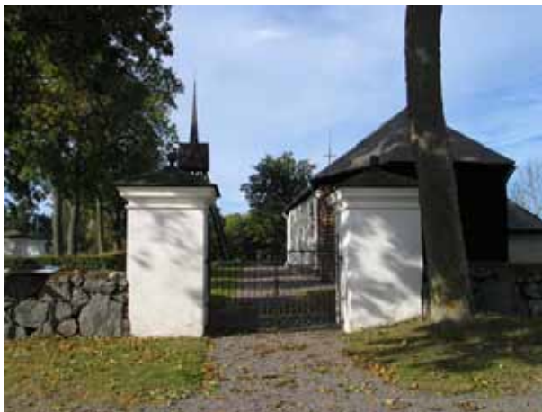
Ingång i öster. (KI Tveta kyrkog 019)