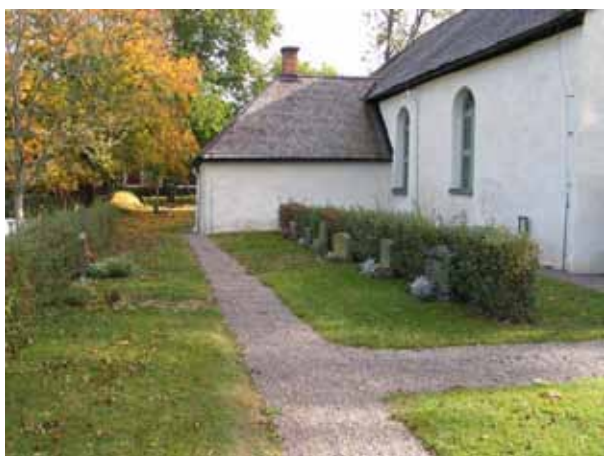
Kvarter III från väster (KI Tveta kyrkog 054)

Kvarter III och V är små kvarter norr och väster om kyrkan. De består av 8 respektive 10 gravplatser. Kvarter III avgränsas i norr av kyrkogårdsmuren, i söder av en grusgång intill kyrkans långhusvägg och i öst och väster av grusgångar. Kvarter V omgärdas på alla sidor av grusgångar. Gravvårdarna är ryggställda med häckar av häckoxel emellan. Framförallt i kvarter III finns det flera tomma gravplatser. Kvarter V består av familjegravar vilka tidigare varit täckta med grus. Båda kvartererna är insådda med gräs.