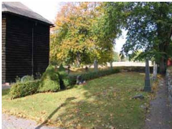
Översikt över kvarter II från sydöst (KI Tveta kyrkog 042)