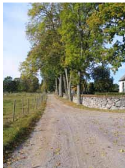
Grusvägen fram till kyrkan och kyrkogårdsmuren från sydöst. (KI Tveta kyrkog 023)