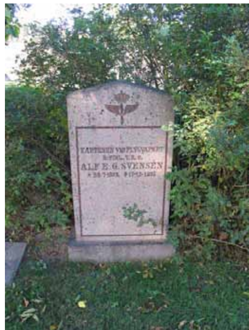
Gravvård i kvarter VI. A. Svensén var Riddare av Finlands Vita Rosens Ordern (KI Tveta kyrkog 078)