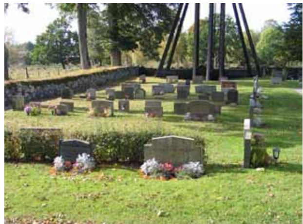
Översikt över kvarter IV från öster. (KI Tveta kyrkog 064)