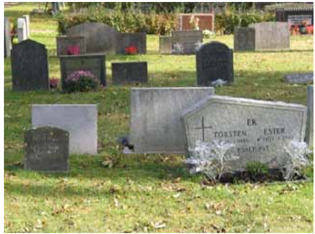
Olika sorters gravvårdar, kvarter IV. De riktigt små är sannolikt linjegravsvårdar (KI Tveta kyrkog 006)