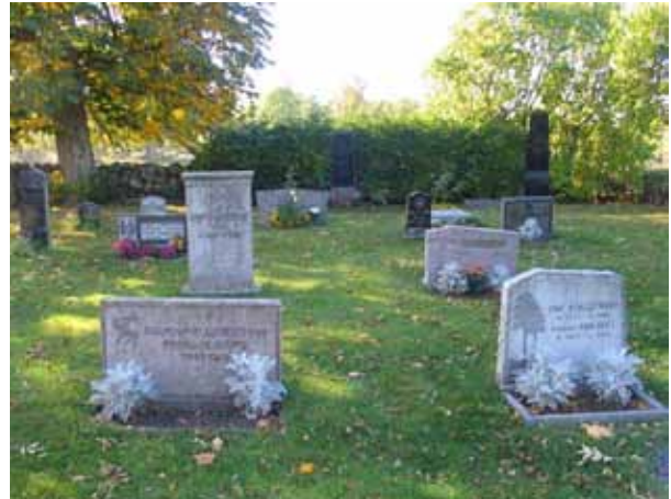
Olika gravvårdar i kvarter VI. (KI Tveta kyrkog 074)