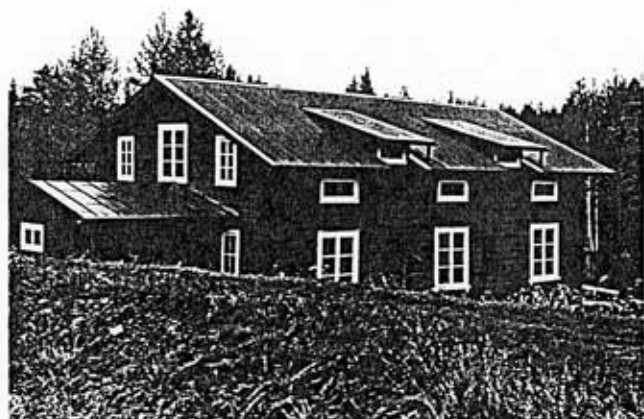
Spinneribyggnaden från sydväst 1988

Västansjö ullspinneri tillkom genom bildandet av ett mindre spinneribolag i byn Västansjö år 1864. Bolaget bestod av fyra bönder och en torpare samt skräddaren Lars Lindblom, vars familj senare ensam övertog spinnerirörelsen. För spinneriets inrättande inköptes torpfastigheten Getholmen med åtföljande fallrättighet i Gällsån. I köpet ingick även en befintlig mindre dambyggnad.