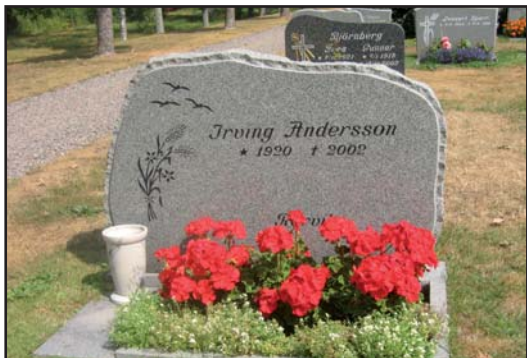
Åldern på kyrkogårdens gravvårdar sträcker sig från 1862 till 2005 och utformningen av vårdarna visar den utveckling som gravkonsten genomgått.

kyrkan, en öppen plats skapas vid tornet och koret.