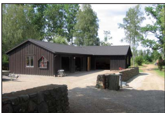
Redskapsboden vid kyrkogårdens nordöstra hörn har uppförts i två etapper: 1970 och 1999.