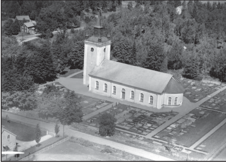
På flygfotot från 1940-talet syns hur utbrett gravskicket med grusbäddar var. Idag finns endast en grusgrav bevarad.

1960-talet togs de flesta av de häckar som ramade in gravkvarteren i söder bort. Denna utveckling mot en enklare och mer lättkött kyrkogård är typisk för andra hälften av 1900-talet. 2003 inrättades en minneslund som ett typiskt tecken på vår tids nya önskemål och förutsättningar.