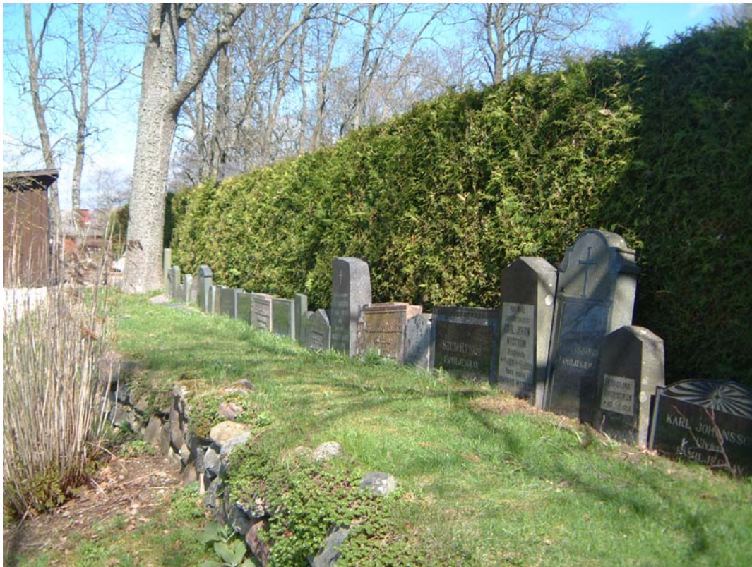
De borttagna gamla linjegravstenarna från det inre norra kvarteret är uppställda i ordning på norra kyrkogårdsmuren.