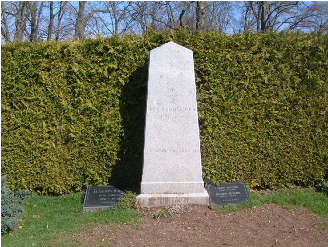
Folkviseupptecknaren och prästen Levin Christian Weides gravvård på Ekebyborna kyrkogård.

SÖ hörnet av kyrkogården förefaller ha varit platsen för en byggnadshytta. Vid gravgrävning här har en stor mängd byggavfall och kalkbruksrester påträffats liksom en borttagen fot till en medeltida dopfont.