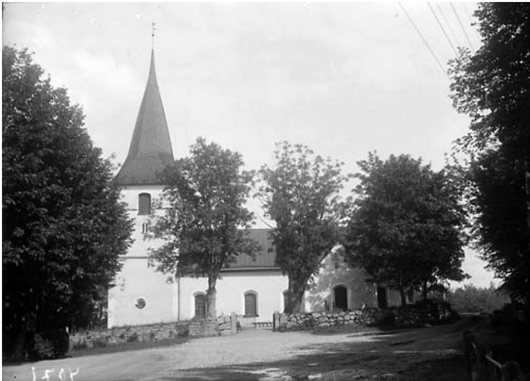
En närbild av kyrkan från samma år visar trädkransen som den då såg ut.

Bilden i Östergötlands bebyggelse från 1946 visar kyrkogården från söder. På denna bild saknas trädkransen helt och kyrkan ligger fri.