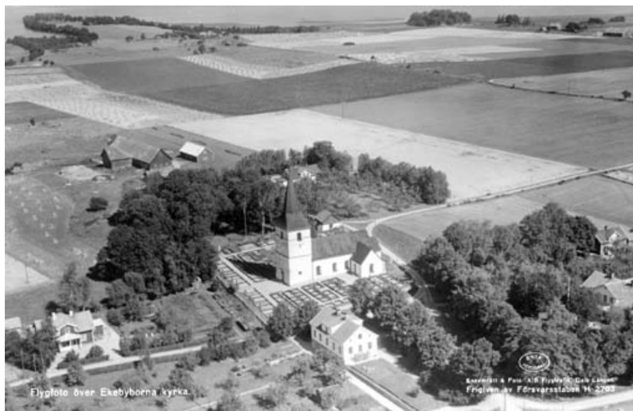
Ekebyborna kyrka på flygbild från 1939. Framför kyrkan syns det inre södra kvarteret med enbart grusgravar. Hela den västra delen av det yttre kvarteret består också av grusgravar. En stor del av dessa har senare försvunnit.

Från Broocmans och Widegrens beskrivningar (17- och 1800 tal) finns inte mycket information att hämta om kyrkogårdens utseende. På kyrkogården stod dock en fristående klockstapel av trä, vilken uppges vara nedbrunnen 1672, återuppbyggd och liksom klockorna bräckt under ringning 1751. Klockstapeln finns med i Widegrens berättelse från 1817 men saknas på Kocks illustration från 1881.