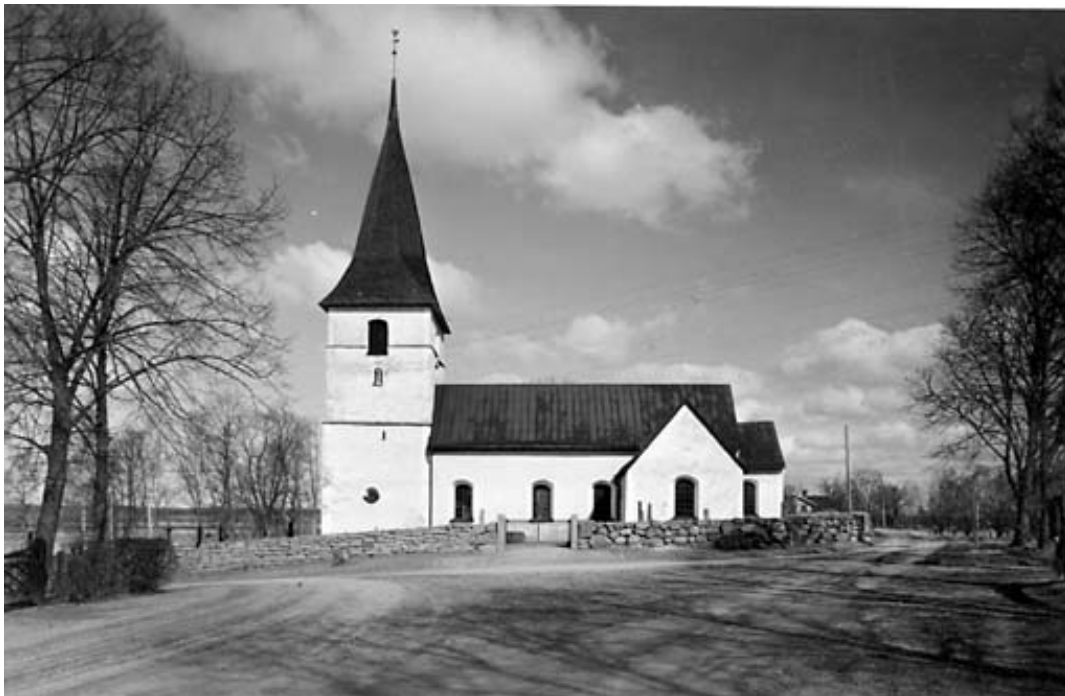
Ekebyborna 1946, Kyrkogården saknar helt trädkrans.

Bilden i Östergötlands bebyggelse från 1946 visar kyrkogården från söder. På denna bild saknas trädkransen helt och kyrkan ligger fri.