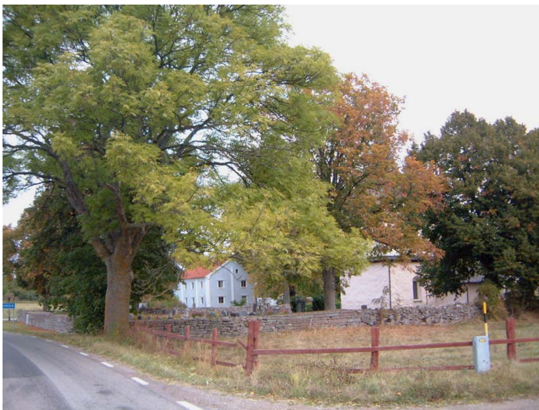
Kyrkogården från sydväst. Murens olika karaktär är väl synlig.

Kyrkogården har sedan medeltiden vuxit fram runt den medeltida kyrkan. I den inventering som utfördes av bogårdsmurar (kyrkogårdsmurar) i Linköpings Stift 2002-2003 bedöms det som troligt att de äldre mursträckorna som innehåller mycket naturkliven granit och inslag av kalksten är från 1700-talet.