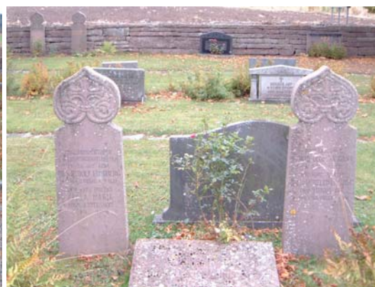
Kalkstensvårdar från tidigt 1900-tal.