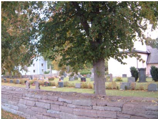
Kyrkogårdens västra del.

Kyrkogården saknar direkt kvartersindelning och har gravnummer 1-167. Beskrivningen nedan berör allmänna förhållanden i början av varje avsnitt. Där det behövs följer en mer detaljerad beskrivning och någon särskild kvartersbeskrivning görs sålunda inte.