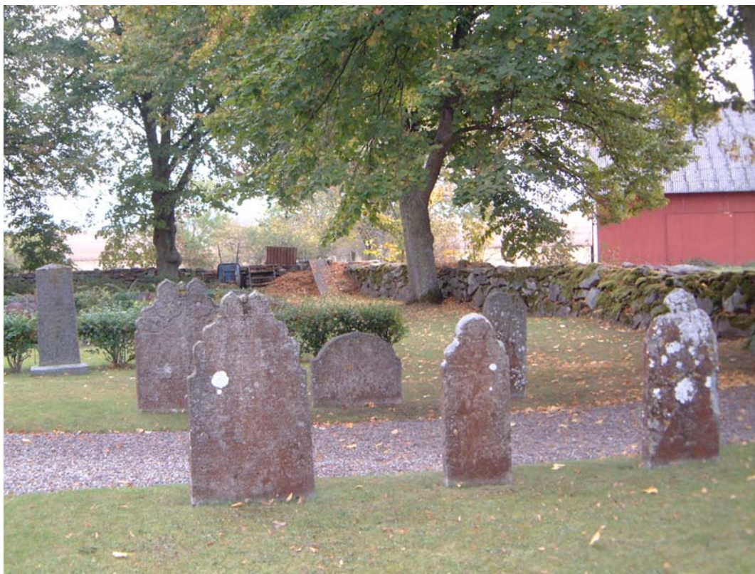
Gravvårdar uppställda söder om kyrkan.

Väversunda kyrkas medeltida karaktär understryks av kyrkogårdsmuren, som troligen inte är medeltida, men som har en ålderdomlig karaktär. Även grindarna har ett högt kulturhistoriskt värde. Trädkransen är viktig för miljön och visar på det parkideal som var gällande på kyrkogårdarna från slutet av 1700-talet, på landsortskyrkogårdarna åtminstone från mitten av 1800-talet. Grusbeläggningen på de få gångarna är av vikt för den enkla karaktären på kyrkogårdens äldre del. Enskilda gravvårdar har ett kulturhistoriskt värde. Det kan grunda sig på gravvårdens ålder, som t ex de uppställda 1600-talsvårdarna söder om kyrkan eller gravvårdens konstnärliga utförande. Det gäller bl a för de två gravvårdarna i rödaktig kalksten från tidigt 1900-tal (051 A-C). Det finns också gravvårdar och gravanläggningar som visar på en äldre utformning av kyrkogården. Till den kategorin hör t ex grusgravarna omgärdade av stenramar och de enkla linjegravvårdarna i smidesjärn. De representerar den mer påkostade familjegraven respektive allmänna linjens enkla vårdar.