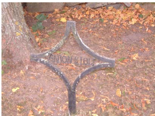
Enkel gravvård i smidesjärn.