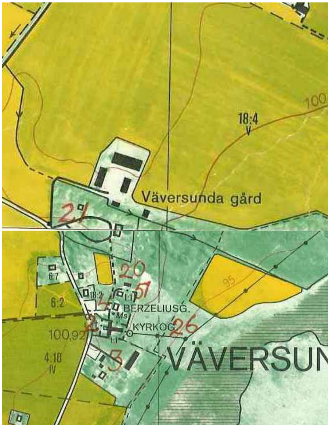
Utsnitt ur ekonomiska kartans blad 084 37 Väversunda och 084 38 Svanshals, 1883.