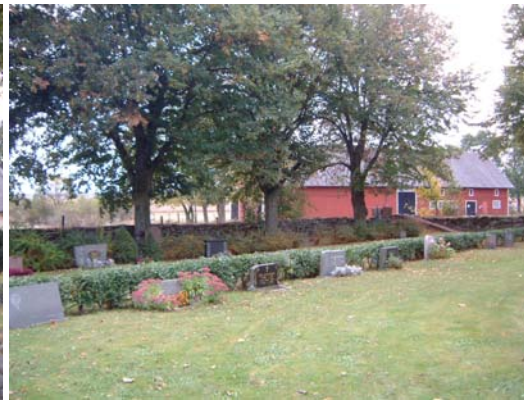
Kyrkogårdens östra del.