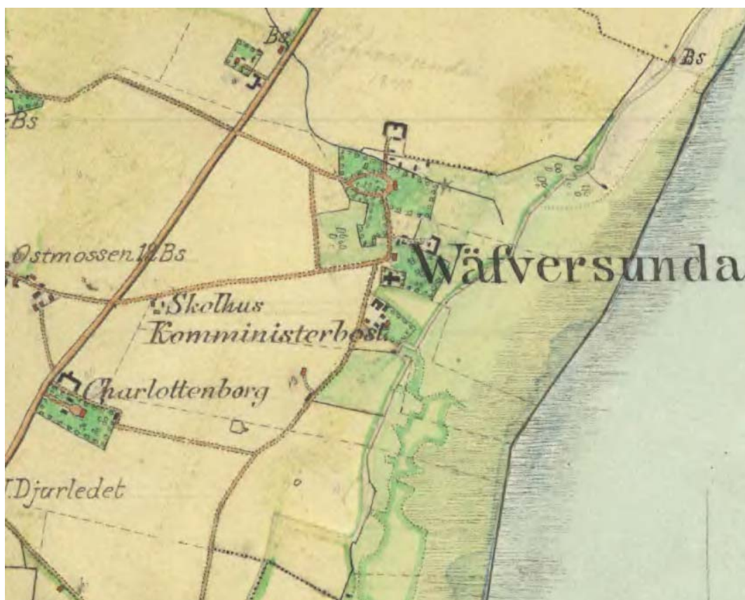
Utsnitt ur häradseconomiska kartan (odaterad), Tåkern..