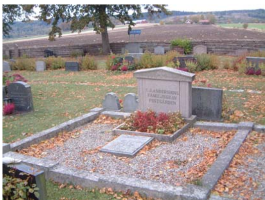
Grusgrav med stenram.

De flesta gravvårdar är sentida, låga och ibland breda. En upphöjd kalkstenshäll från 1850 ligger sydväst om kyrkan. Det finns sex grusgravar varav fem omges med stenram. Vid grusgången från vapenhuset står sex stenar uppställda. De är huvudsakligen från 1600-talet. Två små enkla vårdar i järnsmide hör troligen till allmänna linjen. I den utvidgade västra delen är den tidigaste gravläggningen från 1941. Gravvårdar huvudsakligen av svart, grå eller röd granit, en del av kalksten.