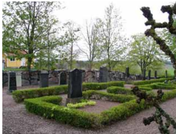
Kvarter III mot nordväst (KI Lofta 0101)