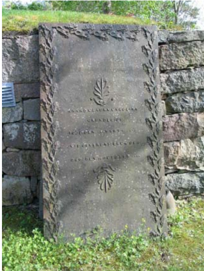
Gjutjärnsvården utanför bisättningskällaren. (KI Lofta 0086)