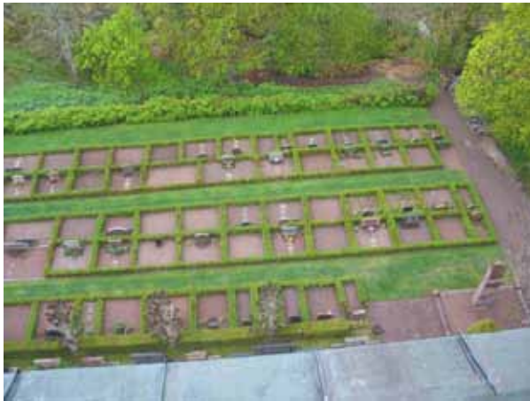
Kvarter I mot söder (KI Lofta 0008)