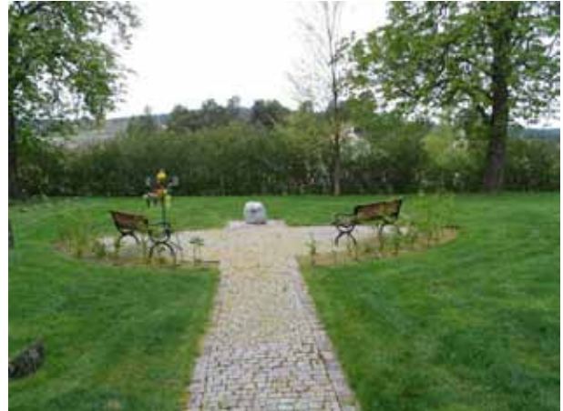
Kvarter VII med minneslund. (KI Lofta 0116)