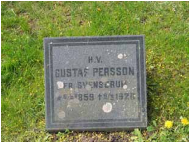
Kvarter VII, representativ vård för linjegravsområdet. (KI Lofta 0188)