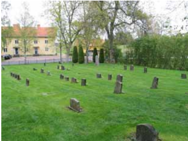
Kvarter V mot nordost. (KI Lofta 0110)

Kvarteret omgärdas av stödmur i norr och av kyrkogårdsmur och syrenhäck i öster. I söder avgränsas kvarteret av grusgång. I kvarteret finns några större träd av lind, lönn och kastanj.