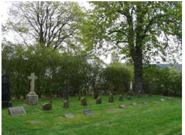
Kvarter VII, området med museivårdar. (KI Lofta 0118)