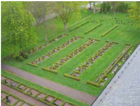
Kvarter IV mot nordost. (KI Lofta 0002)