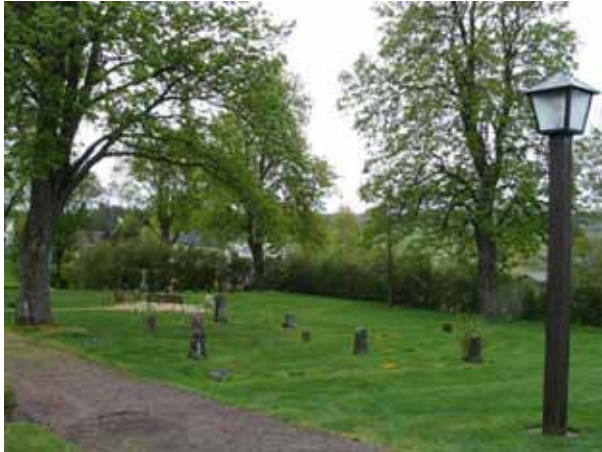
Kvarter VII mot sydost. Linjegravssystem och minneslund. (KI Lofta 0114)