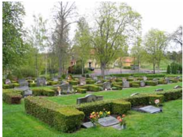
Kvarter IV mot nordost. (KI Lofta 0107)