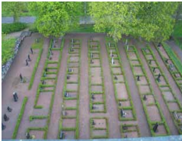
Kvarter III mot norr. (KI Lofta 0003)

Kvarteret omgärdas av kyrkogårdsmur i väster och stödmur i norr och avgränsas i norr och öster av gångar. Till kvarteret kommer man genom ingång från väster eller norr. Längs gången i norr finns fyra pyramidalmar. Som avgränsning mellan den första raden i väster och övriga området finns en låg häck av liguster.