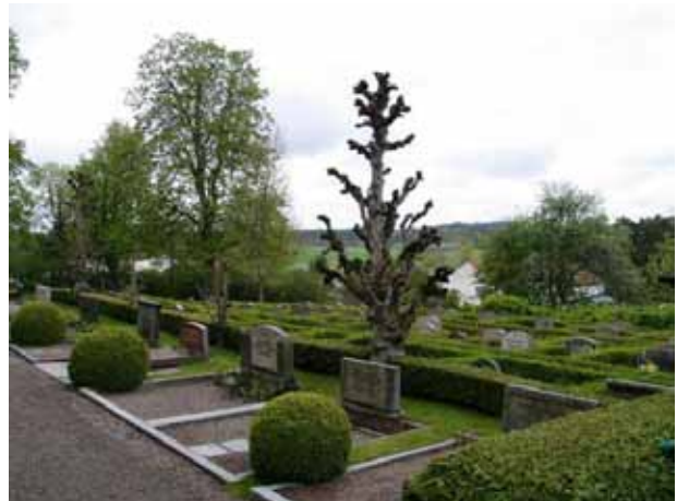
Kvarter I mot söder (KI Lofta 0022)