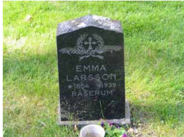
Kvarter V. En typisk linjegravsvård. (KI Lofta 0159)