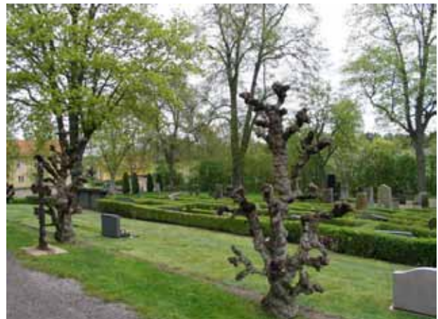
Kvarter VI mot nordost. Notera gjutjärnskorset till vänster. (KI Lofta 0113)