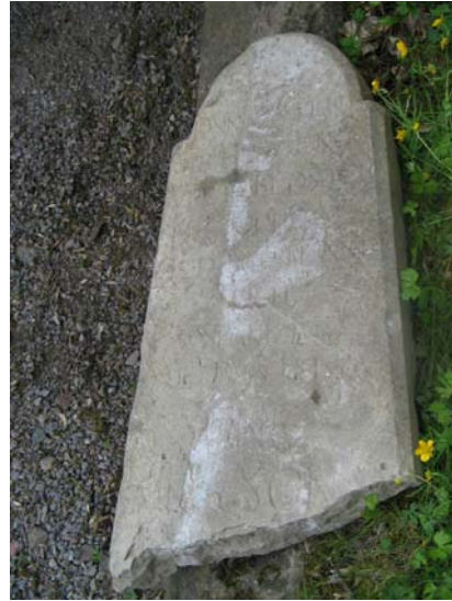
Övre hälften av den trasiga kalkstensvården som förvaras i bisättningskällaren.(KI Lofta 0217)