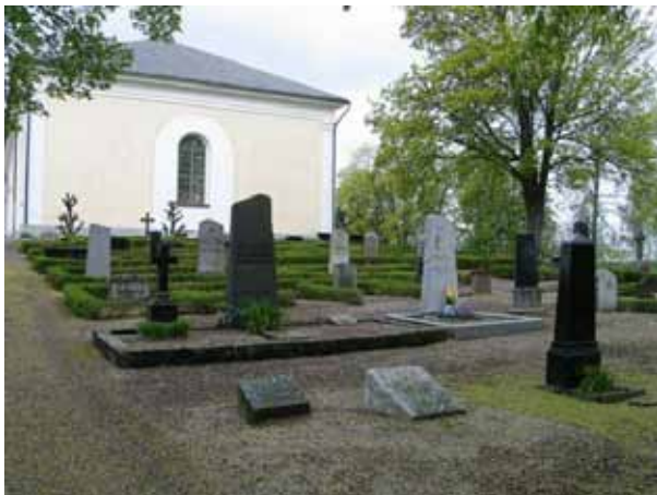
Kvarter VI mot öster. Koret i bakgrunden. (KI Lofta 0111)

Kvarteret omgärdas av kyrkogårdsmur och syrenhäck i öster. I söder och norr avgränsas kvarteret av gångsystem, varav det södra går till kyrkogårdens östra entré. I områdets östra del finns en lönn och en kastanj och längs gångarna i söder och norr, lönn, kastanj och lind. Längst gången i väster, längs kyrkans fasad finns fyra pyramidalmar.