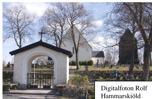
Digitalfoton Rolf Hammarskiöld