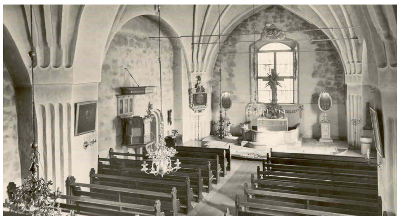
Kyrkorummets utseende mellan 1897 och 1956 – digital kopia av äldre vykort

Vid omläggning 1895 blev både klockstapelns och kyrkans yttertak täckta med svartmålad plåt, istället för tidigare spån. Radikalare förändringar följde 1897, då kyrkan fick sina nuvarande yttre fönster och det troligen medeltida vapenhuset revs för att få ett rymligare kyrkorum. Den branta sluttningen i väster omöjliggjorde öppnandet av en västportal, den annars gängse lösningen. Istället byggdes åter ett vapenhus på södra långsidan, men placerat längre västerut för att få mer bänkplatser inne i kyrkan. Vid den samtidiga omgestaltningen borttogs nästan all fast inredning från 1700-talet och 1800-talets första hälft. Valv och väggar avjämnades så att medeltida kalkmåleri säkert gick förlorat, i den mån sådant fanns kvar efter alla tidigare murverkslagningar. Tidigare putsytter torde ha varit grövre än den fina puts som nu slogs på. Som ofta vid det sena 1800-talets renoveringar blev de mer utsatta nedre väggfälten målade med en oljefärg, här i grågul nyans, medan de övre väggfälten åter kalkavfärgades. I kor och mittgång lades bruna och grå kalkstensplattor i diagonalmönster. Öppna bänkrader med snidade gavlar byggdes på fernissade brädgolv. Av tidigare fast inredning behölls bara predikstol och altarpupsats, den senare dock i en annan dager genom de glasmålningar som sattes in i bakomvarande fönster. Innanför altarringen lades en mycket tidstypisk linoleummatta med tryckt mönster.