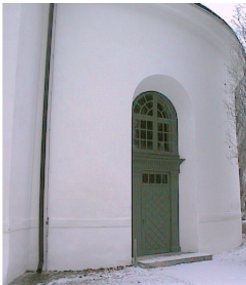
Sakristians ingång i sydost, tillkommen 1915-16

Hahrs omgestaltning innebar att sakristian revs. I den tidigare sakristidörrens ställe gjordes ett fönster, liksom på långhusets motstående sida där ingångsdörren borttogs. Ersättande sakristia inreddes i korets absid, som separerades med en tegelmurad vägg och fick en egen ingång i sydost. I det därmed förkortade kyrkorummet avdelades två sidoskepp genom att två längsgående innerväggar med rundbågiga arkader murades i tegel. Över mittskeppet och de två lägre sidoskeppen slogs plana trätak, infästa med järnstag i tunnvalvet som sedan dess ligger helt dolt ovanför. Bänkkvarteren ombyggdes, så att ingående bänkar blev bredare och bekvämare. Orgelläktaren från 1842 minskades i omfång. De tidigare pärlgrå inredningssnickerierna ommålades i bruna nyanser. Längst fram i långhuset höjdes golvnivån tre steg och där iordningställdes ett nytt kor, med ett återuppsatt medeltida altarskåp från Lilla Rytterne kyrka. Invid den näst främsta av mittskeppets pelare uppsattes en ny predikstol i empireinspirerad stil. Kyrkan fick centralvärmepanna, installerad i en nybyggd betongkällare under sakristian.