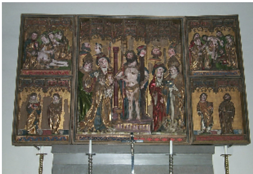
Kyrkans altarskåp från omkring 1500 hörde ursprungligen till Lilla Rytterne kyrka. I öppet tillstånd framställer skåpet Gregorii mässa i mittstycket och på flyglarna Kristi nedtagande från korset. Skåpet består till alla delar av ekträ och är sannolikt tillverkat i Lübeck, osäkert av vem (Henning von Heide och Bernt Notke har antagits, men beläggen är i båda fall knappa).