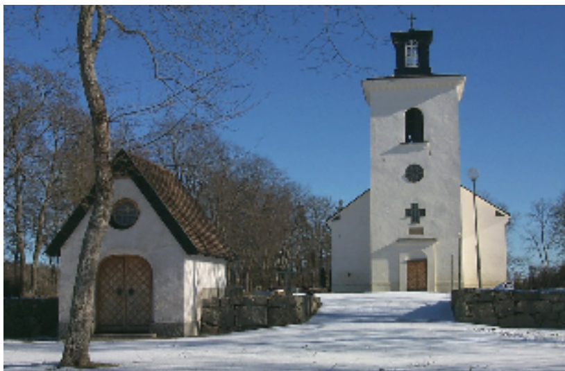
Rytterne kyrka med omgivande, terrasserad kyrkogård och bårhuset från 1950 i förgrunden

Rytterne kyrka ligger i ett herrgårdspräglad kulturlandskap i strandnära läge. En gammal landsväg slingrar i öst-västlig riktning genom området. Landskapet är klassat som riksintresse för kulturmiljövården, främst för den stora förekomsten av herrgårdar, fornlämningar och fornborg. Kyrkan med omgivande kyrkogård är anlagd på den så kallade Svånö backe cirka 800 meter öster om Svånö by och intill den gamla landsvägen från Västerås till Eskilstuna. På vägens motstående sida ligger församlingshemmet, inrymt i ett f d skolhus från 1848.