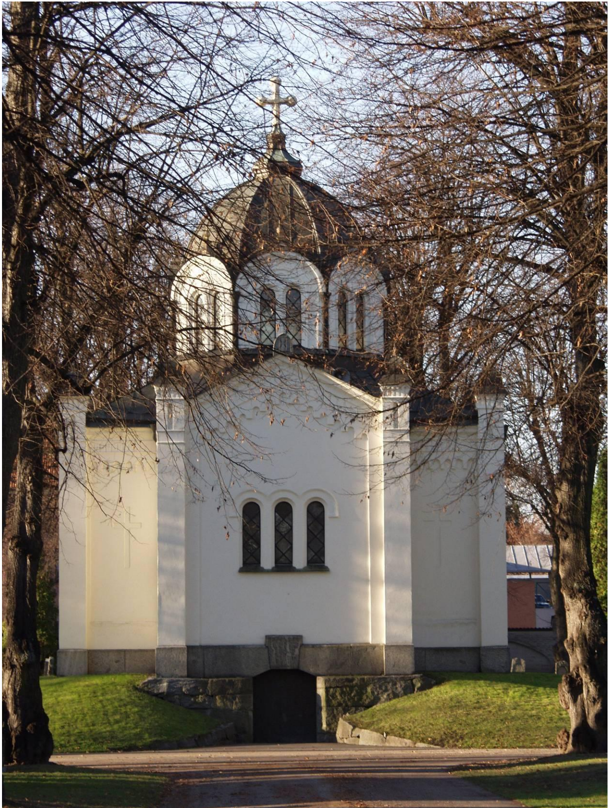
Östra begravningsplatsens kapell 2006-11-10