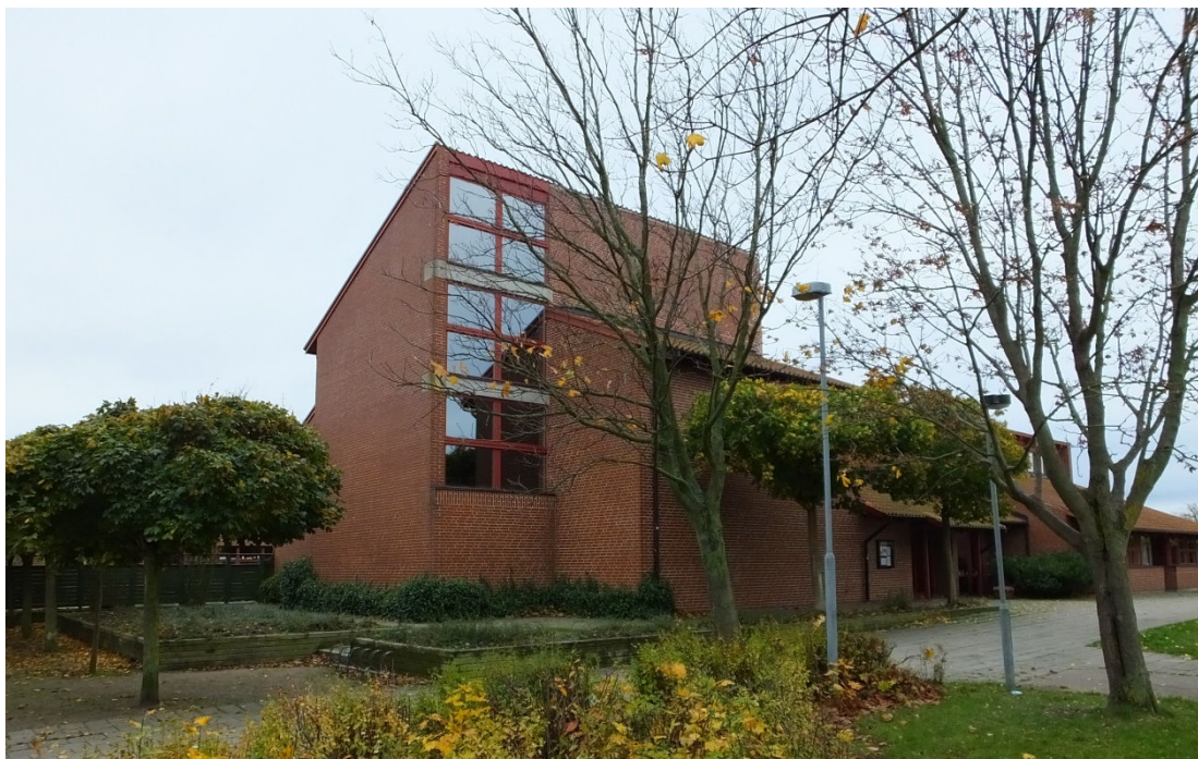
Kyrkan sedd från norra sidan. I nordöstra hörnet av kyrkorummet finns ett högt fönsterband avdelat av betongbalkar.

Kyrkan är den högsta av byggnadsdelarna i hela komplexet och ligger i dess östra sida med kordelen förlagd traditionellt i öster. Fönsteröppningar och ingångar ligger vända mot söder och norr medan murytorna mot väster är obrutna murpartier. En kampanil med kvadratisk planform, släta, obrutna murytor och pulpettak ligger söder om församlingsbyggnaderna. Tillbyggnaden från 1994 är förenad med entréhallen i den gamla delen genom en korridor som löper i syd-nordlig riktning. Den nya delens östra sida bildar tillsammans med korridoren och kyrkans södra sida en liten innergård som är avskärmad mot öster med ett plank.