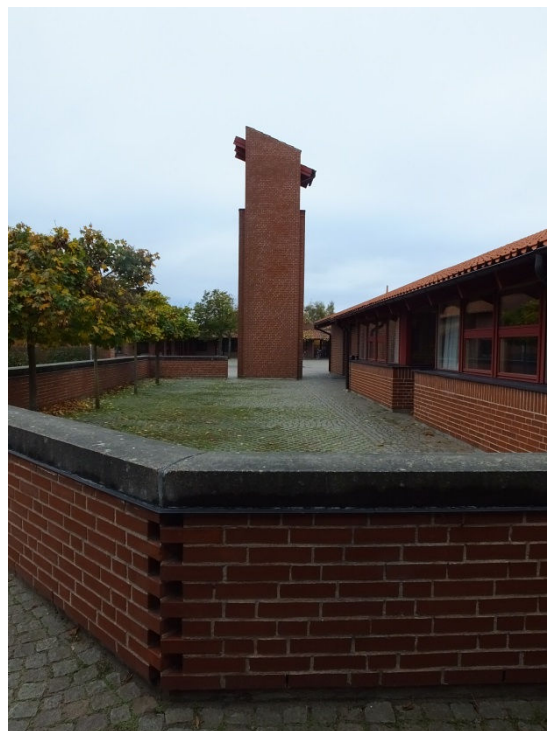
Till vänster syns kyrkan sett från nordväst och ingången till entréhallen. Bilden till höger visar uteplatsen vid församlingshemmets södra sida och kampanilen.

Huvudingång är från norr till en entréhall mellan kyrkorummet och lokalerna för församlingsverksamheten. En personalingång till församlingslokalerna finns från södra sidan, väl dold bakom kampanilen. Till soputrymmen, elcentral och förråd finns separata ingångar. Till sakristian finns en separat ingång från söder som numera endast nås via innergården mellan norra och södra längorna. I den glasade korridoren mellan den äldsta delen och den senare tillbyggnaden finns också en entré från kyrktorget, beläget mellan byggnadslängorna.