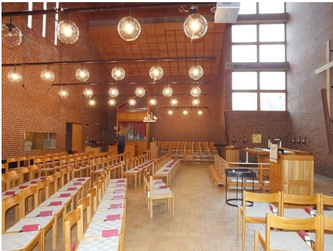
Kyrkorummet sett från söder. Koret är förlagt till höger med altaret versus populum. Vid norra sidan av kyrkorummet står orgeln, intill ingången från entréhallen.

man kan sitta ifred och lyssna på gudstjänsten utan att störa eller störas av andra. Ett brett och lågt fönster finns mot kyrkorummet och genom högtalaranläggningen når ljudet in i det ljudisolerade lyssnarummet.