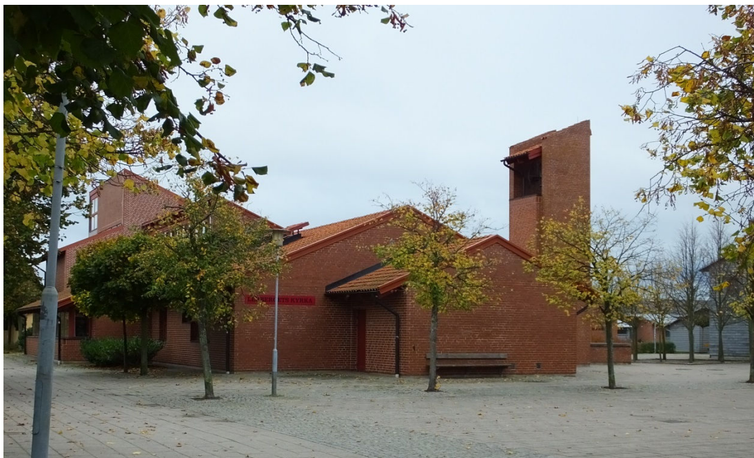
Kyrkan och församlingslokalerna sett från nordväst. Kampanilen är fristående från de övriga byggnaderna.

en utbyggnad av kyrkans lokaler. Både fler kontorsrum och större lokaler för ungdomsverksamheten behövdes. Under 1993 köptes tomten söder om kyrkan in och 1994 uppfördes en tillbyggnad på 270 kvadratmeter efter ritningar av Jais Nielsen.