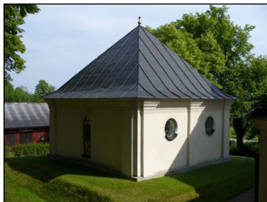
Gravkor från NV.