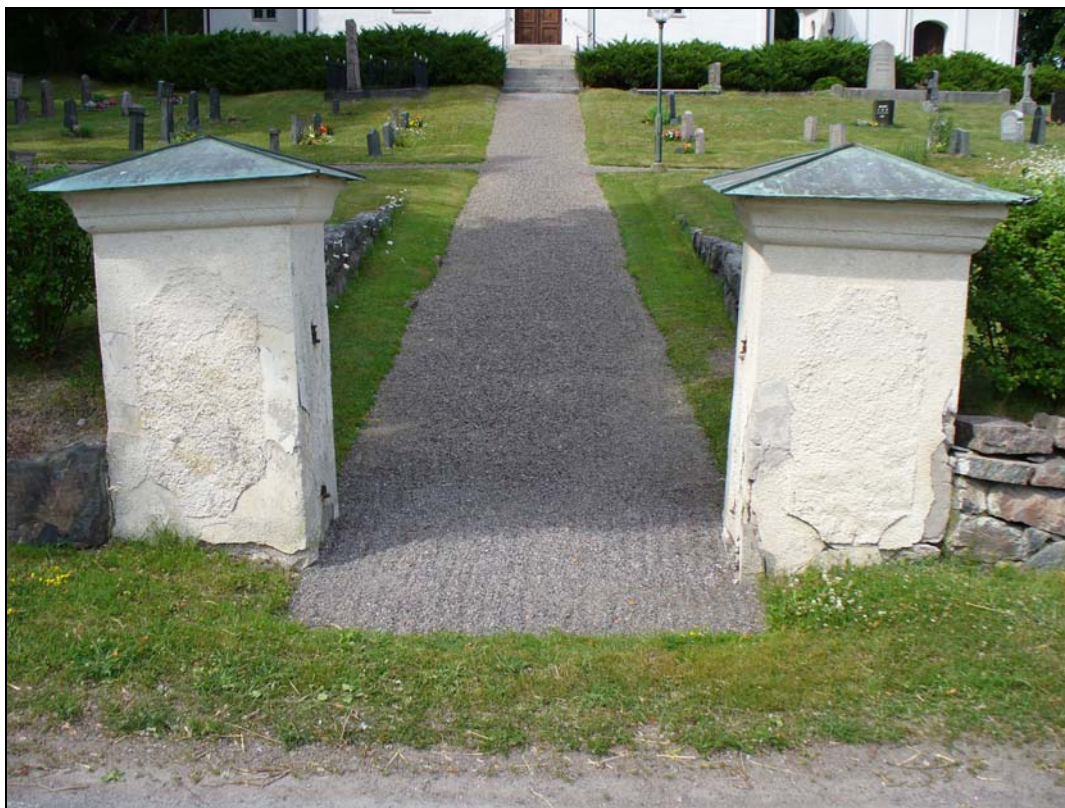
Grindstolpar i söder.