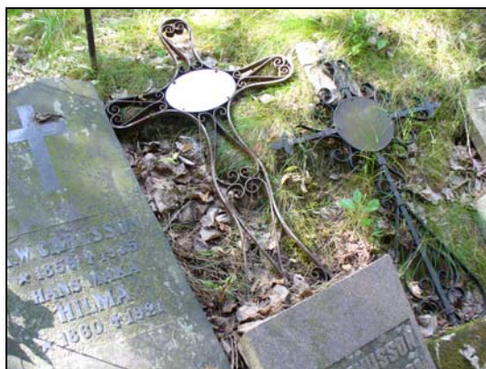
Undanställda gravvårdar i smidesjärn.