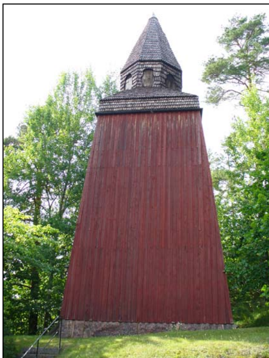
Klockstapel från Ö.

Öster om kyrkan ligger ett gravkor byggt 1752 för att hysa assessorn och brukspatronen Gustav Adolf Forss och hans maka Vendela Rosenhielm på Börrums gård. Gravkoret har sprutputsade fasader avfärgade i vitt, gråputsad sockel och en kraftigt profilerad taklist. Det höga tälttaket försågs 1992 med svart, falsad, galvaniserad plåt. Porten är en stickbågig, panelklädd dubbeldörr. Mot norr finns ett smalt, spetsbågigt fönster med järnspröjs och mot öster och väster runda fönster. Golvet i gravkoret består av ett betonggol, innertaket är ett plant trätak med synliga bjälkar.