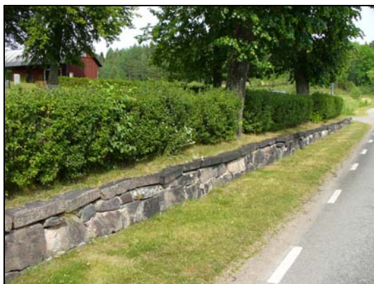
Del av södra kyrkogårdsmuren.

Söder ; stödmur, muren är bitvis fogad med cementhaltigt bruk. Muren har en höjd av ca 0,4 m. Muren består av obearbetade, råhuggna och kluvna stenblock.