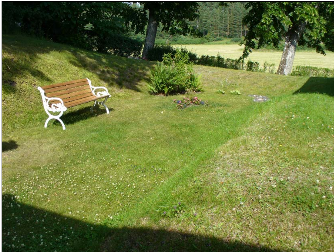
Minneslund från SVV.

Minneslunden ligger bakom gravkoret, den anlades under 1990-talet.