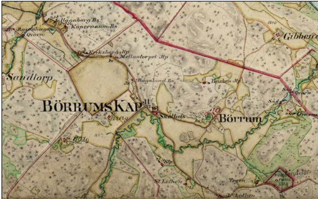
Utsnitt ur häradsekonomska kartan 1868-1877.