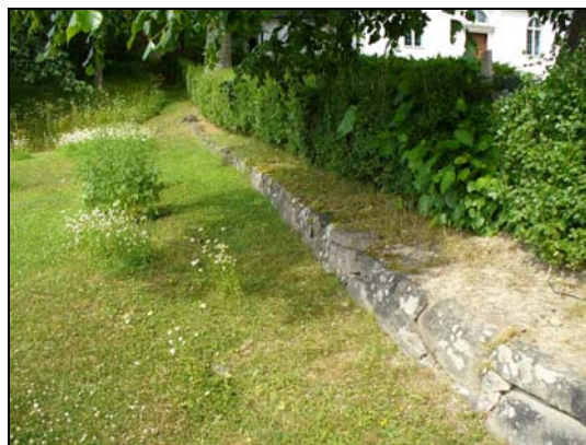
Del av västra kyrkogårdsmuren.