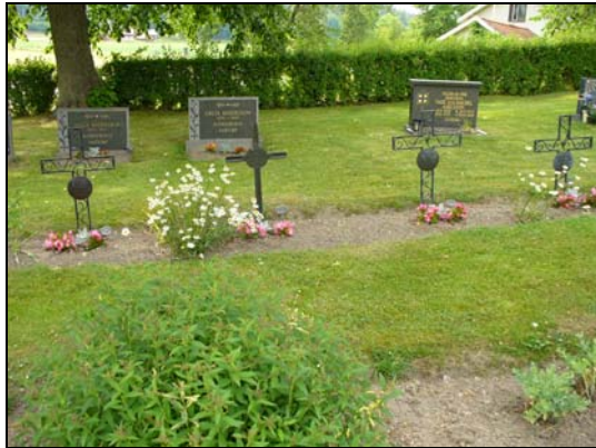
Gravkors i järn, område D.

belagda med grus. På kyrkogården finns också flera gravvårdar i form av kors. Materialet i dessa varierar från sten till trä, gjutjärn och smidesjärn. På kyrkogården finns även de något enklare gravvårdarna som ingått i den s k allmänna linjen. Man kan bitvis följa gravläggningarna från 1918 och några decennier framåt.