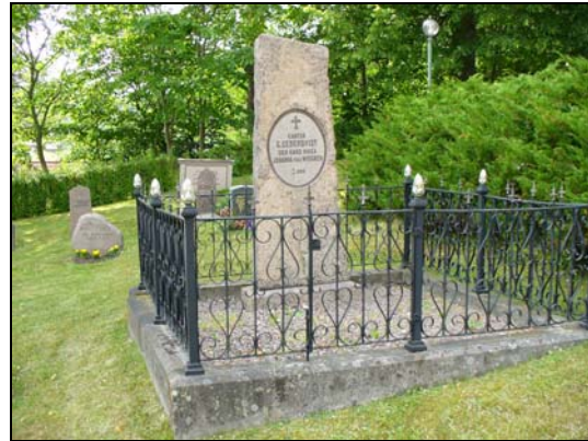
Gravvård omgärdad av smidesstaket i område B.