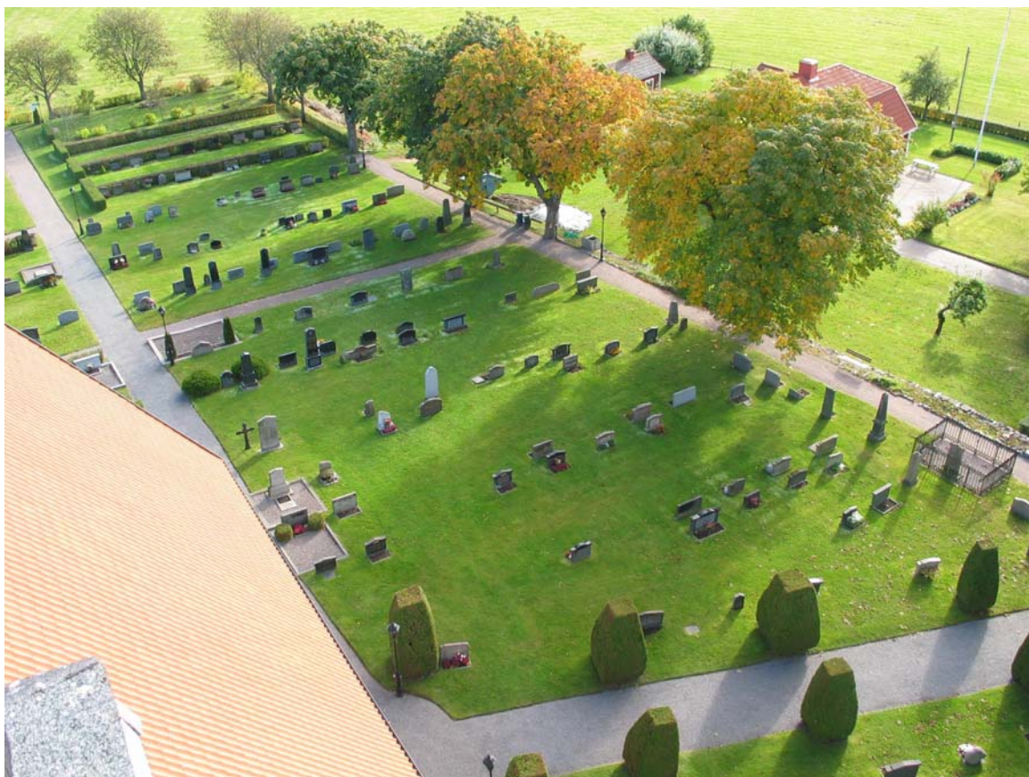
Kvarter F-L sedda från kyrkotornet.