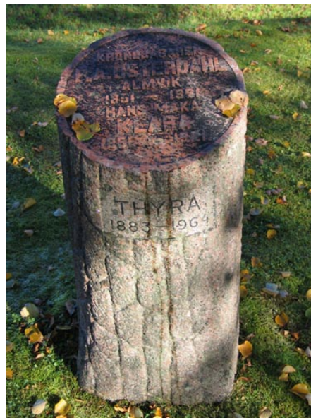
Familjegravvård med det symboliska motivet det avbrutna livsträdet. Från 1921, i kv E.