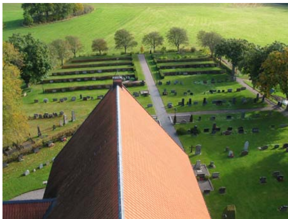
Kyrkogården mot öster sedd från tornet.