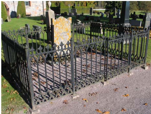
Gjutjärnsstaket i kvarter G.