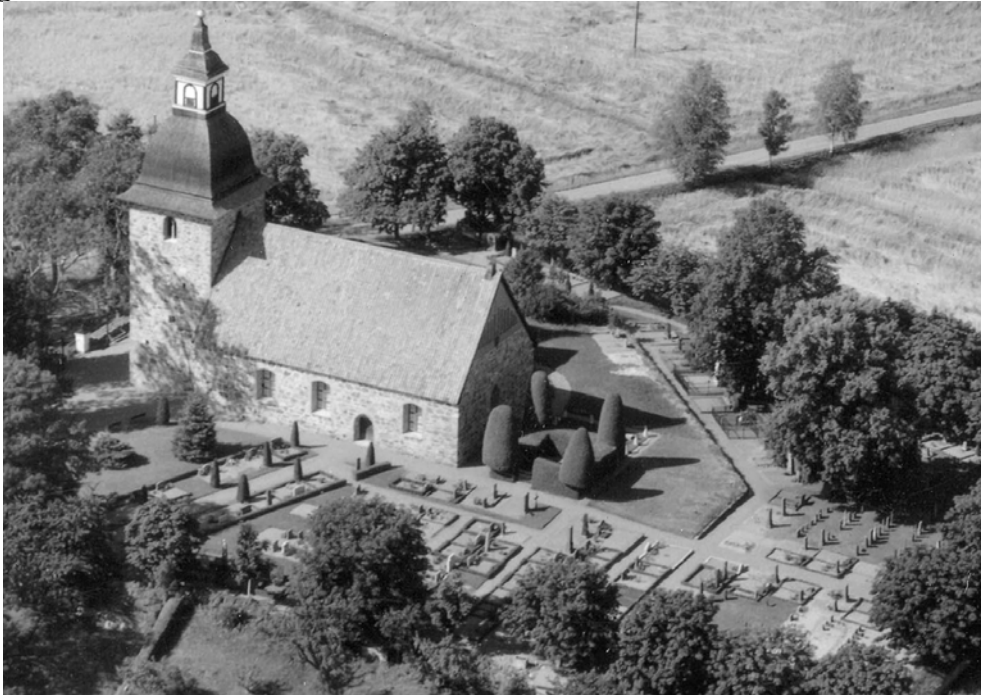
Flygbild från 1950.

Lika länge som det har funnits en kyrka på platsen lika länge har det förmodligen även funnits en kyrkogård. Gravarna har sannolikt som var brukligt funnits söder om kyrkan. Detta är ett drag som kyrkogården i stort sett behållit fram till idag. Endast få gravar finns på den norra sidan.