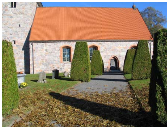
Gången med formklippta tujor fram till sydportalen.