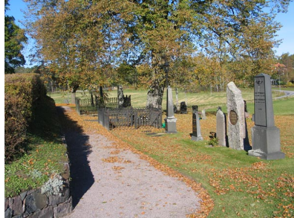
Kvarter B från söder.