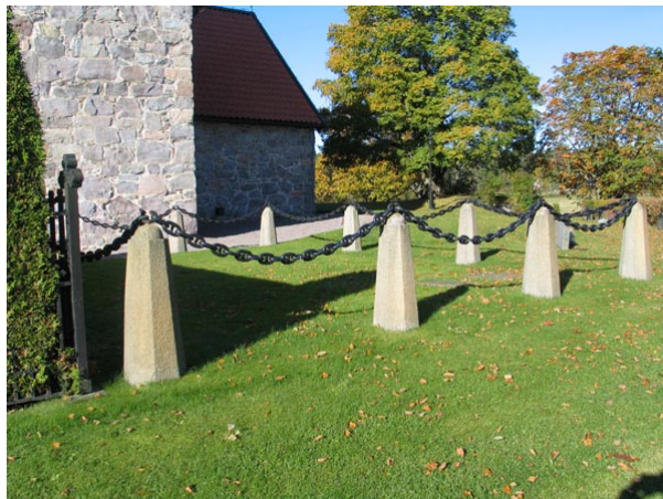
Kvarter AB, Nordenfalks familjegravplats.