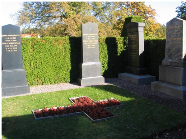
Kvarter AB, Nordenfalks familjegravplats.