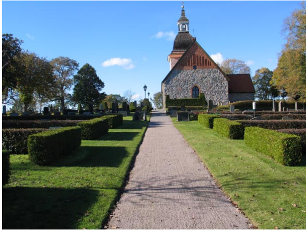
Kvarter M till vänster och N till höger.