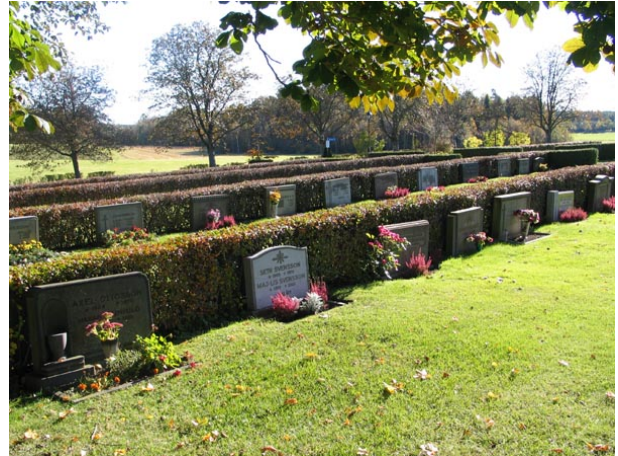
Inne i kv N, från N-V.