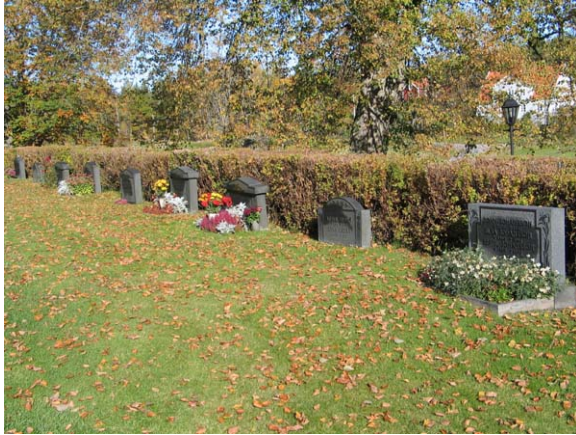
Kvarter A från söder.