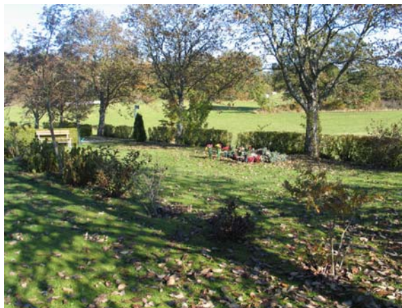
Minneslund från sydväst.