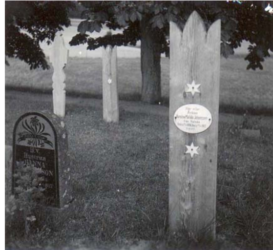
Trästavar i olika former med emaljskyltar.

Mer konkreta och detaljerade uppgifter om kyrkogårdens utseende i äldre tider får man först genom gamla fotografier. De tidigaste fotografierna är från 1906 och visar en i stora stycken annorlunda kyrkogård jämfört med dagens. På marken växer högt ängsgräs mellan gravkullar med företrädesvis trävårdar men även en och annan av gjutjärn. Av trävårdarna finns de som har formen av resta brädor, sk stavar, men även sådana som imiterar gjutjärnskors med trepassformer i ändarna. Många av de äldre vårdarna står trärena sedan färgen försvunnit men de nyare är målade i vitt. På kyrkogårdens södra sida står trävårdar både öster och väster om den sneda gången fram till sydporten. Runt Nordenfalks familjegrav öster om korväggen finns cypresser planterade, men de är ännu inte tuktade. Några årtionden längre in på 1900-talet har, på södra sidan om kyrkan, trävårdarna på den ostliga delen om gången börjat ersättas av höga stenvårdar.