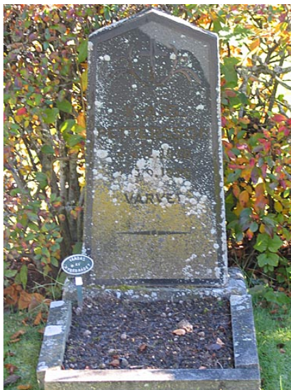
Trolig linjegravvård i kvarter D.

Kvarter D liknar i sin struktur de kvarter som anlades 1959, M och N. Det är därför troligt att området lades om ungefär vid den tiden. Förekomsten av äldre vårdar skvallrar dock om att kvarteret har en historia som är äldre än så. De små gravvårdarna av svart granit härrör av allt att döma från när kvarteret hyste linjegravar. De större köpegravarna utmed mittgången hör också till samma epok. Det är viktigt att de äldre vårdarna även i framtiden får stå kvar i kvarteret för att detta historiska lager inte ska falla i glömska. För kvarter