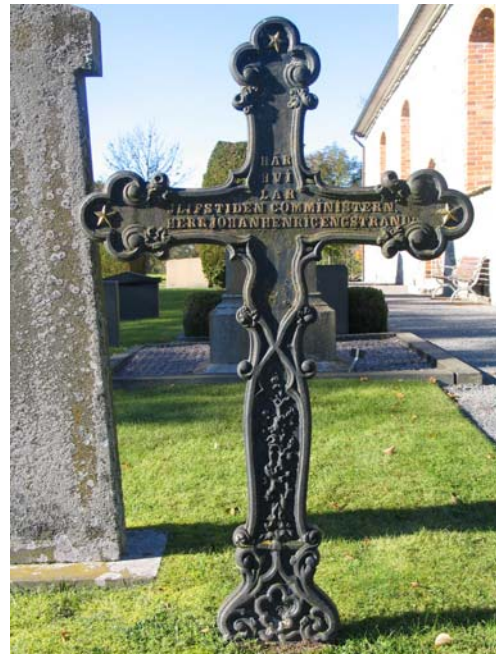
Gjutjärnskors i kvarter G.