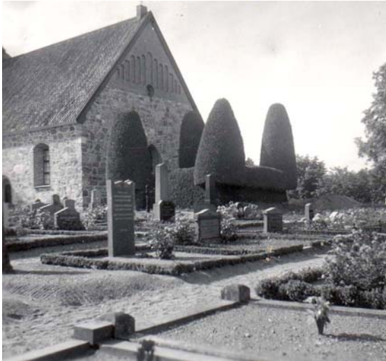
Sydöstra delen , från om ca 1940-talet.