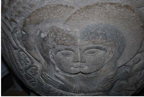
Detalj av figurframställning på dopfontens cuppa.