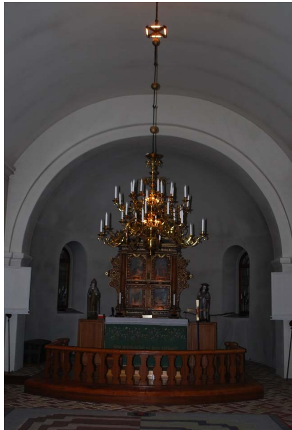
Absiden med altare och altaruppsats.