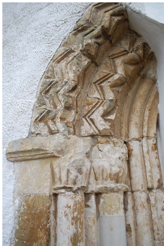
Detalj av sydportalen av fint huggen sandsten.