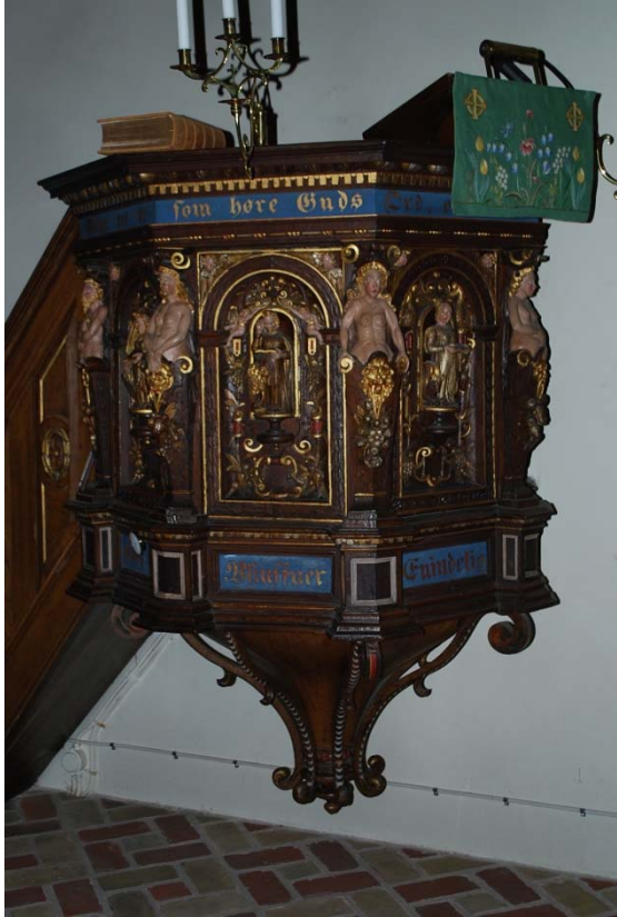
Predikstol från 1600-talet.