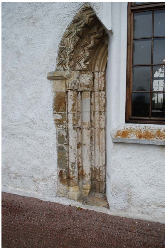
Rester från ursprunglig romansk sydportal.

klädd i ekpanel med fiskbensmönster och med ett halvcirkelformat överljus. Korsarmen har en entré mot öster. Omfattningen är tresprångig, de två yttersta är höga och rundbågiga, det inre är lågt och stickbågigt, liksom dörren. Tornets övre våningar har en ingång på norrsidan från en utvändig trappa med en rundbågig trädörr och omfattning. Samtliga dörrar är från 1951. På långhusets södersida finns rester av en medeltida portal som frilades och konserverades 1970. Portalen av fint huggen sandsten är rundbågig med arkivolt (inramning) i tre språng dekorerade med hugget sicksackmönster. Bågen bärs av två kolonner med veckade kapital. Portalen uppvisar en blandning av normandiska och anglosaxiska stildrag enligt Barbro Sundnér. Portalen har därtill vissa likheter med motiv i Lunds domkyrka. En romansk rundbågig fönsteröppning hittades också på långhusets södra sida och frilades. En behuggen sandsten från troligen sydportalen finns i en monter i vapenhuset. Långhuset, koret och korsarmen har sadeltak med röda enkupiga tegelpannor. Absiden och tornet har tak av kopparplåt i skivtäckning. Tornets spira är fyrsidig, något utvinklad nertill. Varje sida har en liten kupa krönt av ett prydnadstorn. Tornspiran avslutas med en kula och klöverbladskors. Takavvattningen är av vitmålad plåt.