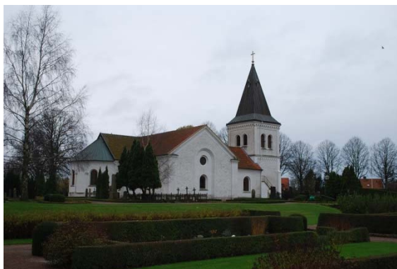
Kyrkan från den lägre utvidgade kyrkogården.

Den nya delen från 1940-talet ligger delvis lägre och en trappa förbinder delarna. På den nyare glesare delen finns flera gräsbevuxna delar utan utlagda gravar. Här finns en ny minneslund i gammal stil omringad av tuja i en triangel med en smal ingång. Inne i minneslundan står en bruten kolonn. Detta var en typ av gravsten som förekom vid sekelskiftet 18/1900-tal och symboliserade det avbrutna livet. I minneslundan finns även ett vattenspel och ett så kallat sorgeträd, ett träd med hängande grenar, även detta en sed som uppkom vid sekelskiftet 18/1900-tal. En urnlund med tätt liggande gravstenar finns i nordöstra hörnet. Den nyare delen har flera rygghäckar.