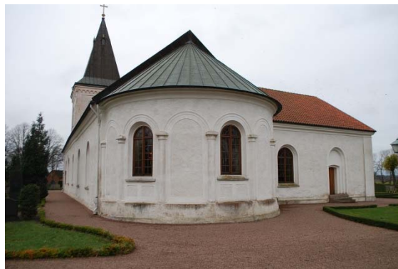
Apsid i öster och korsarm i norr från 1860.

Kyrkobyggnaden består idag av ett långhus, ett kor med samma bredd och höjd som långhuset och en absid i öster. I väster finns ett torn. Mot norr finns en korsarm byggd vid koret. De medeltida delarna är tre travéer i långhuset.