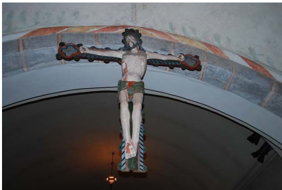
Triumfskrucifix från 1400-talet.