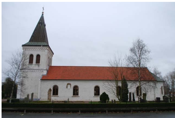
Kyrkan från söder.