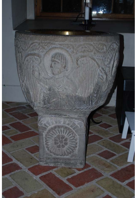
Dopfont från mitten av 1200-talet