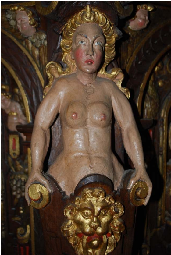
Detalj av predikstol.