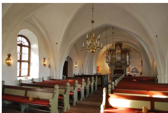
Långhuset mot väster.