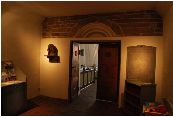
Vapenhuset med rester av den romanska sydportalen.