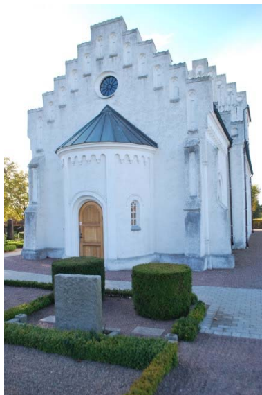
Rester av den romanska nordportalen. Kor och absid mot öster.