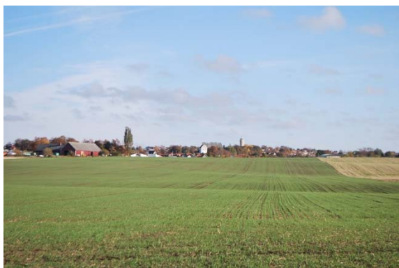
Kyrkan på avstånd från väster.

Parkering, väg och villaområde gränsar åt väster. Åt söder gränsar väg, villaområde och en äldre kringbyggd gård som numera är bl a bibliotek och förskola.