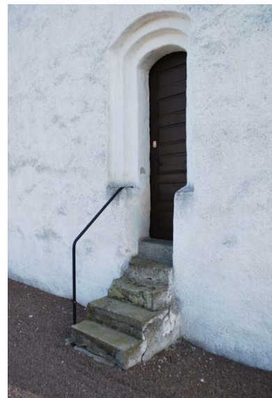
Ingång till tornet i väster.