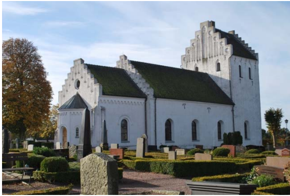
Fasad mot nordöst.