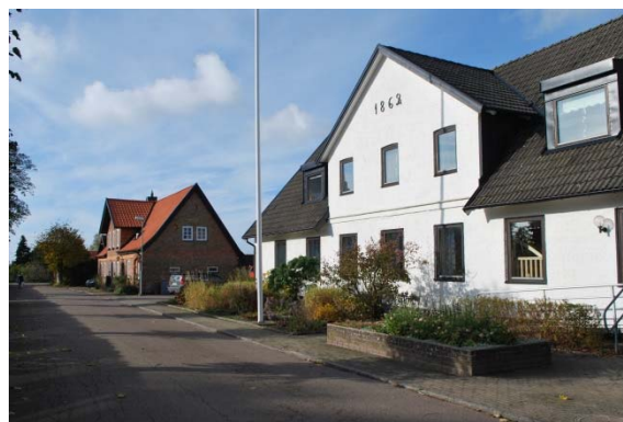
Gamla skolan, nu församlingshem norr om kyrkan.