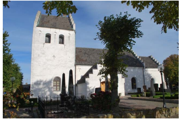
Fasad mot söder.

Fönstren sitter i rundbågiga slätputsade nischer. Fönstren i torn och långhus är stora, brunmålade, kopplade, småspröjsade träfönster. De delas med mittpost och tvärpost och i ovankant ett halvront fönster med radiell spröjsning. Solbänkarna är av gråmålad betong. Det finns även ett runt gjutjärnsfönster i koret och två små gjutjärnsfönster i absiden.