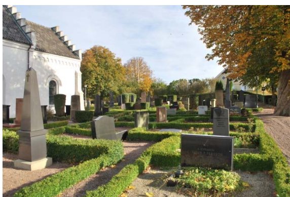
Gamla kyrkogården söder om kyrkan.

Ett bårhus finns i nordöstra delen av kyrkogården. Huset har vitputsade fasader och trappstegsgavlar. Tak och tinnar är belagda med röda tegelpannor.