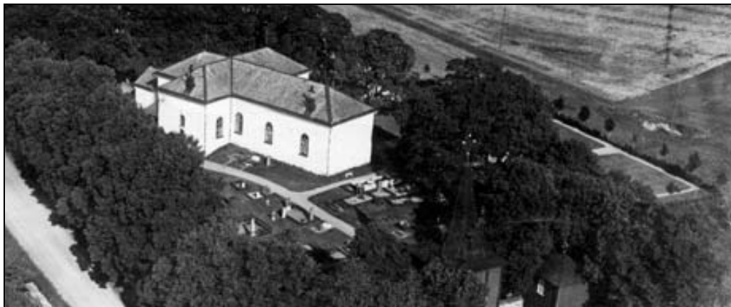
Flygfoto från 1935. Bilden är beskuren.

1882 hittades en murad grav på den plats där klockstapeln tidigare stod strax öster om koret. På fem kvarters djup (ca 75 cm) hittades en kista av murade täljstensskivor.