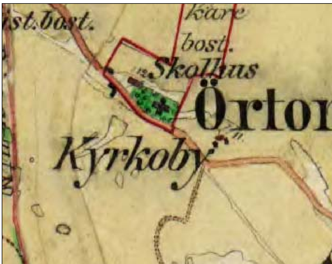
Utsnitt ut häradsekonomska kartan 1868-77, Ekenäs.