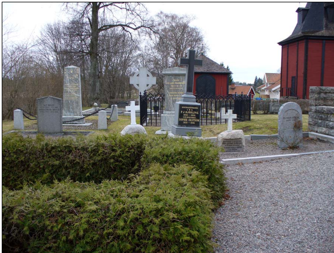
Kvarter D från väster.

Kvarteret domineras av omgärdade grusgravar över högreståndspersoner.