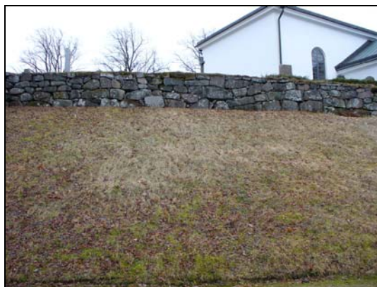
Kyrkogårdsmuren i norr.