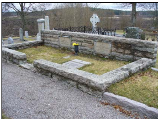
Kvarter D, Koskull.

Kvarteret domineras av gravvårdar över högreståndspersoner. Vid kyrkans östra gavel står en gravvård i form av en kolonn på ett fundament och gravvården kröns av en urna. Söder om kyrkan finns två stora liggare och en tidstypisk kalkstensvård från 1830-talet. Övriga gravplatser karaktäriseras av grusbelagda gravar med stenram eller gjutjärnsstaket.