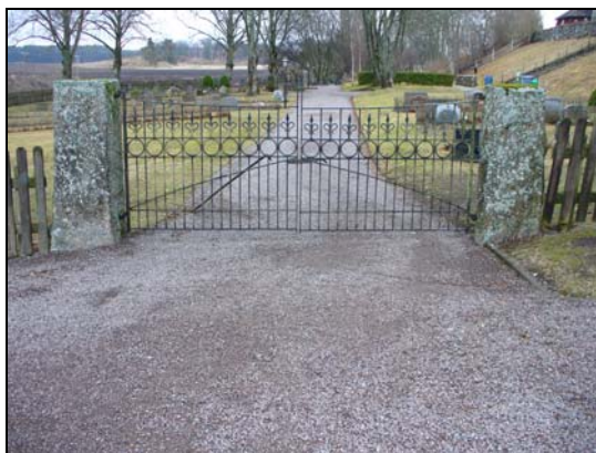
Dubbelgrind i järnsmede i väster.