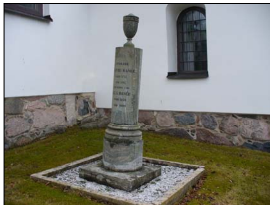
Kvarter K, nr 4.