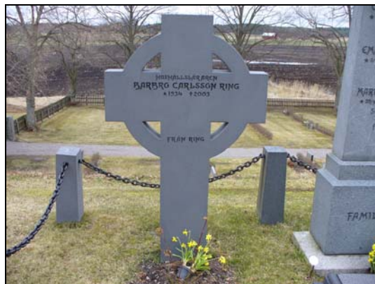
Gravvård i form av ett kors, rest 2003.