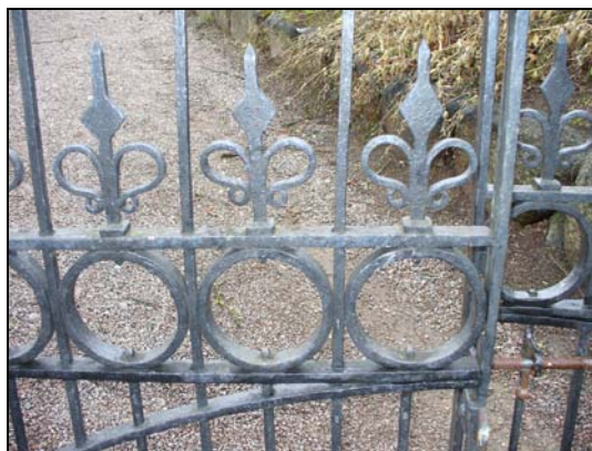
Södra grinden, tillverkad 1840 av smeden Ölander.