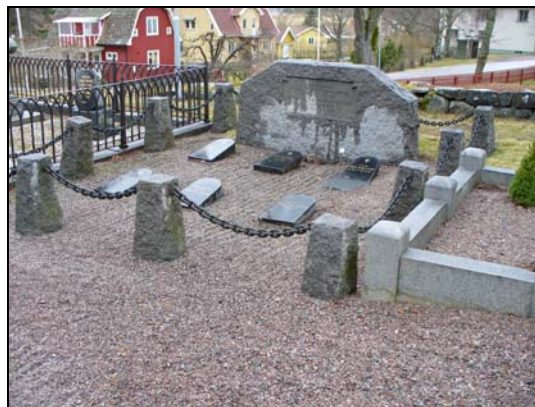
Gravvårdar med olika typer av omgärdning i kvarter A.