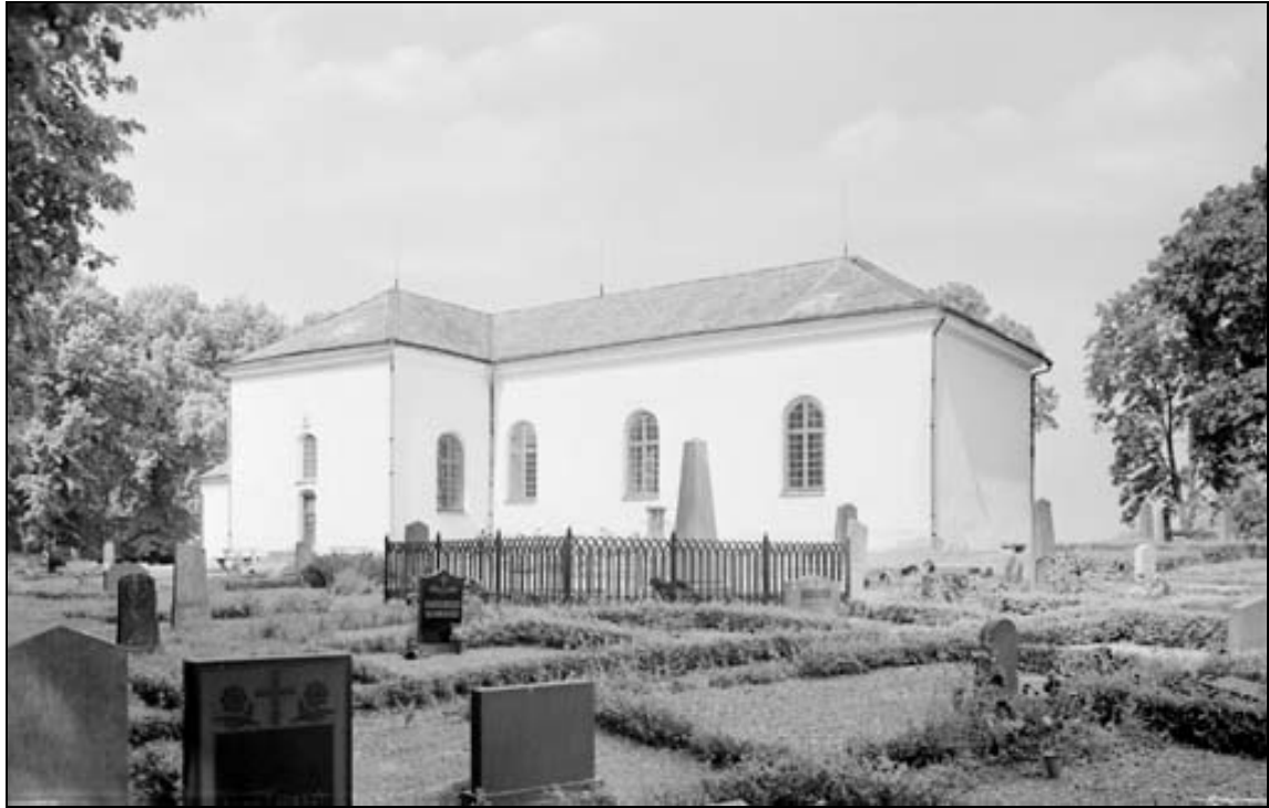
Foto från 1944 visar kyrkogården från sydö.