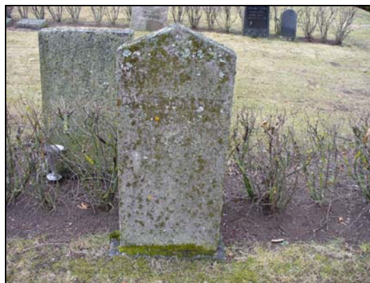
Inom kvarter B finns det flera gravvårdar som är kraftigt mossbevuxna.