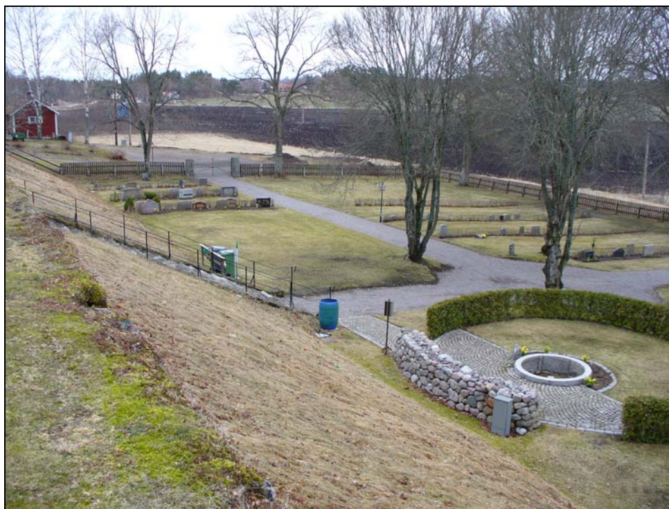
Utvidgningen av Örtomta kyrkogård.