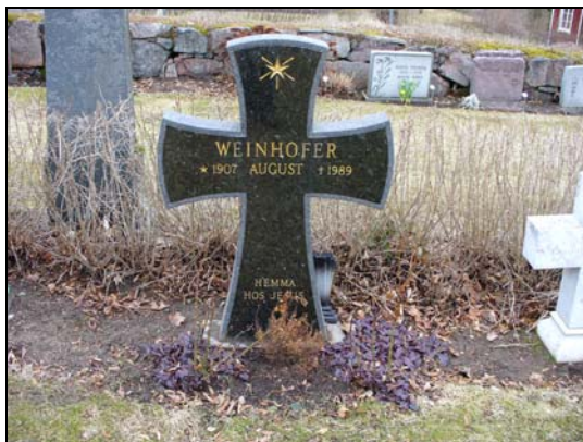
Gravvård i form av ett kors, rest 1989.