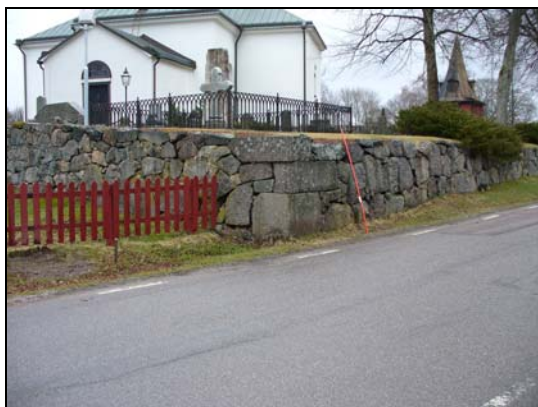
Kyrkogårdsmuren i sydväst.