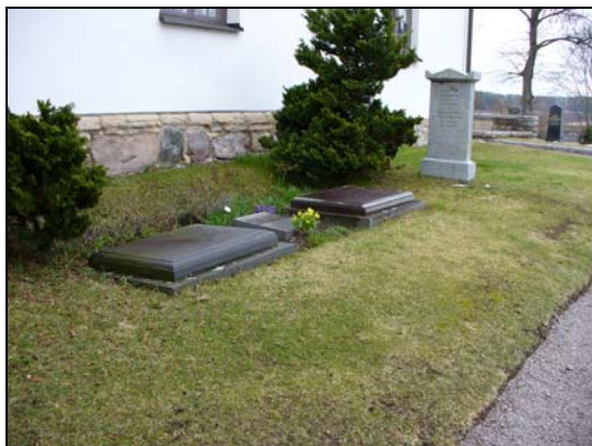
Kvarter K, nr 1-3.