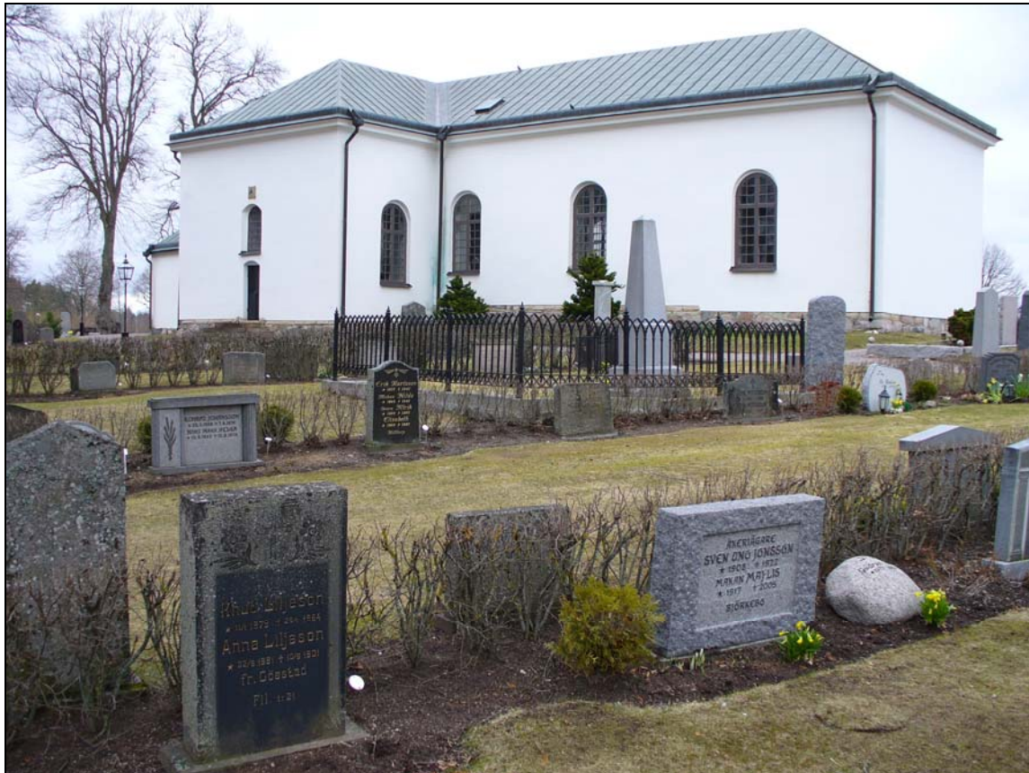
Foto från 2006 visar kyrkogården från sydöst.