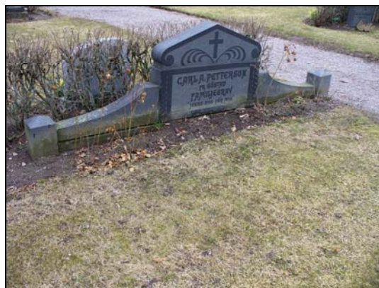
Gravvård vars stenram är borttagen.