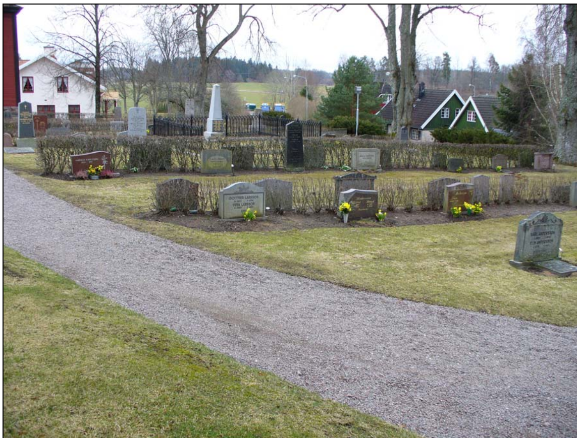
Kvarter B från väster.