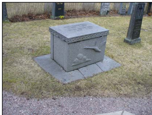
Gravvård i form av en sarkofag.