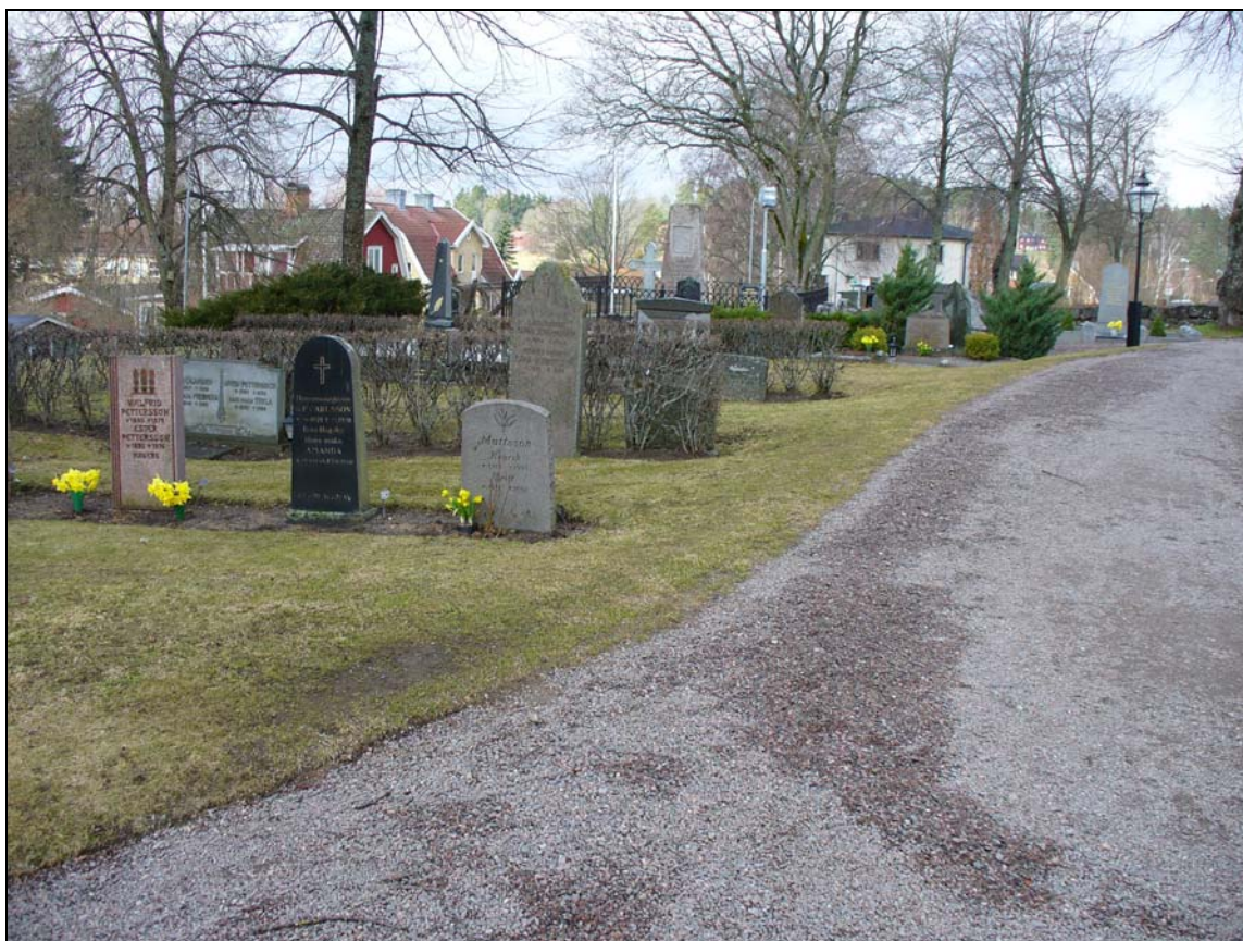
Kvarter A från öster.

Kvarteret domineras i väster av de stora gravplatserna för familjerna Banér och Klingspor. Här finns även många andra omgärdade grusbelagda gravar. I kvarterets östra del växer två rygghäckar i nordsydlig riktning, i öster är också gravvårdarna av lite enklare karaktär.