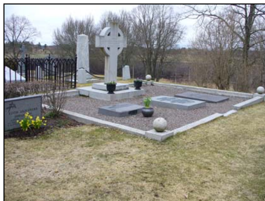
Kvarter D, de la Gardie