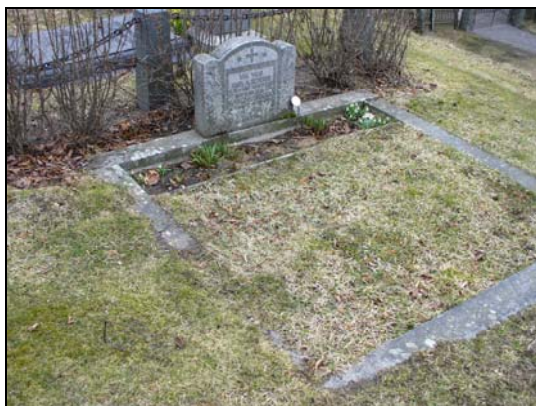
Gravvård omgärdad av en stenram.

Inom kvarteret finns flera olika typer gravvårdar från 1800-talets slut fram till 2000-talet. Kvarteret karaktäriseras av den mängd olika gravvårdar som finns. Flera olika typer av kors varav några är uppförda under de två senaste decennierna. I kvarterets södra del finns en gravvård i form av en sarkofag. Det finns även flera gravvårdar av svart granit. Området har även gravvårdar med stenomgärdning, här är de dock inte grusbelagda utan beväxta med gräs.