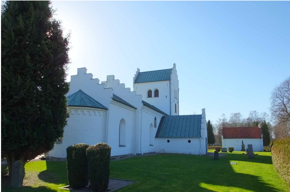
Kyrkan sedd från nordost. Norra vapenhuset utgör gravkor.

och tornet förhöjdes samt byggdes om med en högre mittvåning med gavlar åt öster och väster samt lägre gavelpartier mot söder och norr. Samtliga gavlar på kyrkan gjordes om till trappgavlar. Invändigt vidgades tornbågen.