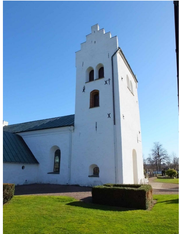
Kyrkans absid och västtorn.

var till en början via en numera igensatt öppning ca 2,8 m upp på tornets norra sida. Den högt belägna dörröppningen nåddes från en utvändig trätrappa eller ett murat trapphus. Tornets bottenvåning var tidigare valvslagen men någon datering av tornvalvet finns inte.