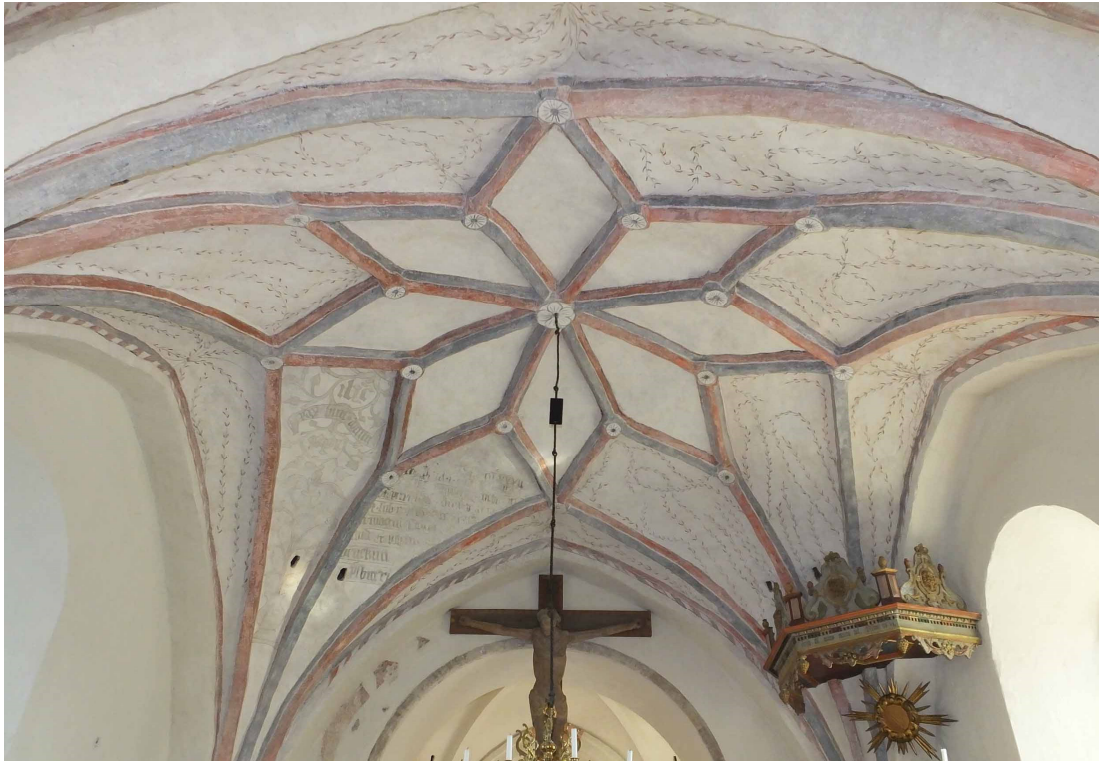
Stjärnvalv i långhusets östra valvtravé sett mot triumfbågen.

kalkmålningar föreställande ytterstadomen vilken grovt dateras till efterreformatorisk tid 1500-1600-tal. Under den romanska fönsteröppningen mot öster finns en muröppning täckt med en lucka, en piscina där nattvardsvinet kunde hållas ut i vigd jord. I norra och södra mursidorna intill tribunbågen finns ett par sakramentsnischer.