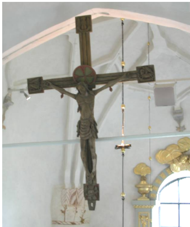
Interiörbilder - Digitalfotografier Svensk Klimatstyrning AB

Kyrkorummets medeltida ursprung framgår bäst av de två stjärnvalven, det bakre av Vadstenatyp och det främre ett Sturevalv. Valvpelarna är halvrunda, en ovanlig form i sammanhanget. Rester av medeltida målningsdekorationer finns på triumfbågens undersida och runt dörren mot sakristian. På södra sidan finns igensatta spetsbågiga fönster markerade i murverket. I övrigt har valv och väggar vitkalkats och sedan laverats i en lätt grågul nyans. Ett stort medeltida krucifix av trä hänger i triumfbågen.