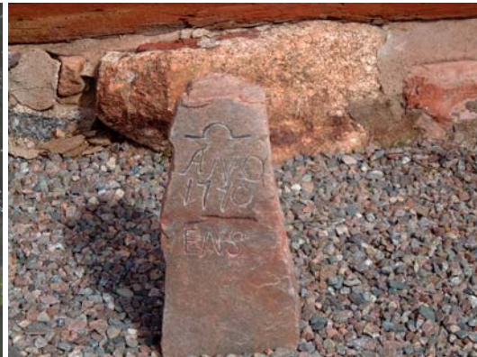
"Gravmarkering", i dag vid kyrkan.