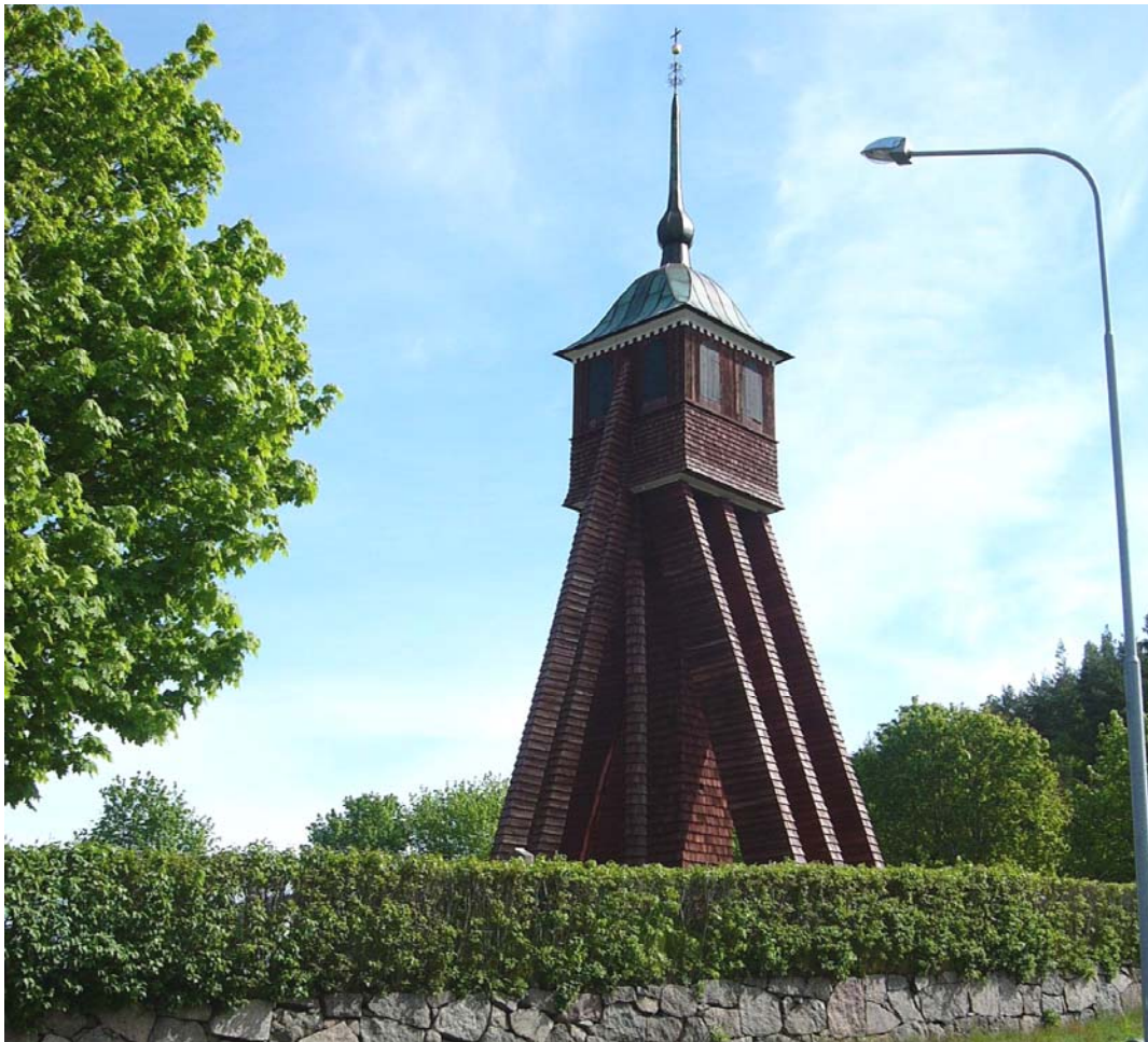
Klockstapeln från sydväst.