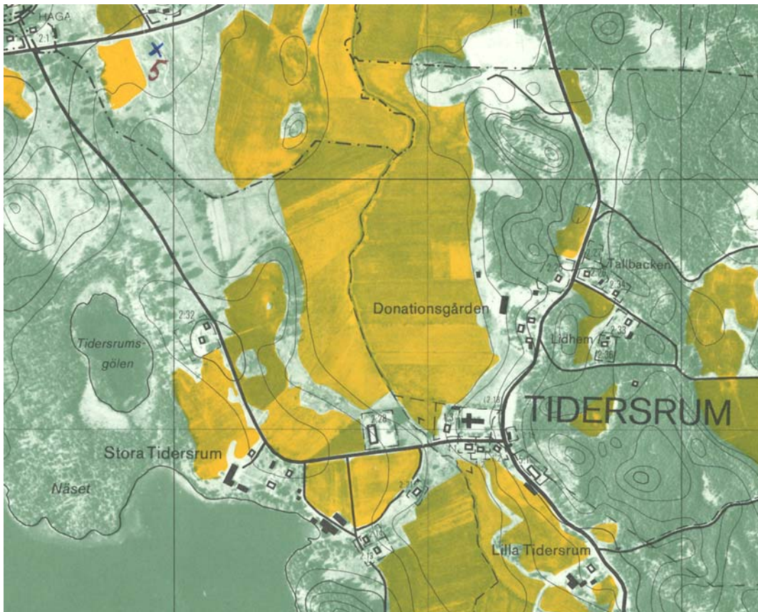
Utsnitt ur ekonomiska kartans blad 075 46 Tidersrum, 1981.