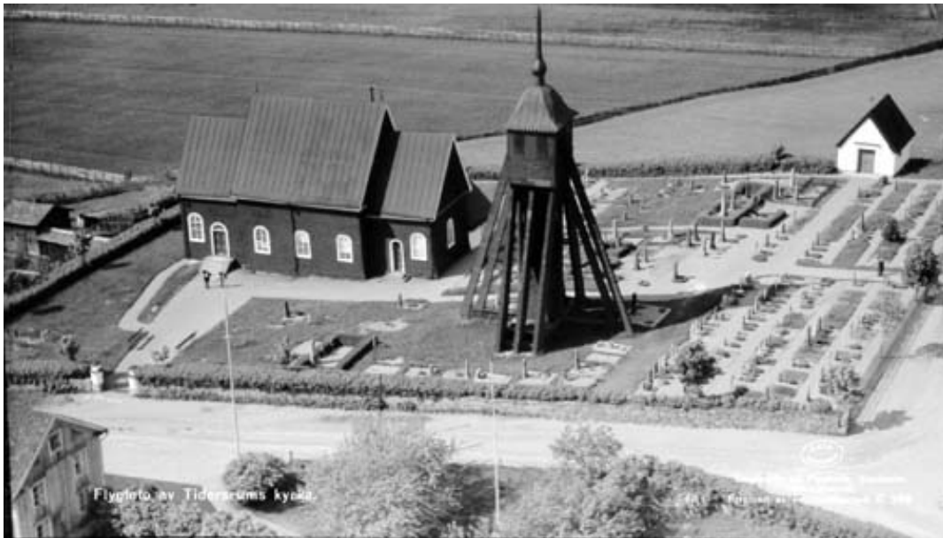
Flygfotot från 1935 visar hur kyrkogården grusas vartefter gravplatser tas i bruk.