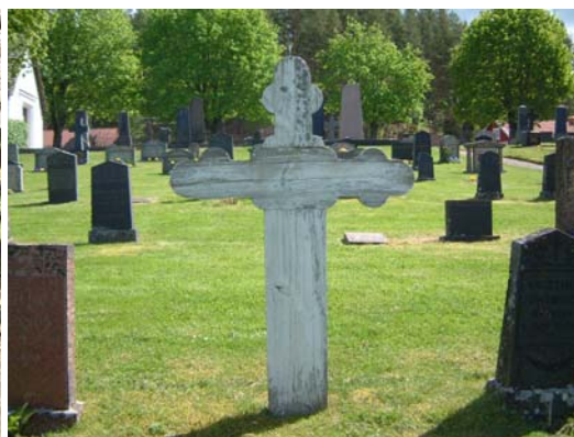
Vitt träkors på allmänna linjen.