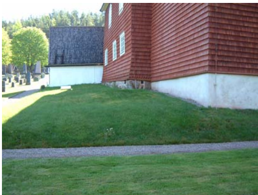
Området närmast norr om kyrkan.