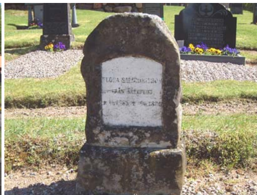
Gravvård i kalksten från 1885.