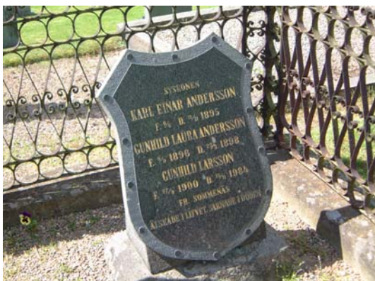
Sköldformad gravvård och järnstaket.