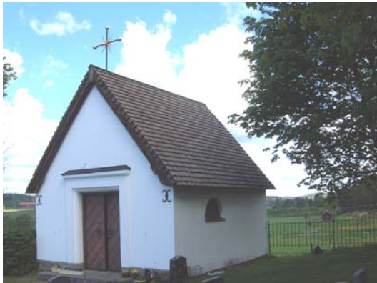
Gravkapellet från sydväst.