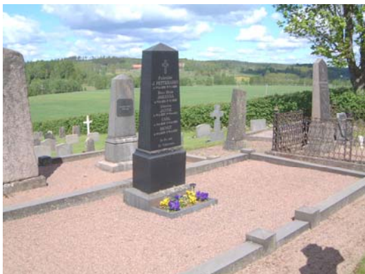
Östra delen av området från sydöst.

Sluttande öppen gräsyta med enkla gravar. I östra delen av området grusgravar och ett praktfullare intryck.