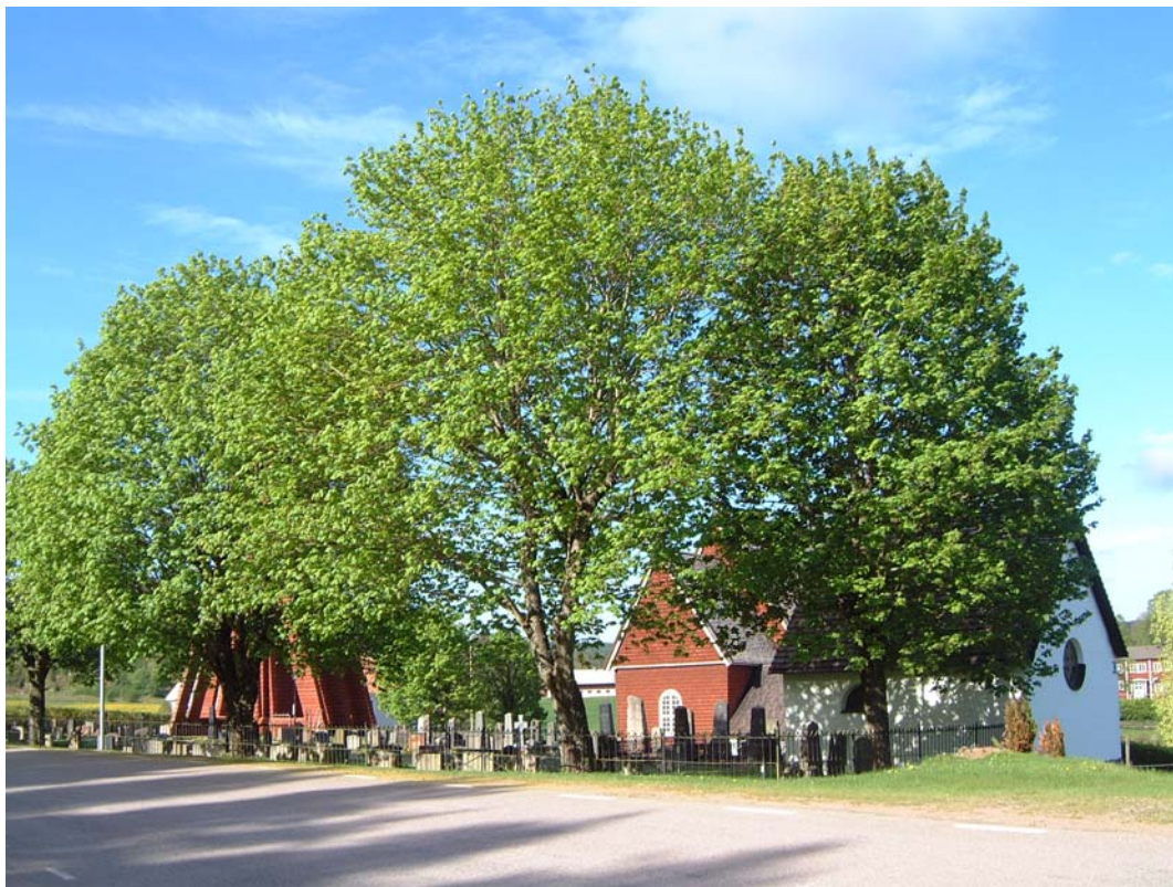
Tidarsrums kyrkogård från nordöst.

Några lönnar växer i öster men i övrigt har kyrkogården en mycket öppen karaktär och domineras av kyrkan och den höga, rödfärgade klockstapeln. Raderna med gravläggningar ligger i nord/sydlig riktning på hela kyrkogården.