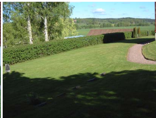
Området väster om kyrkan.