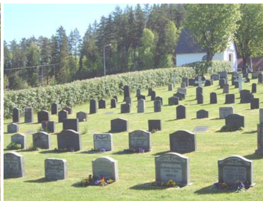
Linjegravar norr om kyrkan från sydväst.