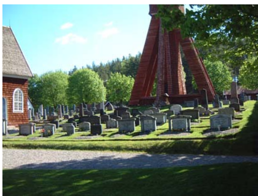
Gravplats 1-131 från sydväst.

Området omfattar gravplats nr 1-131 samt 233-351 och ligger söder, sydöst och öster om kyrkan. Det är fyrkantigt med en vinkling åt väster. Inom området, sydöst om kyrkan, står klockstapeln.