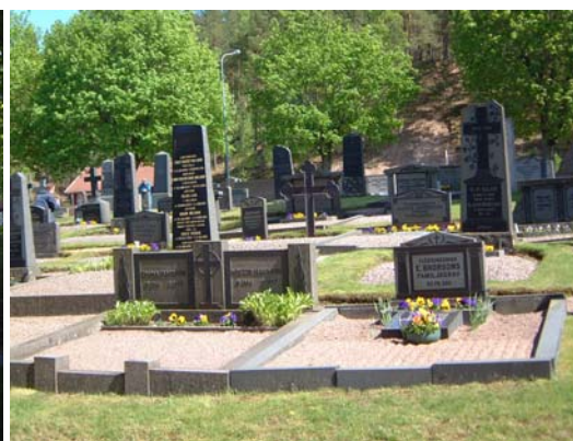
Gravplats 233-351 från väster.