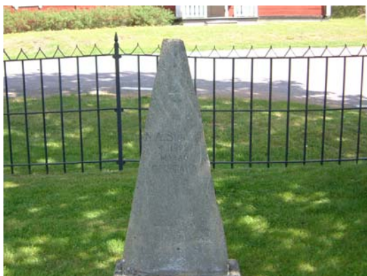
Gravvård med lokal tradition.

I huvudsak låga och breda vårdar. Det förekommer gravläggningar från 1910-talet fram till och med 2001, men flertalet gravar härrör från 1970-tal - 1990-tal. De flesta gravarna har små stenramar kring blomplanteringarna. Enstaka gravar är av linjegravskaraktär. Vårdarna är i huvudsak av gråvit, grå, svart och röd granit. Bland enskilda gravvårdar kan nämnas ett s k avbrutet livsträd i form av en stubbe samt en gravvård som enligt uppgift är rest över en av de fyra män som lade om kyrkogårdsmuren.