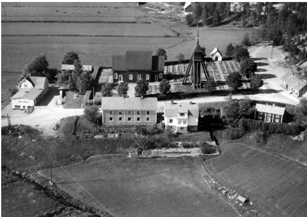
Flygfotot från 1961 visar att en större del av kyrkogården tagits i anspråk för grusgravar.

På kyrkogården söder om kyrkan står en vackert utförd klockstapel vars byggnadsår enligt uppgift från Nils Månsson Mandelgren är 1711. Mandelgren besökte kyrkan 1847. Runt hela kyrkogården fanns i äldre tider en stockmur av vilken i dag inget finns bevarat. Från en avfotograferad teckning av kyrkan i Säves reseberättelse från 1861 kan man se att kyrkogården omgärdas i öster av en gärdesgård av trä. På samma teckning