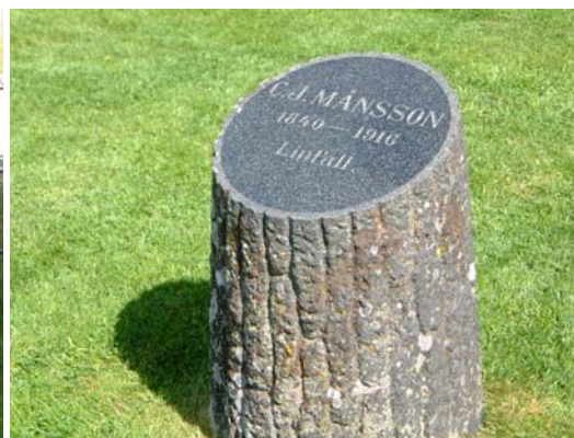
Ett s k avbrutet livsträd.