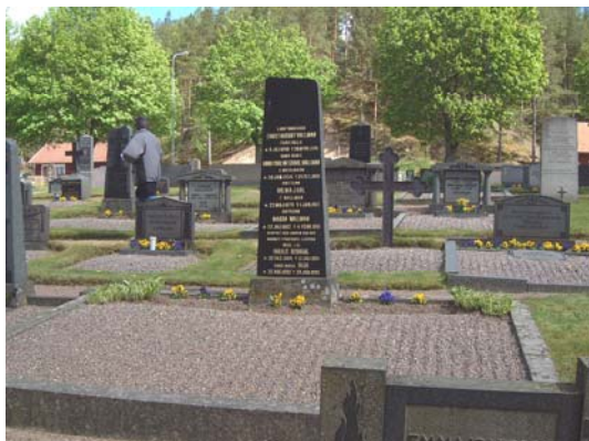
Gravvård med tidigaste årtal 1909..

I allmänhet är gravvårdarna sentida, låga och breda eller höga, ofta av svart, polerad granit. Gravläggningarna är huvudsakligen från 1860-tal – 1990-tal. Gravar omgärdade med stenram.