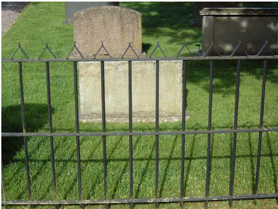
Del av kyrkogårdens östra del med järnstaketet i förgrunden.

Kyrkogårdens östra del är omlagd till gräsyta, vilket ger den en öppen karaktär. Här är det mestadels enkla, sentida gravvårdar. En del äldre vårdar tyder på begravningar i "allmänna linjen". Enligt uppgift stod stenarna tidigare med texten vänd mot vägen och de var grusgravar. Eventuellt lades denna del av kyrkogården om på 1970-talet.