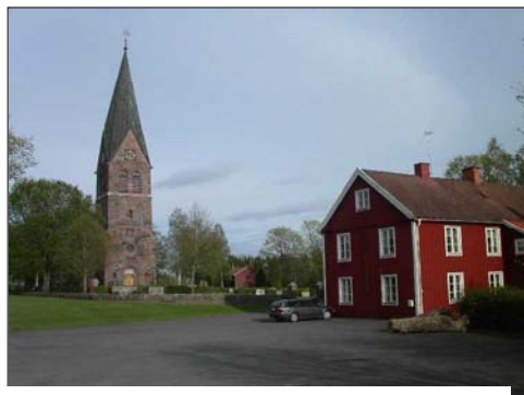
Lommaryds kyrka med församlingshemmet

Lommaryds socken är belägen mitt i Norra Vedbo härad, och utgör den till ytan största socknen i Bredestads pastorat. Landskapet präglas av småbergiga skogsmarker med inslag av bördig åkermark, där höjder och dalar tätt avlöser varandra. I öster gränsar socknen till Svartån och sjön Ralången och i denna låglänta terräng ligger också den bördigaste marken. Kyrkbyn ligger i socknens mitt och genom byn går landsvägen mellan kommunens huvudort Aneby och den före detta tingsorten Hullaryd. Söder om Lommaryd ligger vid Vittaryd ett gravfält från järnåldern med domarringar, men ett flertal fynd från vitt skilda ställen i socknen visar också upp grav- och boplatser från sten- och bronsålder. 200 meter söder om Lommaryds kyrka ligger ett gravfält med två högar och sju stensättningar. Väster om kyrkan och kyrkogården ligger i axel med kyrkans mittlinje församlingshemmet, uppfört 1824, som tidigare tjänat som sockenstuga och skola. Här finns också parkeringsplatser. Norr om kyrkan går landsvägen mellan Hullaryd och Aneby och längs denna väg finns också på andra sidan den nuvarande skolan. Öster om finns åker och söder om ligger en åker- och ängsmark som skiljs åt från kyrkogården av en djup utdikning.