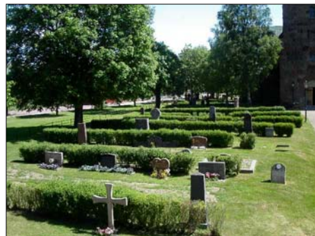
Kvarter A mot nordöst

Gravlinjerna är planterade med rygghäckar i nord-sydlig orientering av måbär, vilka ger kvarteret dess struktur. Mot väster och norr omgärdas kvarteret av kyrkogårdens stenvmur och i öster och söder avgränsas kyrkogårdens grusgångar. På grund av markens sluttning ligger kvarteret högre än kvarter B på andra sidan mittgången.