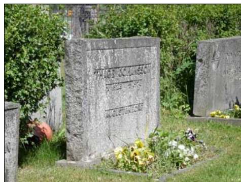
Låg och bred, grå granit, 1970-talet. Namn, årtal och ortstillhörighet, avsaknad av titel.