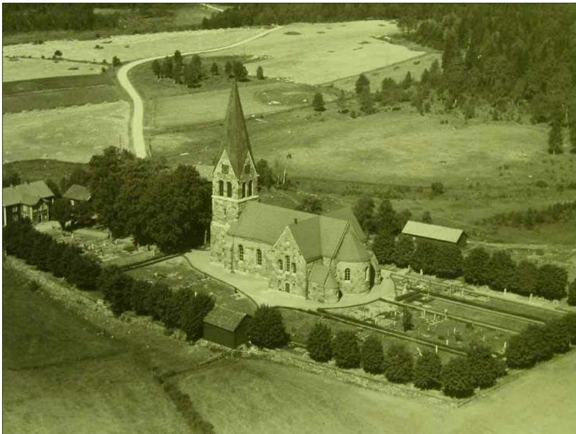
Lommaryds kyrka och kyrkogård, fotograferad 1935. Östra kvarteret är indelat i tre delar med grusgångar emellan, och en grusgång på tvären i kvarter B. Grusgravar verkar främst vara förlagda nära kyrkan samt utmed kantlinjerna. Kyrkan är helt omgiven av grus. En jämnväxt trädkrans av lönn omger kyrkogården.