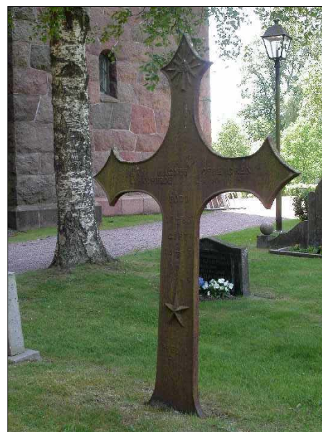
Gjutjärns kors i kvarter A, från 1843

Den äldsta gravvården i kvarter A är ett gjutjärns kors i nästan manshöjd från 1843, alltså överflyttat från förra kyrkogården. Därtill finns ytterligare fyra gravar som är äldre än den nuvarande kyrkan. Gravvårdarna är jämnt fördelade från 1900-talets början fram till idag. Främst är det större familjegravar och i relation till övriga kyrkogården många av höga format på sockel. Fördelningen av gravar från 1900-talets början till idag är jämn varför de äldre gravvårdarna från 1800-talets slut till ca 1920-tal i jämförelse med andra kvarter präglar kvarteret i större omfattning. Av dessa är flera gjorda i diabas. En vård i form av en avbruten trädstam i röd granit från 1907, gjutjärnskorset från 1843, ett ringkors i ljus granit är andra gravvårdar som utmärker sig. Gravstenar från efterkrigstiden är låga och breda, och huvudsakligen i grå granit. De flesta har från början varit grusgravar, i vissa fall finns stenkanterna fortfarande kvar under grässvålen.