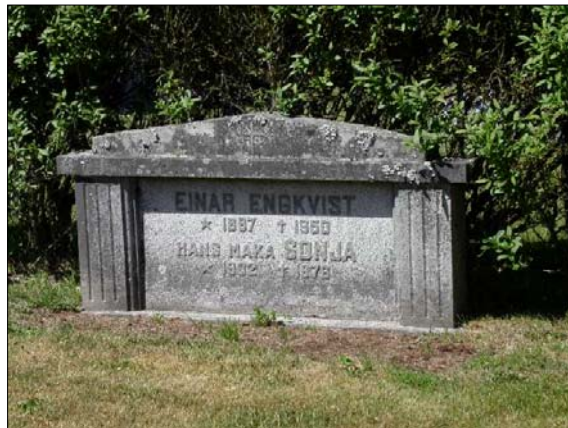
En av flera gravvårdar från 1950 som tids- och stilmässigt hör ihop med rygghäcksplanteringarna, och därigenom skapar en sammanhållen tidsbild.

Längs kantlinjerna ligger gravvårdar från 1900-talets början som nu är övervuxna med gräs men ursprungligen varit grustäckta och omgärdade av staket, stenramar eller häckplanteringar.