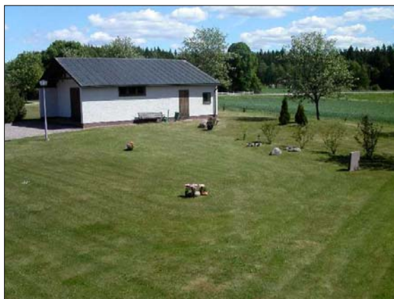
Minneslund, urlund och bisättningskapell, mot nord-ost. Platsen förlagd öster om övriga kyrkogården och omgärdas av idegranshäckar och oxel.

I kyrkogårdens förlängning mot öster finns en plats med minneslund, urlund och ett bisättningskapell. Platsen kom till redan i början av 1970-talet men fick sin nuvarande utformning 1991. Den är tydligt åtskild övriga kyrkogården genom växtlighet och den bevarade östra kyrkogårdsmuren, mot övriga sidor avgränsar en idegranshäck och en trädkrans av oxel. Längs infarten från vägen och mot denna växer ett tätt och högt buskage av tall. Bisättningskapellet ligger något snedställt mitt på platsen och nås från kyrkogården via en öppning i kyrkogårdsmuren som flankeras av två korneller. Söder om bisättningskapellet är anlagt en minneslund och en urlund och norr om kapellet en gräsplan med en rönn planterad som vådräd. Platsen har en fristående karaktär gentemot övriga kyrkogården och relaterar inte till denna varken vad gäller växtval, formspråk eller övrig allmän struktur.