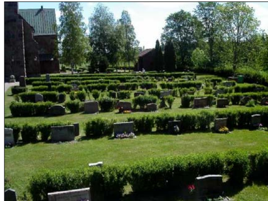
Kvarter B mot öster