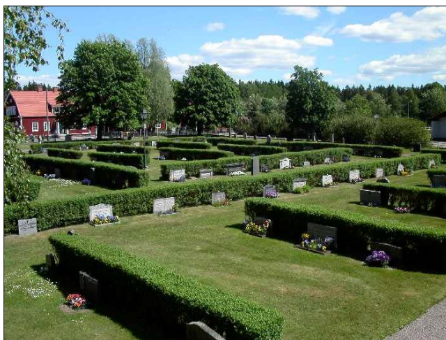
Kvarter C mot nordost. Rygghäckar planterade efter en form som tar upp den gamla kvartersindelningen med grusgångar i öst-västlig riktning.

Idag är kanthäckarna borta liksom de grusgångar som tidigare skilde de tre delarna från varandra. Istället har rygghäckar planterats längs gravlinjer som delvis anpassats till nu försvunna häckomgärdade gravar. Ett antal mer påkostade och högresta gravvårdar ligger nära kyrkans kor. Längs yttergångarna mot muren ligger också mer påkostade köpegravar, med undantag av den södra linjen där gravarna är enklare och mer anspråkslösa. De inre gångarna är gräsbevuxna, medan kantgången runt kyrkogården är lagd med grus.