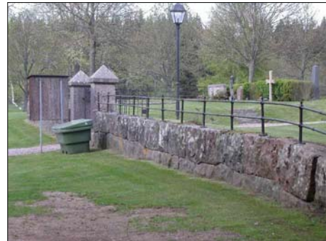
Västra ingången med mur, grindstolpar och järnräcke

Kyrkogården omges av en blandad trädkrans som består av alm, lind och lönn. I söder är krönet av stödmuren beväxt med en idegranshäck av varierande täthet och höjd. I kvarteren växer rygghäckar som i kvarter A och B består av måbär, medan rygghäckarna i kvarter C är av liguster. Mellan kvarter A och C söder om kyrkan står några björkar. I kvarteret A står det dessutom två storsvuxna pelartujor som troligen flankerat en nu borttagen gravvård.