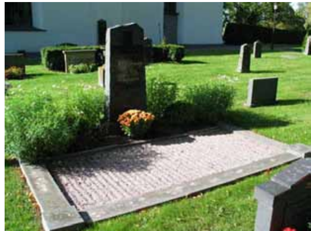
Grusgrav med stenram i kvarter E. (KI Hallingeberg 0115)