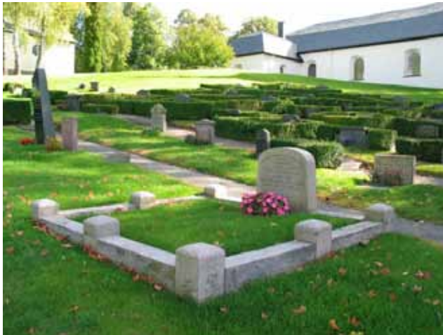
Kvarter F från nordväst. (KI Hallingeber 0047)

Detta kvarter har bevarat hela gravplatsarrangemangen. Upplevelsen och förståelsen förstärks av gravarna ligger i ett sammanhängande område. När de andra kvarteren efterhand förändras är det av stort värde att på ett ställe kunna se hur denna typ av gravplatser varit utformade. Alla gravar i rad 3-6 bör därför vårdas och bevaras. En särskilt intressant grav i området är i rad 1 grav F1, tidigare kontraktsprosten O W Redelius.