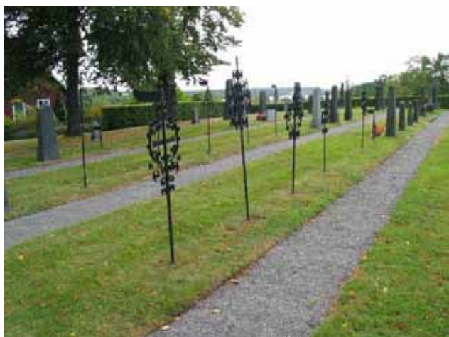
Smidesvårdar i kvarter. (KI Hallingeberg 0008)

Kvarteret bildar tillsammans med kvarter E ingången till kyrkogården. Dessa gravplatser har därför fått en större vikt. Det kan man se genom de många påkostade gravarna och det är här man valt att placera järnkorsen. Det kulturhistoriska värdet ligger i att stenarna visar på den betydelse som dessa personer haft i sin samtid. Här finns också flera av kyrkogårdens äldsta gravstenar; A27, A31, A34, A49, A51, A60, A69 och A78. Dessa bör samtliga bevaras. På kyrkogården finns knappt 20 gravstenar som är äldre än 1900. De stenar med kända namn och tidiga datering, korsen som berättar om Ankarsrum och de hantverksmässigt tillverkade stenarna som är unika har ett stort kulturhistoriskt värde.