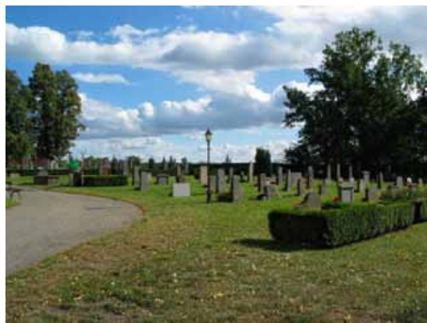
Vy över kvarter A och B från nordväst. (KI Hallingeberg 0075)