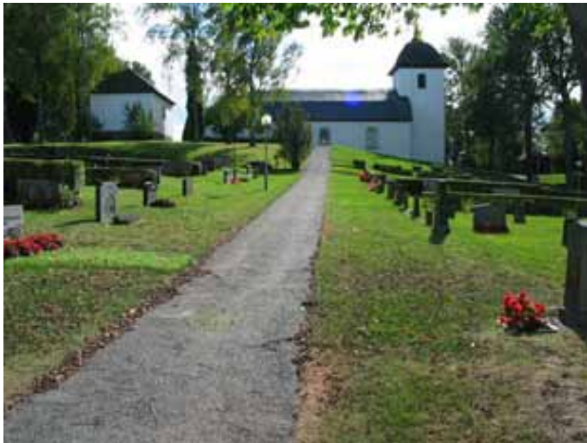
(KI Hallingeberg 0039)

Hallingeberg-Blackstad församling Linköpings stift Kalmar län