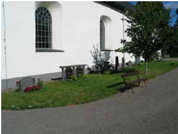
Kvarter D (KI Hallingeberg 0077)

De stora grusgravarna är borttagna. Stenramarna har varit en del av arrangemanget på dessa gravplatser. Det värde som finns idag ligger i historien omkring de personer som gravlagts i kvarteret.