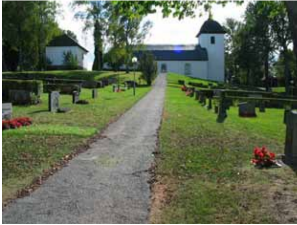
Gång i nord-sydlig riktning mellan kvarter H till höger och G till vänster. (KI Hallingeberg 0039)