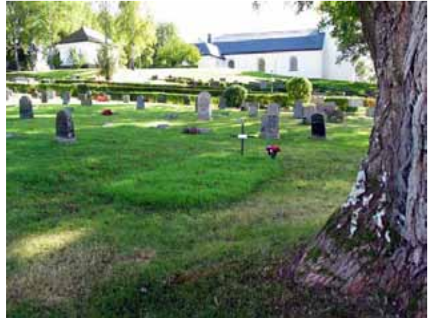
Kvarter G från nordväst med linjegravvårdar i förgrunden. (KI Hallingeberg 0041)