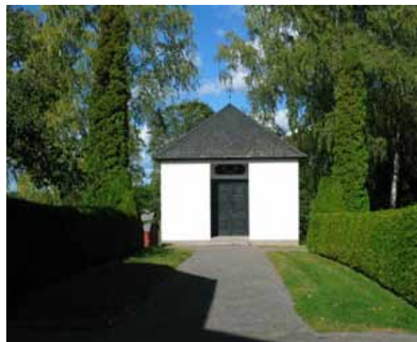
Gravkapellet (KI Hallingeberg 0021)