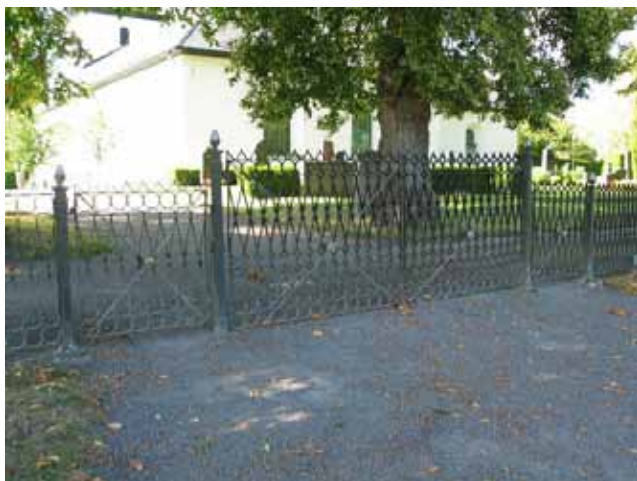
Ingång till kyrkogården i söder. (KI Hallingeberg 0009)

Vaktmästarnas personalutrymme och verkstaden finns i den moderna byggnaden på östra sidan av kyrkogården. Den öppnar sig ut mot grusgången längs den östra sidan av kyrkogården. Byggnaden är byggd i trä med stående panel och vitmålad. Taket är ett flackt sadeltak täckt med papp. På gravkartan från 1970 ligger en sexkantig byggnad på samma plats.