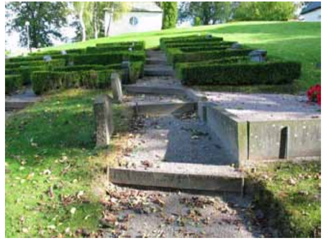
Kvarter F från väster. (KI Hallingeberg 0049)