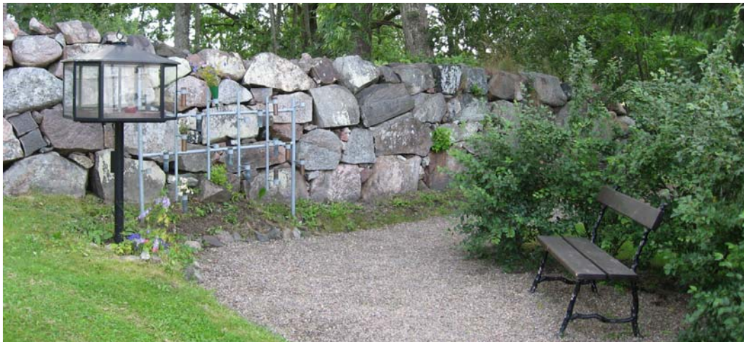
Minneslunden vid den östra muren.

I sydöstra hörnet finns en minneslund. I den finns ett ljusskåp av metall samt en ställning av grå metall för blomvaser. En bänk står vänd mot denna och har en häck av oxbär bakom sig. Strax intill minneslunden finns de tre runstenarna uppställda. Hela denna övre del mot gravkoret är öppen. En motsvarande bänk finns i närheten av kapellet.