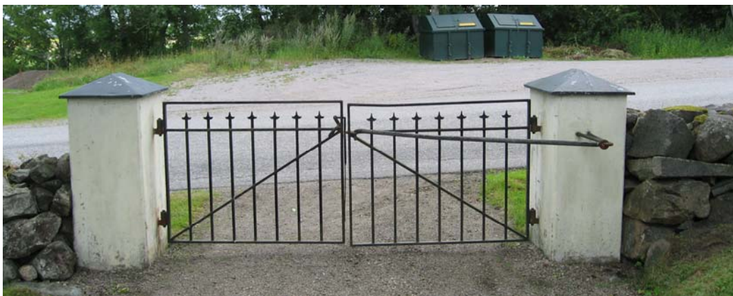
Den norra grinden.