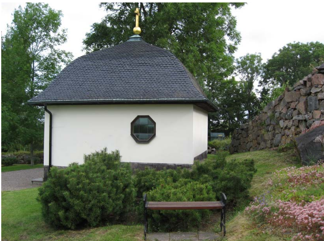
Kapellets södra sida. Den norra sidan är identisk med ett åttakantigt fönster som detta. Vid denna bänk finns betongplattor som sträcker sig i en liten, svängd gång från grusgången vid byggnaden.