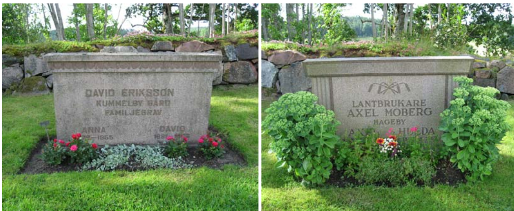
Dessa båda gravvårdar i kv. 2, är exempel på tidstypiska familjevårdar från 1950-talet. De har tidigare haft grustäckning och häckomgärdning.

Ett par äldre vårdar finns vid den västra muren. Flera av dem har enligt äldre foton haft omgärdning tidigare i form av stenram eller häck. I kv. 5 finns utmed de tre rygghäckarna endast tre vårdar, alla sentida. På den stora gräsytan norr om kyrkan finns tre, små linjevårdar. Systemet med linjevårdar växte fram i slutet av 1700-talet och innebar att begravingarna skedde på linje varefter dödsfallen inträffade. På så vis kunde äkta makar eller andra familjemedlemmar komma att begravas långt ifrån varandra. Från början innebar systemet troligen inte någon direkt statuskillnad men kom under 1800-talet att övergå till att bli en gravform för dem som inte kunde eller ville betala för en gravplats. Systemet upphörde 1964 varefter flertalet linjevårdar togs bort.