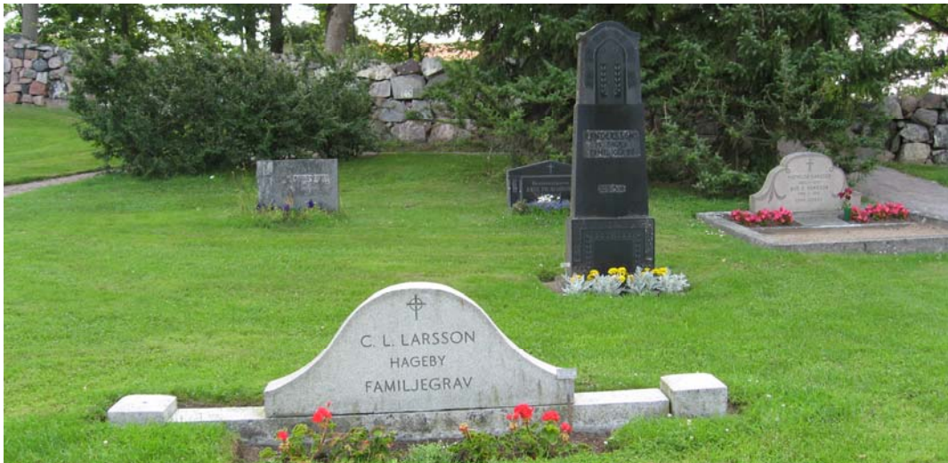
De två gravarna närmast i bild har tidigare haft stenramar och grustäckning. Bakom oxbärsbusken längst bak på den vänstra sidan av bilden, finns minneslunden.