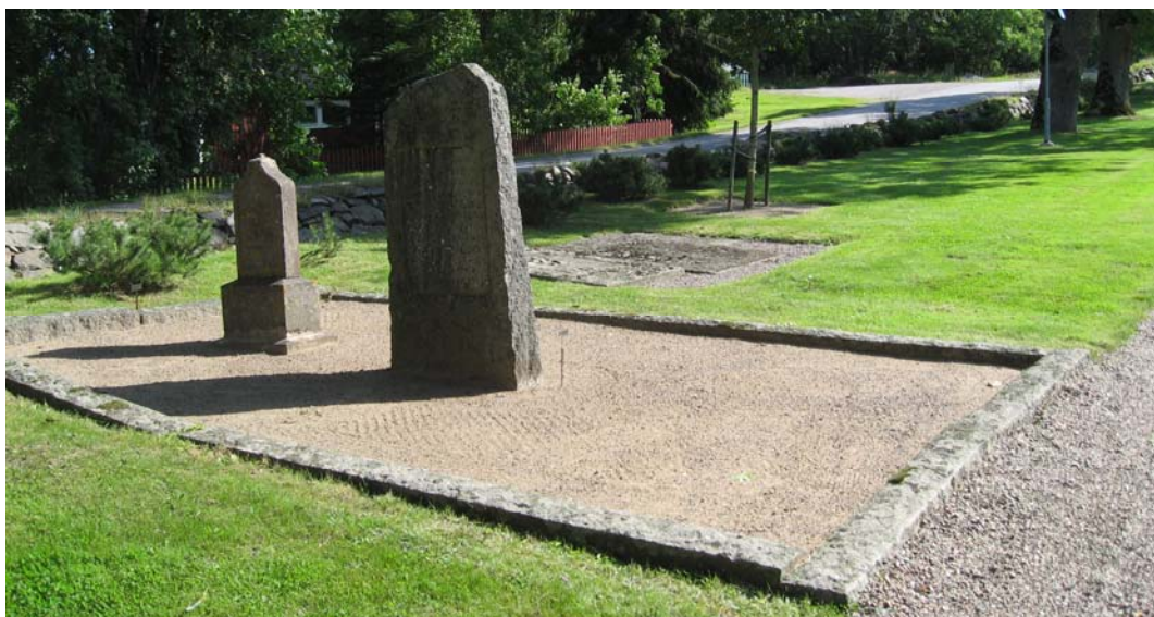
Vid det nordvästra hörnet av kyrkogården finns denna grusgrav med två vårdar från 1813 och 1844. På dess östra sida ligger två äldre hållar samt en avbruten, äldre vård.

Flera av vårdarna inom dessa kvarter har någon titel vilket ger dem ett kulturhistoriskt intresse. Det finns titlar som lantbrukaren, kantor, byggmästaren, kyrkoherden, ingenjören, f. kyrkovaktmästaren, smidesmästaren, kusken, prostinnan, fil dr samt klädesfabrikören.