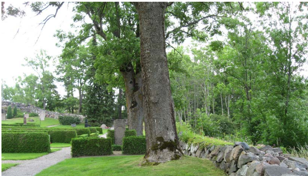
Södra muren med dess trädkrans. I mitten en omgärdad grav i kv. 2.

I kv. 2 finns en trädkrans av tre askar på den västra delen av sidan. I det sydöstra hörnet växer höga lövträd av diverse lövträd i ett område med sly. I kv. 4 finns sju rygghäckar av tuja. Flera gravar omgärdas av låga häckar av tuja och buxbom. Utmed den västra sidan finns en hög syrenhäck utanför muren. Två höga lönnar står utanför den större av de båda ingångarna medan en hög ask och en hög lönn står utanför den andra, mindre grinden. Längs grusgången som går i en vid båge mellan de båda grindarna och sträcker sig mot kyrkans västra ingång, finns fem unga lövträd. Möjligtvis kan dessa utgöras av oxel. I kv. 5 finns tre tujahäckar. Utanför den norra sidan finns en trädkrans bestående i huvudsak av askar. En låg, nyligen planterad, lönn ingår också i trädkransen. Låga tallbuskage finns innanför muren.