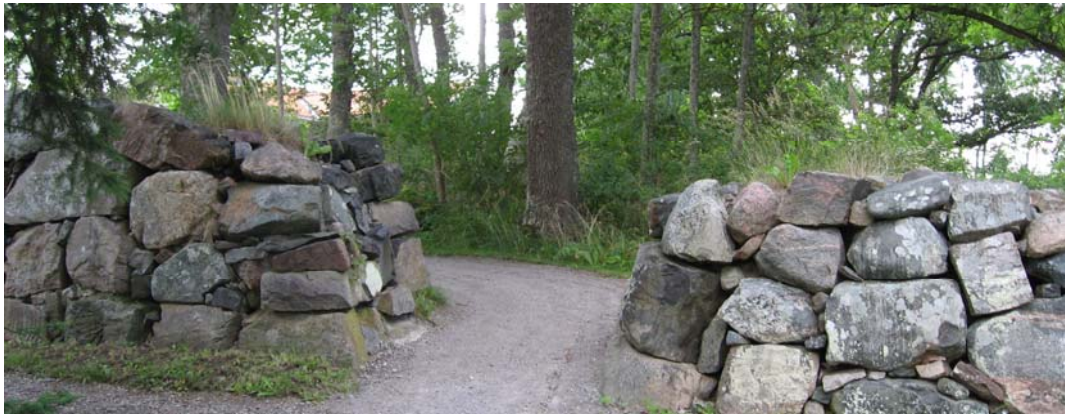
I den östra muren finns en öppning med en gång som leder bort till församlingshemmet.