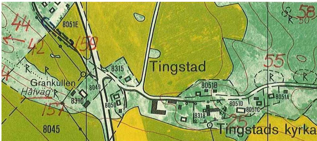
Utsnitt ur ekonomiska kartans blad nr 086 85 Styrstad, utgiven 1981.