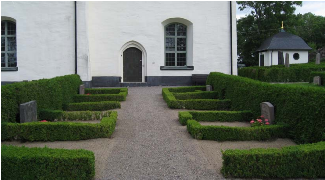
Exempel på de häckomgärdade grus/sandgravarna i kv. 4.