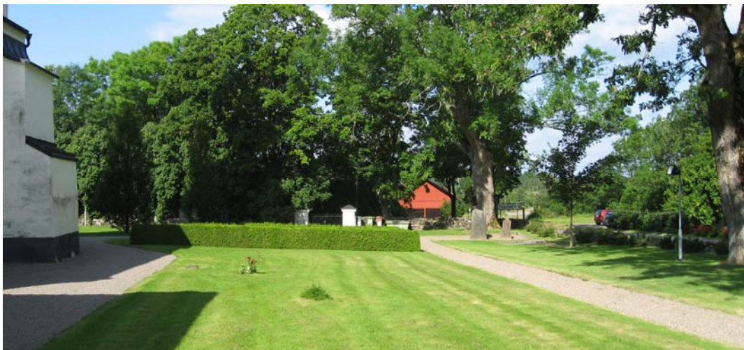
En stor del av norra sidan utgörs av en stor gräsyta med endast tre linjevårdar.