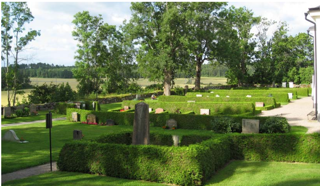
Den södra sidan med dess rygghäckar har en annan karaktär än den norra.