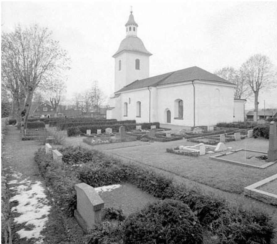
På dessa båda foton från 1961 visas att det tidigare funnits flera omgärdade gravar. På bilden ovan är de tre vårdarna i vänsterkanten, som omgärdas av häckar, kvar medan häckarna och grustäckningen är borttagna. Mittemot dem finns tre vårdar med stenram. Den längst åt höger är kvar medan de andra stenramarna tagits bort. Nedanför dessa finns tre vårdar med häck. Dessa häckar har också tagits bort.