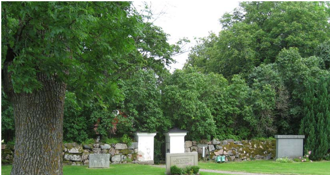
Denna grind finns också på den västra sidan men längre bort mot söder. Den leder till prästgården.