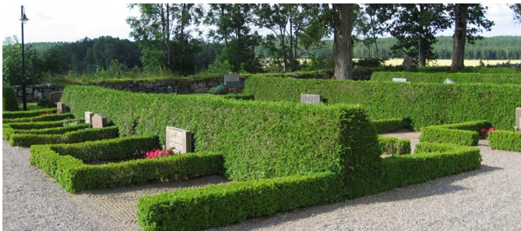
Häckomgärdade grus/sandgravar på den södra sidan.

Vidare finns det på den norra sidan utmed tre rygghäckar endast tre vårdar. Vid den norra muren finns en större grusgrav med två vårdar från 1800-talet samt två äldre hällar samt bredvid dessa en liggande, avbruten vård. Även denna är äldre, 1800-tal eller tidigare. På kyrkans östra sida finns ett flertal grusgravar som omgärdas av häckar. Vårdarna är alla av alderdomlig karaktär med bl.a. gjutjärnskors, s.k. bautasten etc. Gjutjärnskorset som idag omgärdas av en häck av tuja hade tidigare en omgärdning av ett järnsmidesstaket enligt ett äldre foto från 1952. På den södra sidan finns på ömse sidor av två rygghäckar grusgravar som omgärdas av låga häckar av buxbom. Längs de övriga rygghäckarna finns ett fåtal vårdar.