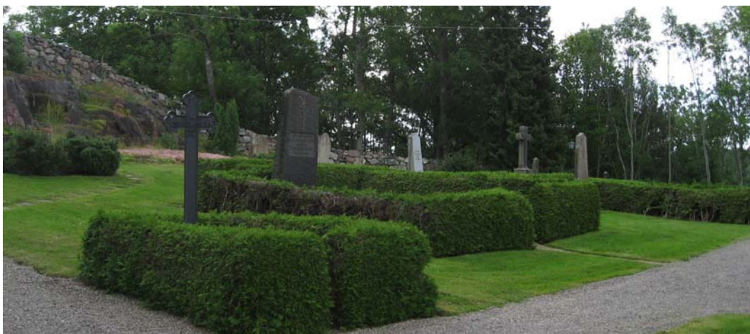
Kvarteret präglas av de häckomgärdade gravarna.

Gravarna omgärdas av tujahäckar. Det finns en ryghäck av tuja längst mot väster i den södra delen av kvarteret. Två höga ädelgranar står tätt vid ingångens norra sida. Ett lågt buskage av tall finns vid kapellets södra sida samt ett motsvarande mittemot vid minneslunden. Vid minneslunden, bakom bänken, finns ett buskage av oxbär.