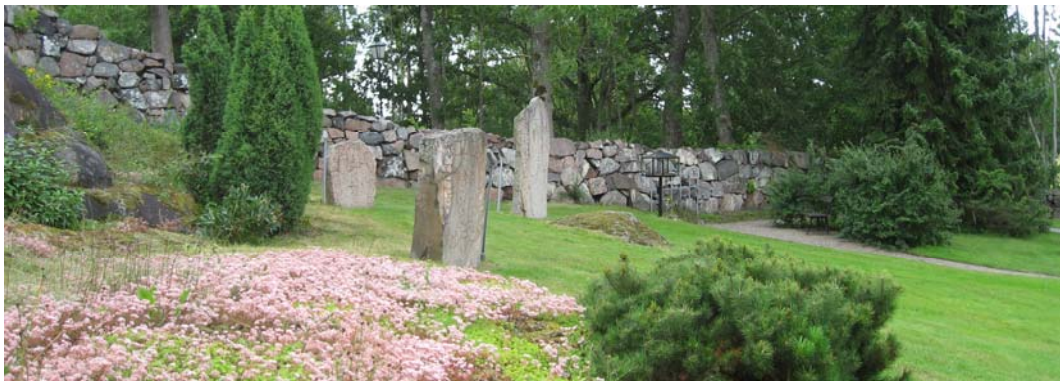
De tre runstenarna står vid den östra muren.

När stenarna skulle ställas upp på sin nuvarande plats togs ett flertal träd bort för att platsen mer skulle komma till sin rätt.