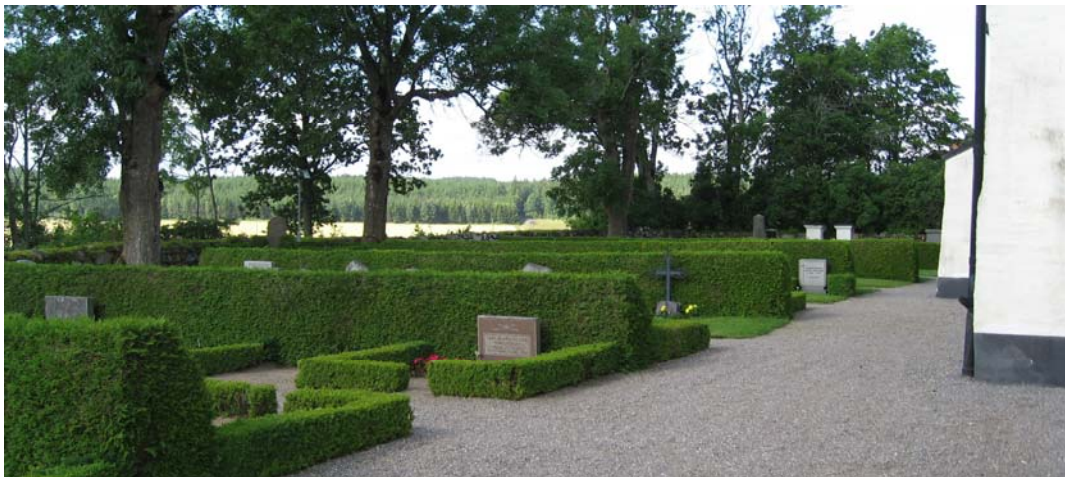
Ryghäckarna dominerar den södra sidan av kyrkogården.