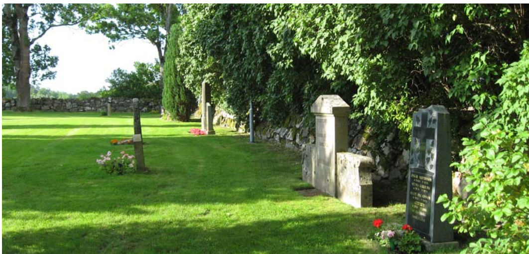
En kyrkogårdsmur sträcker sig utmed den västra sidan och utanför denna växer en hög syrenhäck. I bakgrunden skymtar den södra muren. Se även södra muren nedan.

Norr: muren är ca 0,6-1m hög och består av små och stora stenar med oregelbunden skiftgång. En trädkrans bestående från öster till väster av en ask, en låg ask, två höga askar, en låg lönn samt en hög ask.