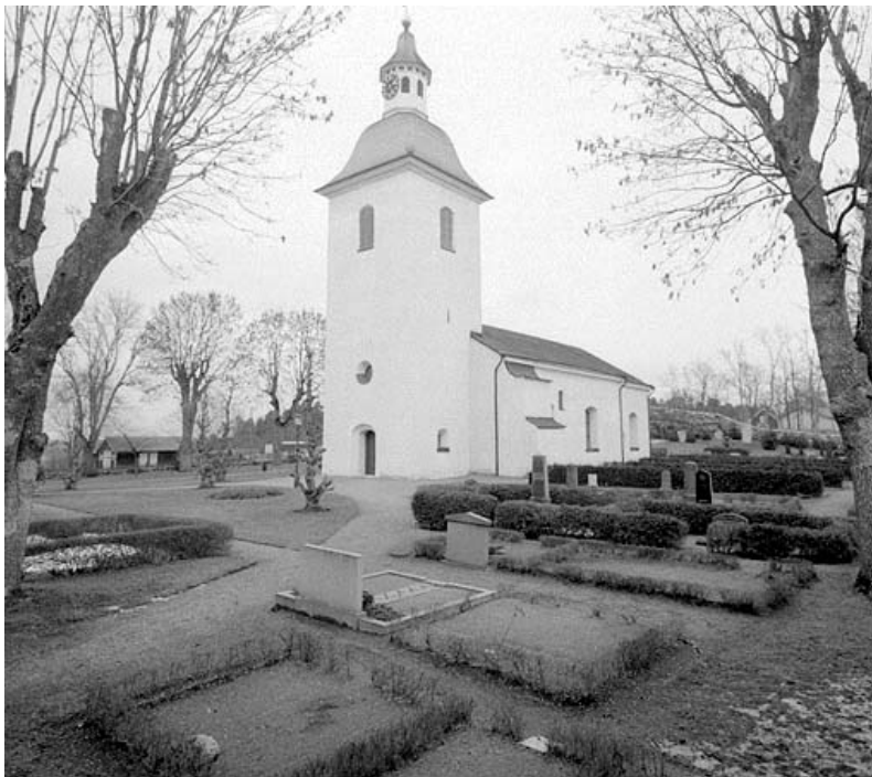
Grus och häckomgärdning är borttaget på dessa vårdar.