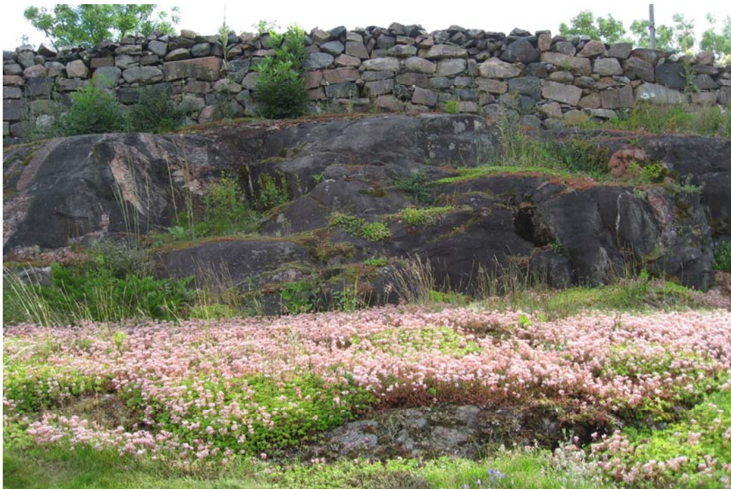
Den östra muren går uppe på det berg som finns i öster. Blommande sedumväxter i förgrunden.