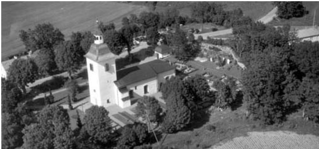
Flygfoto från 1958. Kapellet, byggt 1952, syns nordöst om kyrkan. Utöver att en del av träden inte längre finns kvar, vissa omgärdade vårdar tagits bort och att det i kv. 5, nordväst om kyrkporten, idag finns tre rygghäckar, så har inte kyrkogården förändrats nämnvärt på 50 år.