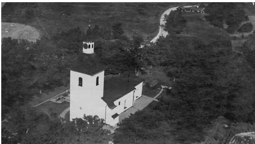
Flygfoto från 1935. Det fanns inte heller tidigare, som när den här bilden togs, så många gravvårdar på Tingstads kyrkogård. På den norra sidan av kyrkan skymtas dock några grusgravar. Dessa finns inte längre kvar. För övrigt är kyrkogården ännu i stort sett sig lik. Delar av trädkransen har tagits bort.

En trädkrans av ask har under lång tid omgärdat kyrkogården, vilket det äldre bildmaterialet visar. Dock har flertalet träd på bl.a. södra sidan tagits bort. På östra sidan syns på fotot nedan ett flertal träd. Dessa finns inte längre kvar.