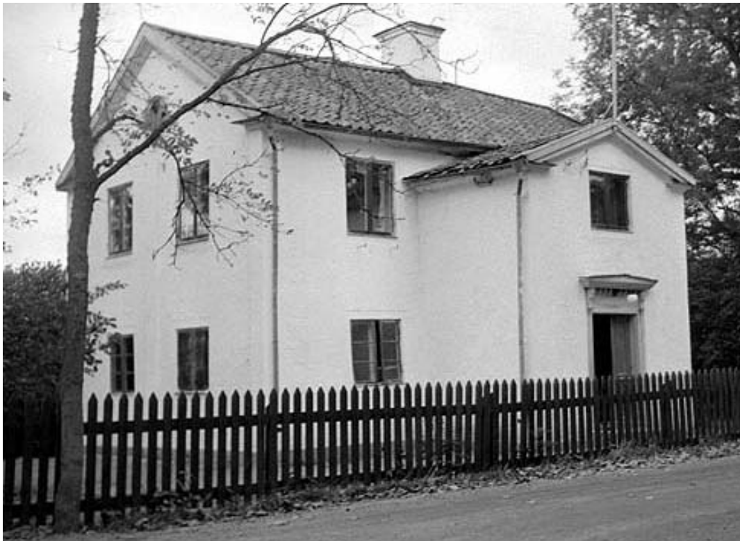
Den f.d. kyrkskolan som ligger på kyrkans norra sida.