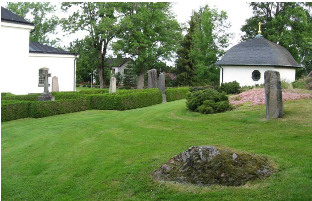
Vy över en del av kvarteret med kapellet i bakgrunden.