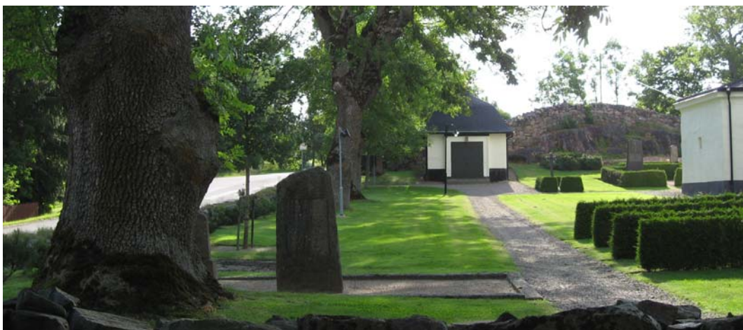
Den norra sidan av kyrkogården med kapellet i bakgrunden.

Till största delen har kyrkogården en öppen karaktär. Söder om kyrkan är kyrkogården strikt indelad med rygghäckar i nord/sydlig riktning. Öster om kyrkan och på delar söder om kyrkan finns det grusgravar omgärdade av tujahäckar. Öster om kyrkan står en del höga vårdar på familjegravar. På den stora gräsytan på kyrkogårdens norra sida finns endast tre små linjevårdar kvar. I nordvästra hörnet finns bl. a. en stor grusgrav med stenram och två äldre gravhällar samt en trasig, äldre vård som lagts ned.