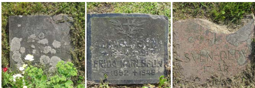
Linjevårdar på den norra sidan av kyrkan.

Det finns över huvudtaget inte så mycket gravvårdar på kyrkogården. Till att börja med på den norra sidan finns endast tre linjevårdar kvar på den stora gräsmatta som ligger längs med kyrkan. Systemet med linjevårdar växte fram i slutet av 1700-talet och innebar att begravningarna skedde på linje varefter dödsfallen inträffade. På så vis kunde äkta makar och andra familjemedlemmar komma att begravas långt ifrån varandra. Från början innebar systemet troligen inte någon direkt statuskillnad men kom under 1800-talet att övergå till att bli en gravform för dem som inte kunde eller ville betala för en gravplats. Linjegravssystemet upphörde 1964 varefter flertalet vårdar togs bort. Det är av vikt att dessa linjevårdar bevaras.