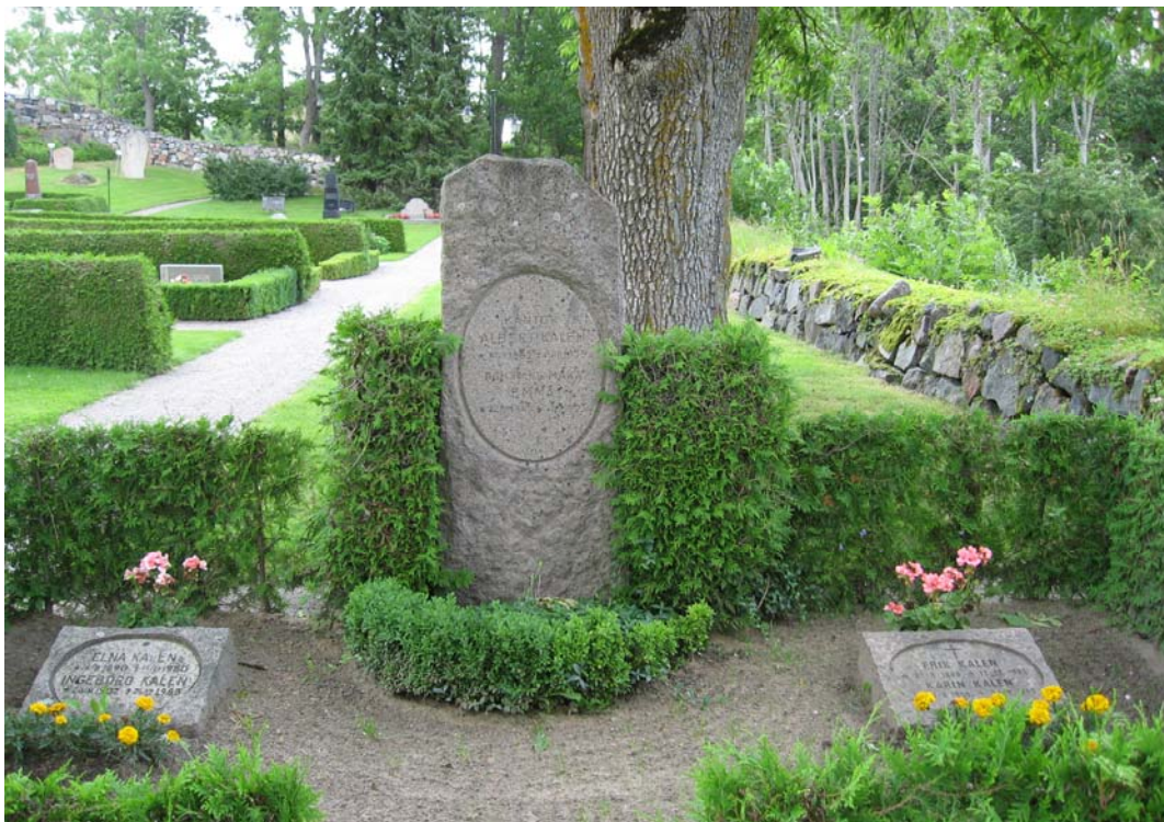
Sandtäckt grav vid den södra muren som omgärdas av en häck av tuja. Rest 1923 till minne av kantor Kalén med maka.