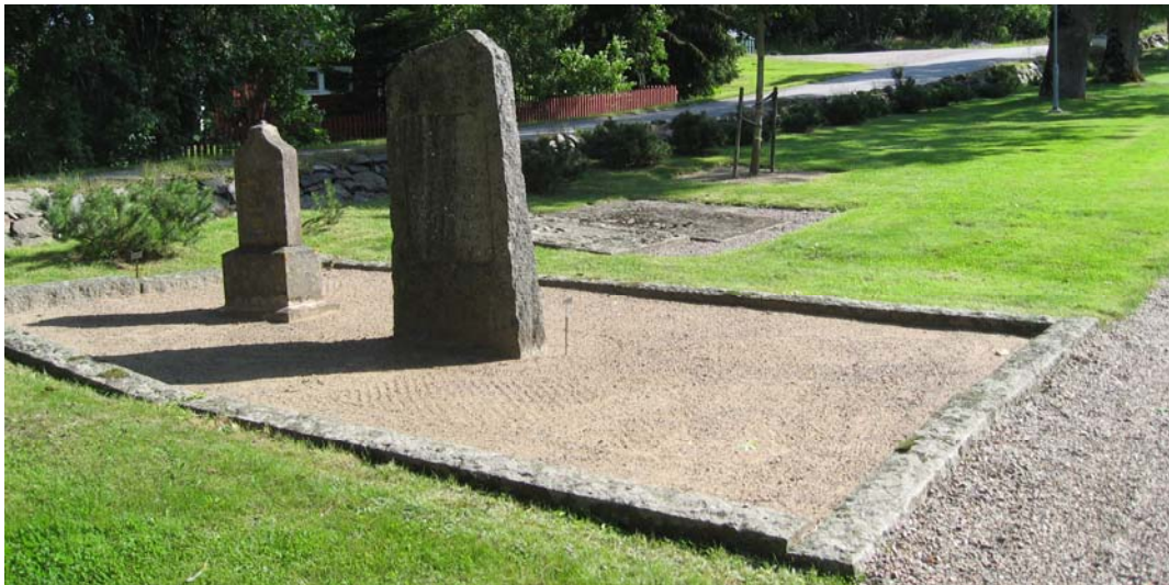
Vid den norra muren i det nordvästra hörnet finns en större grusgrav med två vårdar från 1800-talet. Två äldre hällar samt en avbruten vård ligger bredvid.