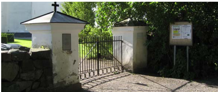
Den västra grinden.

Norr: pargrind i järnsmide med en enkel dekor. Grindstolparna är vitputsade, fyrkantiga cementstolpar med ett plåttak som är valmat med en svag lutning.