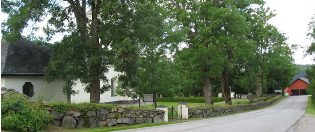
Den norra muren med dess trädkrans av i huvudsak askar.