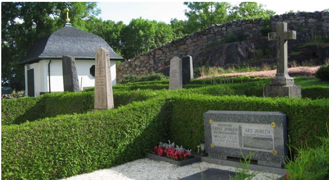
På kyrkans östra sida finns ett flertal grusgravar som omgärdas av häckar.

De titlar som finns på Tingstads kyrkogård är hemmansägaren, trädgårdsmästare, bokhandlaren, kyrkoherde/n, nämndemannen, smidesmästaren, agronom, prosten, justitierådsmannen, lantbrukare, kantor, byggmästaren, ingenjören, f. kyrkovaktmästaren, kusken, prostinnan, fil dr samt de två längsta titlarna, klädesfabrikören Norrköpings possessionaten samt rector scholar i Norrköping. De båda sistnämnda vårdarna är två de äldsta från 1847 respektive 1844. Den äldsta, daterbara, vården är från 1813.