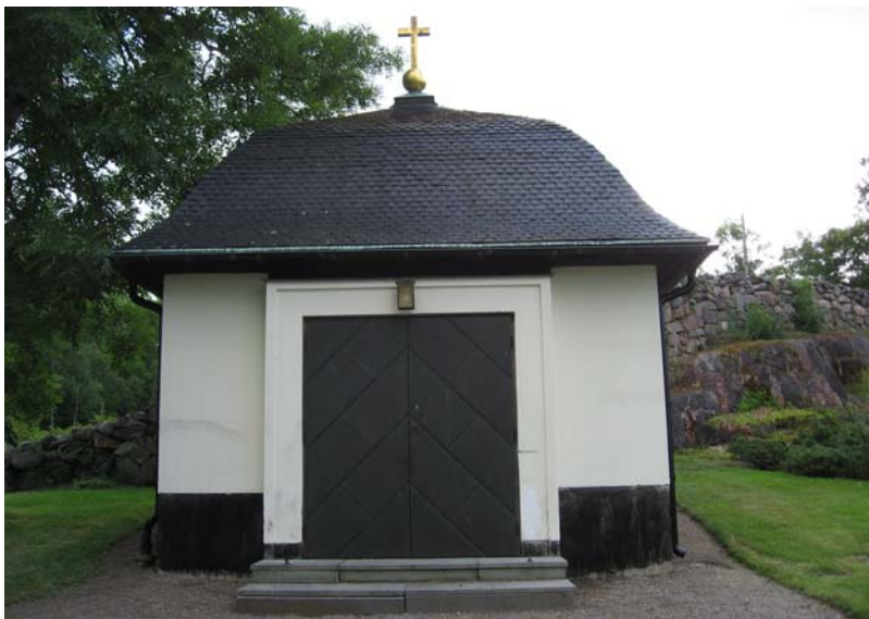
Kapellet från väster.