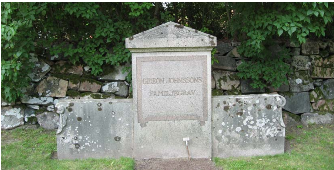
Utmed den västra muren finns också denna vård. Den har tidigare haft stenram.