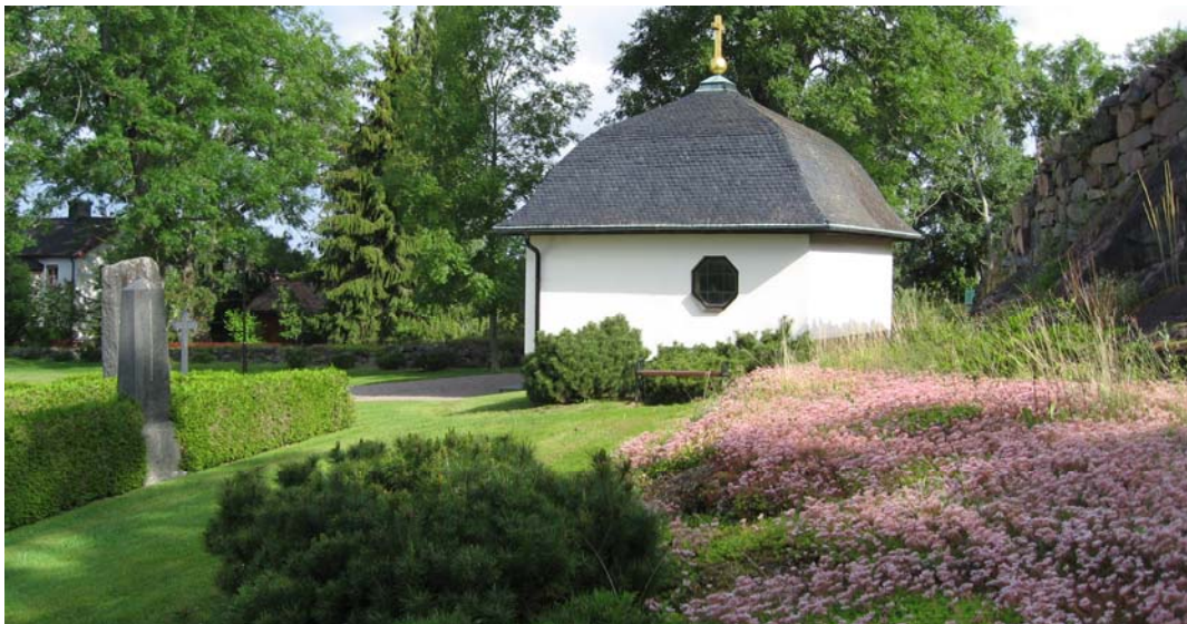
Kapellet ligger på den östra sidan vid berget.