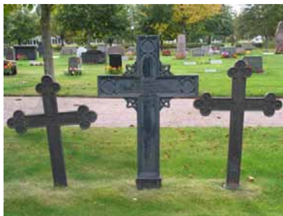
De tre, förmodligen musealt uppställda, gjutjärnskorsen. (KI Mönsterås kyrkog 72)