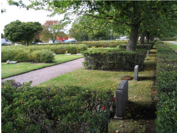
Kvarter 43-49 från söder. (KI Mönsterås kyrkog 91)