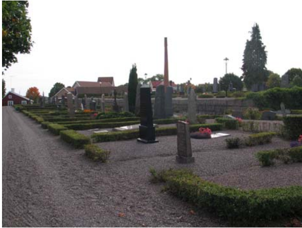
Kvarter 3 från norr. (KI Mönsterås kyrkog 14)