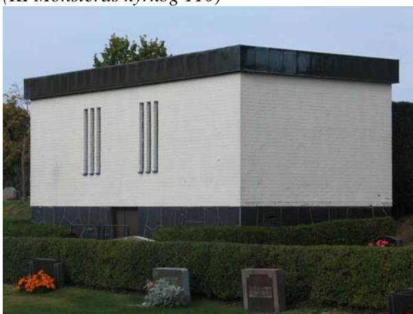
Bårhuset från 1960-talet.