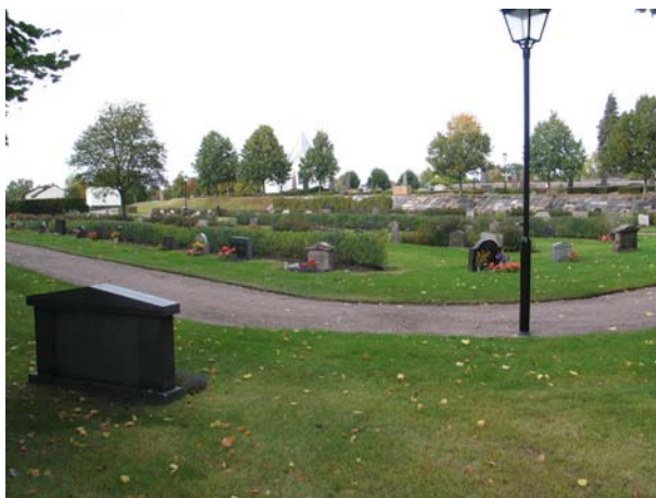
Kvarter 13-27 från söder. (KI Mönsterås kyrkog 88)

Dessa kvarter tillkom vid en utvidgning som gjordes på 1930-talet och ligger nedanför åsryggen sydväst om den äldsta delen som ligger uppe på krönet. Gränsen mellan dessa båda områden utgörs av en brant grässlänt. I den södra delen av slänten har ett område iordningsställt som plats för gravvårdar som flyttats från sin ursprungliga plats. Gravvårdarna har lagts ned i en grusbädd. Kvarteren fördelar sig på två områden på var sida mittgången. Längs med områdenas kanter ligger stora köpegravar, medan det i mitten finns mindre köpegravar och allmänna gravar i rader i nordsydlig riktning. I raderna är gravvårdarna ryggställda och flertalet rader har låga rygghäckar. Kvarterens utformning har förenklats vid omläggningar senare på 1900-talet. En grusad gång löper runt hela området.