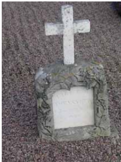
Vård av sandsten och marmor från sent 1800-tal. (KI Mönsterås kyrkog 26)