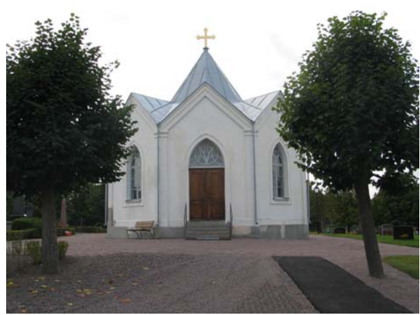
Gravkapellet. (KI Mönsterås kyrkog 42)