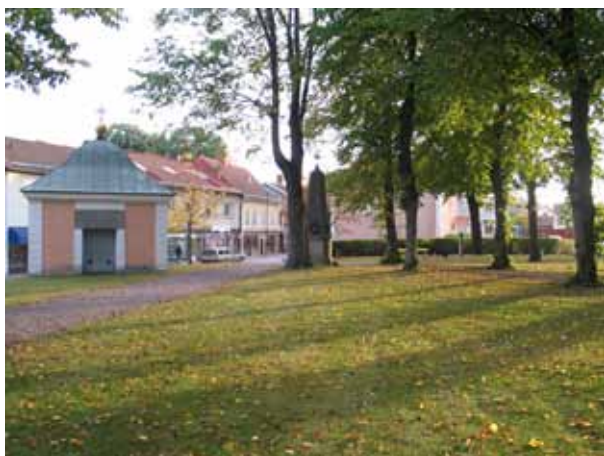
Kyrkoparken med gravkoret och minnesmonument. (KI Mönsterås kyrkog 122)

Det har med säkerhet funnits en kyrkogård lika länge som det har funnits en kyrka i Mönsterås. Den första avbildningen är J.H. Rhezelius teckning från 1634. På den syns kyrkan med kyrkogården åt söder, omgärdad av en bogårdsmur och med en klockstapel i det nordöstra hörnet. På kyrkogården står gravvårdar som förmodligen var av trä och ett litet gravhus. 1783 uppförde baron G. Ulfsparre ett gravkor i kyrkogårdens sydvästra hörn, mot