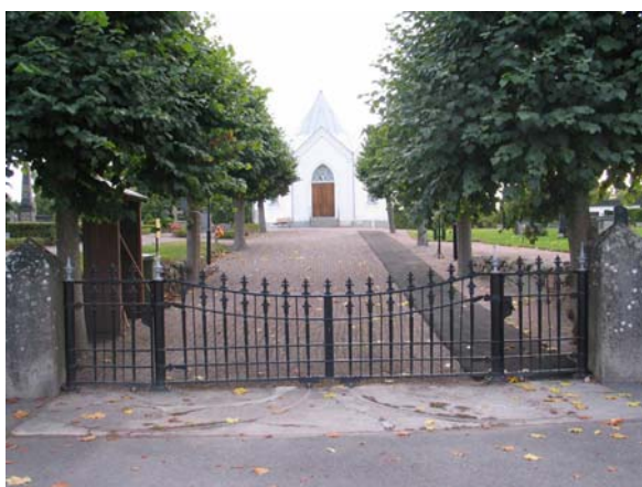
Entrén från Storgatan i norr. (KI Mönsterås kyrkog 114)

I söder: Modernt utformade låga smidesgrindar mot gatan och parkeringen.