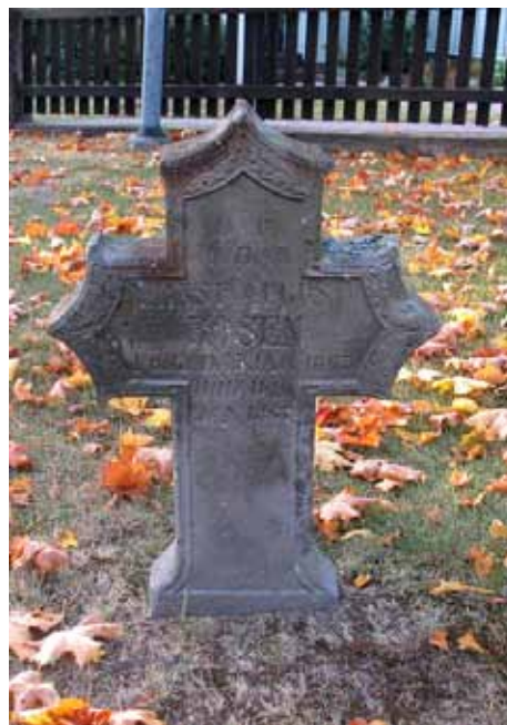
Vård från sent 1800-tal. (KI Mönsterås kyrkog 117)