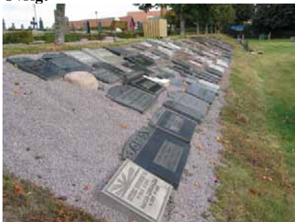
Grusad slänt med vårdar som tagits bort från sina ursprungliga platser. (KI Mönsterås kyrkog 79)