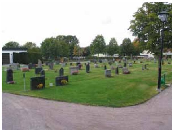
Kvarter 2 från söder. (KI Mönsterås kyrkog 62)