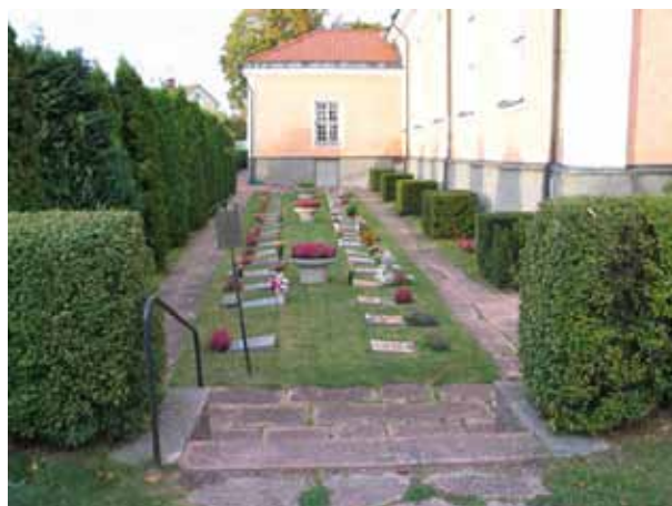
Urnlunden från söder. (KI Mönsterås kyrkog 115)