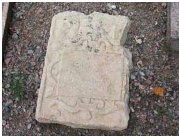
Fragment av äldre vård av kalksten. (KI Mönsterås kyrkog 81)

I slänten mellan köpegravskvarteret uppe på kullen och den södra delen av 1930-talsutvidgningen finns en grusad yta där vårdar som tagits bort från sin ursprungliga plats visas upp. Flertalet av vårdarna är från 1920-50-tal. Där finns även några äldre vårdar, bl.a ett rikt dekorerat fragment av en äldre kalkstensvård. Den måste, av dekoren och skicket att döma, härröra från kyrkogården intill kyrkan i köpingen.