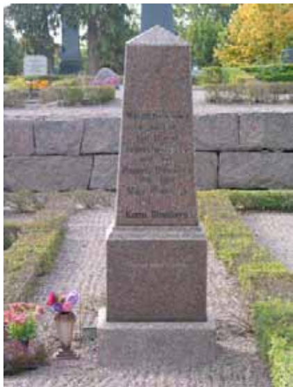
Påkostad vård av våneviksgranit. (KI Mönsterås kyrkog 19)

kyrkovärden, fyrmästaren, mejeristen, öf. Maskinisten, garfverifabrikör, styrman, v. konsul, doktor, poliskommissarie, köpman, postassistent, tandläkare och kantorn.