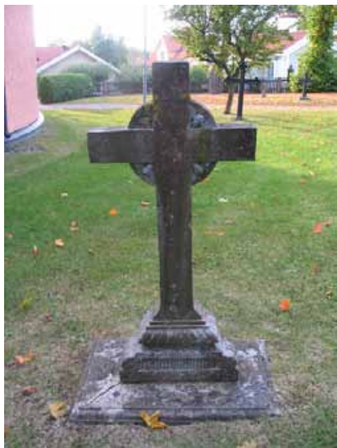
Äldre vård av kalksten med bronsornament. (KI Mönsterås kyrkog 119)

Kyrkoparken var Mönsterås sockens kyrkogård fram tills att den nya begravningsplatsen anlades 1872. Då hade traditionen att begrava de döda på denna plats pågått sedan medeltiden. Befolkningsökning och nya hårdare krav på hygien gjorde att den gamla kyrkogården övergavs. När den nya begravningsplatsen stod klar omvandlades den gamla till park. Denna funktion har platsen än idag. Genom de kvarvarande gamla vårdarna, gravkoret och minnesvården är det fortfarande tydligt för var och en som ser parken att där en gång varit en kyrkogård. Samtliga gravvårdar har stora kulturhistoriska värden och bör stå kvar på sina platser samt föras upp på församlingens inventarieförteckning. Även gravkoret och minnesvården bör även fortsättningsvis bevaras och skötas så att platsens historia förblir läsbar för besökare. Urnlunden väster om kyrkan har en tydlig arkitektonisk form som bevarats sedan anläggningstiden.