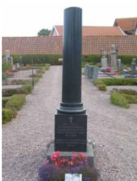
Minnesstenen över omkomna i Forsabranden (KI Mönsterås kyrkog 51)