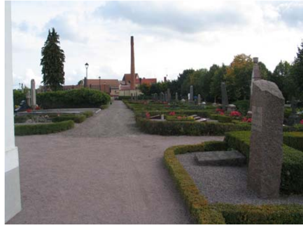
Kvarter 10 från norr. (KI Mönsterås kyrkog 41)