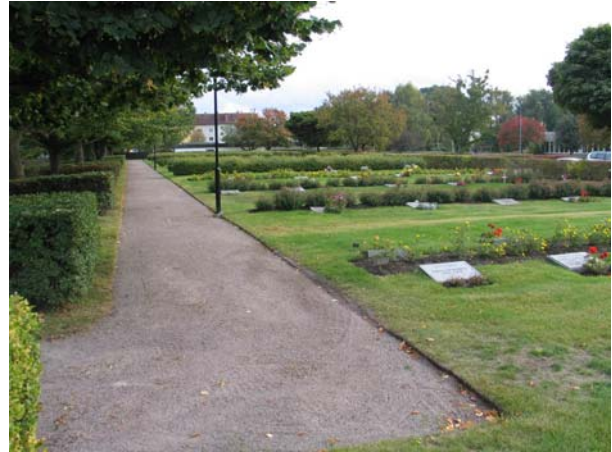
Kvarter 43-49 från norr. (KI Mönsterås kyrkog 97)