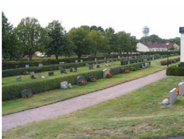
Kvarter 14-42 från syd öst. (KI Mönsterås kyrkog 78)