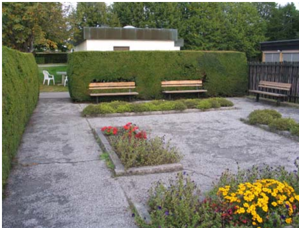
Sittplatser och trädgårdsrum intill ekonomibyggnaden. (KI Mönsterås kyrkog 110)

Bårhuset uppfördes vid mitten 1960-talet liksom ekonomibyggnaden. Båda är uppförda i mycket tidstypisk stil.