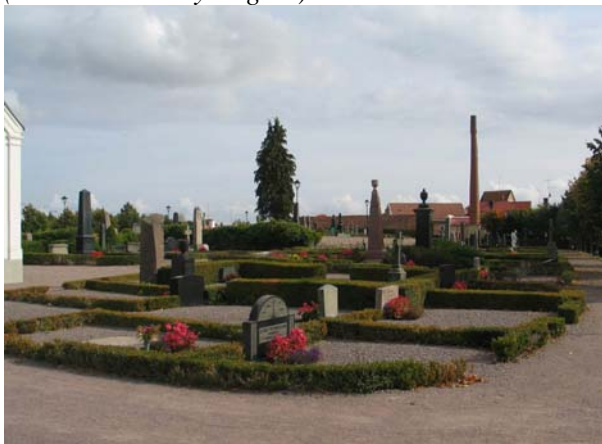
Kvarter 11 från nordväst. (KI Mönsterås kyrkog 29)