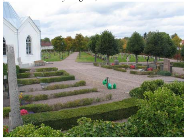
Kapellet ligger mellan området med gamla allmänna linjen och kvarteren med köpegravar. (KI Mönsterås kyrkog 57)