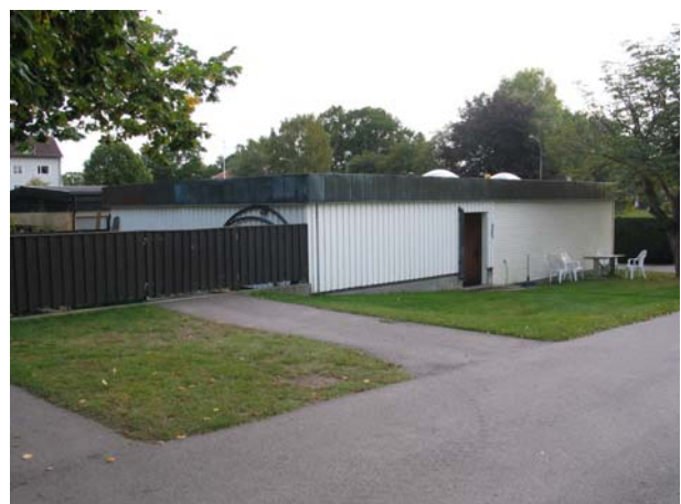
Ekonomibyggnaden från 1960-talet. (KI Mönsterås kyrkog 109)