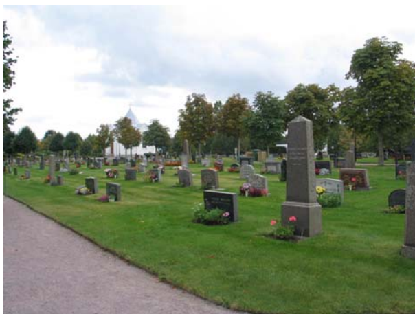
Kvarter 1 från norr. (KI Mönsterås kyrkog 58)

Dessa båda kvarter ligger väster om kapellet på den äldsta delen av kyrkogården. Området utgör en enklare utformad pendang till köpegravsområdet på andra sidan kapellet. Här väster om kapellet är karaktären av ett typiskt linjegravsområde fortfarande påtaglig. Området är sedan 1980-talet helt igensått med gräs men många av de typiska små linjegravstenarna av svart granit finns fortfarande kvar här och var över hela området. Planteringar utöver de vid enskilda gravvårdar saknas helt. De låga, stående vårdarna dominerar området och profilen bryts bara av enstaka högre stenar. Kvarteren ligger på var sida om en mittgång med en allé av relativt unga hästkastanjeträd. Även runt hela området löper en grusgång. I syd-östra delen av området ligger bårhuset från 1950-talet.