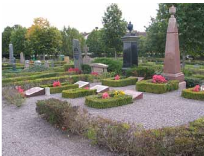
Kv. 3-12 från norr. (KI Mönsterås kyrkog 40)