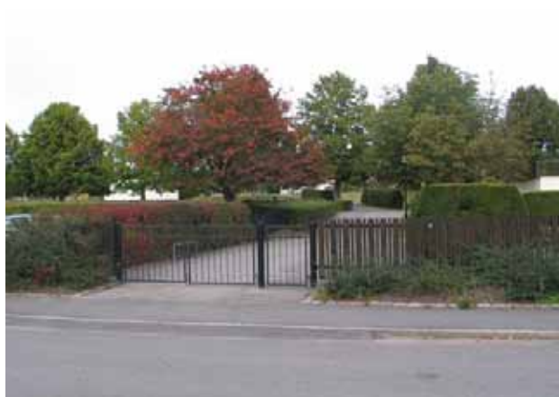
Entrén från söder. (KI Mönsterås kyrkog 111)