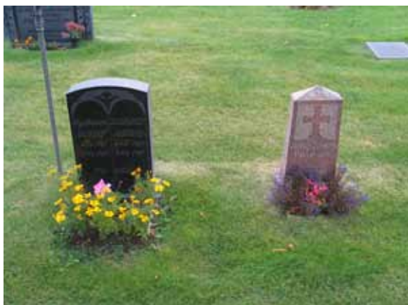
Linjegravvårdar, varav den högra är tillverkad av våneviksgranit. (KI Mönsterås kyrkog 101)