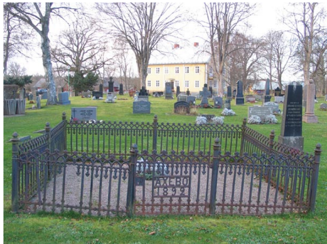
Gjutjärnsvård och bevarad grusbeläggning från 1892 i kvarter B. (KI Fagerhult kyrkog 080)