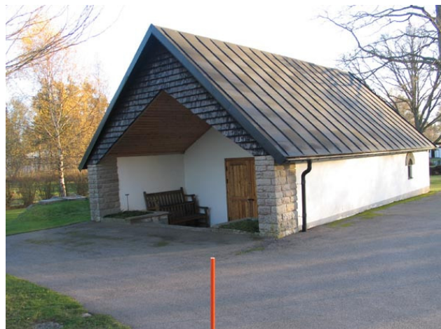
Bårhuset uppfört 1952 (KI Fagerhult kyrkog 153)