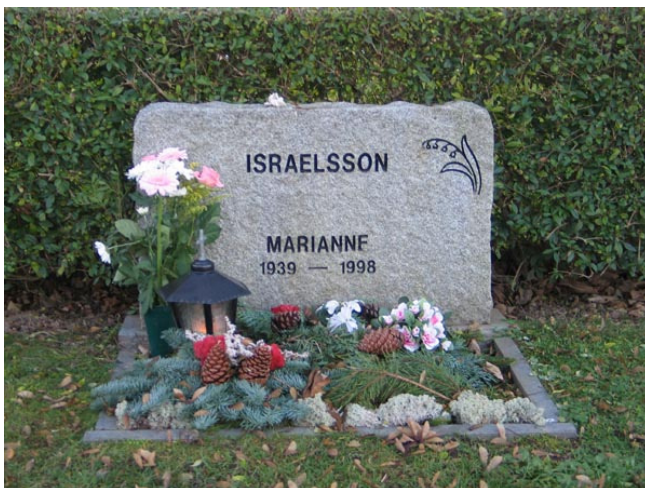
Gravvård i kvarter D (KI Fagerhult kyrkog 163)

På en av vårdarna anges den dödes yrkestitel, glasblåsaren. På nästan hälften av gravvårdarna anges den dödes hemort.