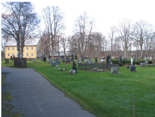
Översikt över kvarter B från sydost. Gamla skolhuset syns i bakgrunden (KI Fagerhult kyrkog 047)