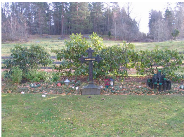
Minneslund tillkom öster om kyrkan 1993 (KI Fagerhult kyrkog 013)