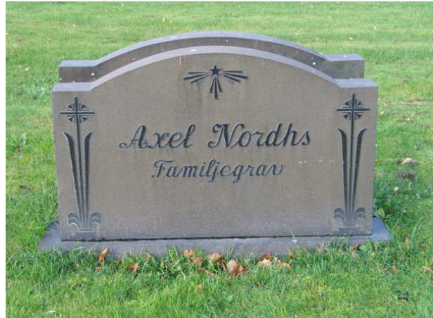
Vanlig typ av vård i kvarter A (KI Fagerhult kyrkogård 037)