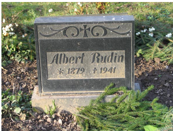
Mindre vård i kvarter A troligen linjegravsvård (KI Fagerhult kyrkog 042)