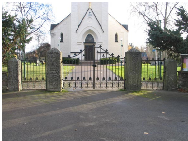
Ingången i väster med svartmålade järngrindar (KI Fagerhult kyrkog 006)