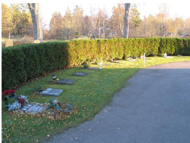
Urngravsområdet öster om kyrkans kor. (KI Fagerhult kyrkog 149)