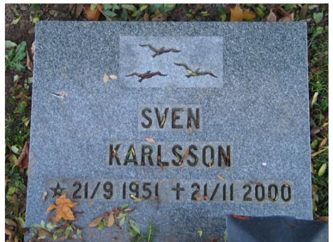
Liggande gravvård i kvarter D (KI Fagerhult kyrkog 165)