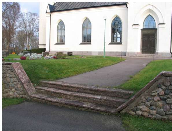
Ingången i söder består av en enkel kalkstenstrappa (KI Fagerhult kyrkog 001)