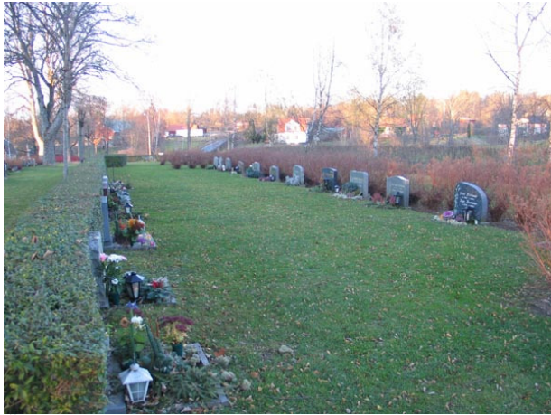
Översikt över den del av kvarter D som tagits i bruk från sydost (KI Fagerhult kyrkog 162)