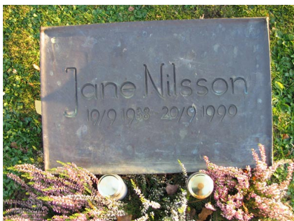
Liggande vård av kopparplåt i urngravsområdet (KI Fagerhult kyrkog 152)