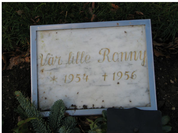
Liggande marmorvård med skyddande glasskiva i kvarter A (KI Fagerhult kyrkog 034)