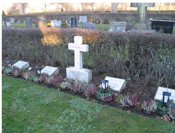
Några av kyrkogårdens många vårdar av marmor kvarter C (KI Fagerhult, kyrkog 138)