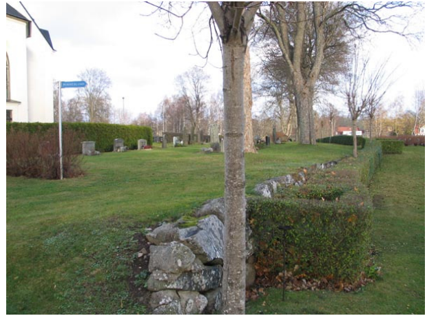
Gränsen mellan nya delen, kvarter D och gamla delen av kyrkogården, kvarter C (KI Fagerhult kyrkog 015)