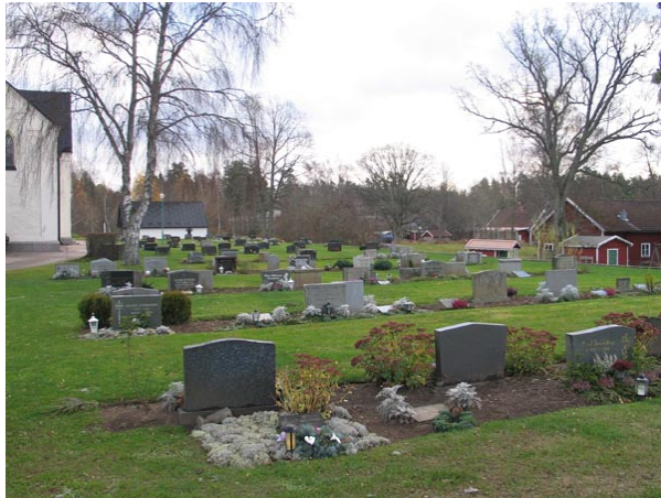
Översikt över kvarter A från väster (KI Fagerhult kyrkogård 028)

Kvarter A består av ungefär 307 platser och ligger söder om kyrkan. Området avgränsas i söder och väster av kyrkogårdsmuren. I norr och öster löper en asfalterad gång. Kvarteret delas i två hälfter av den asfalterade gång som leder från trappan i kyrkogårdsmuren i söder fram till kyrkans södra ingång. Kvarteret består av dubbla rader med vårdar som är ryggställda. De två sista raderna längst i öster har dock en rygghäck av rosenspirea. Vårdarna är vända mot väster och öster samt en mot söder. Gravplatserna är anlagda för kistgravar. Hela området är gräsbesätt men gravvårdarna är placerade i öppen jord.