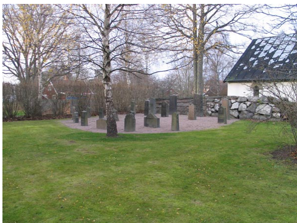
Olika typer av äldre vårdar uppställda på en iordningställd yta (KI Fagerhult kyrkog 016)

I den sydvästra delen av den gamla kyrkogårdsdelen finns bårhuset. Det uppfördes år 1952 av byggmästare Oskar Helgee i Alsterbro. Kapellet har vitputsad fasad och svartmålat plåttak likt kyrkan. Ingångspartiet har hörn av kalksten och trappan ner till kappellets ingång är också kalksten. På taggaveln över den inskjutna entrén är det tjärade träspån. Bårhuset används fortfarande som bårhus.