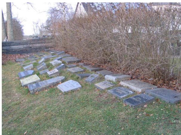
Äldre vårdar tagna ur bruk (KI Fagerhult kyrkog 018)