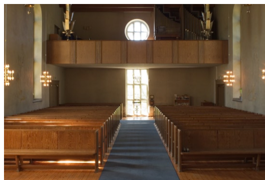
Interiör mot väster.

Den mindre, böneklockan, är stämd i C och