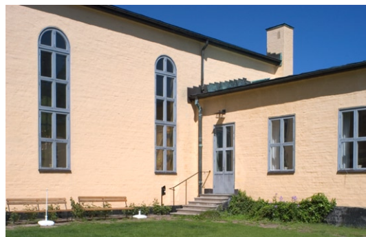
Entré i sydväst till församlingssalen.

klocktorn reser sig intill västpartiets sydmur. Huvudentrén går via terrassen in genom tornets östmur. Idag används entrén på kyrkans norrsida.