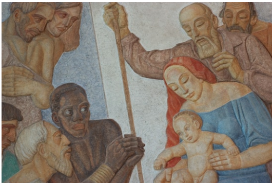
Detalj av korväggens relief. © SIMON GATE/BUS 2008

Fasaderna, ursprungligen tunt kalkslammade och ljusgult avfärgade, fick sin puts och skarpt gula avfärgning 1970. Sockeln är svartmålad. De höga, smala och på kyrkan rundbågigt avslutade fönstren är målade i grått. Tak och tornhuv med rundbågiga öppningar är täckta med kopparplåt. Den senare kröns av ett