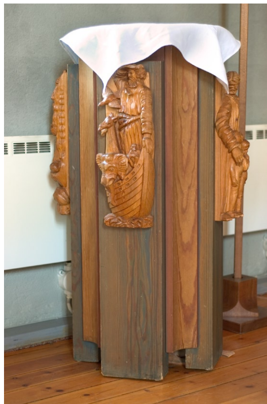
Dopfunten med reliefer av trä.

Taket i kyrkorummet är utformat som ett bjälktak av betsad furuplywood. Det samverkar i material med den övriga inredningen och ger tillsammans med bänkarna en fast ram åt rummet.