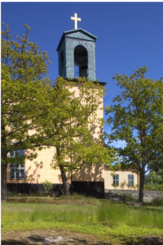
Exteriör mot väster.

Byggnadskroppen är rektangulär med kor och långhus i samma bredd och höjd. Ett sidoställt