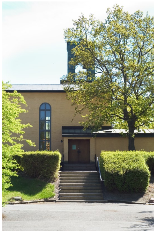
Huvudentré mot norr.

klocktorn reser sig intill västpartiets sydmur. Huvudentrén går via terrassen in genom tornets östmur. Idag används entrén på kyrkans norrsida.