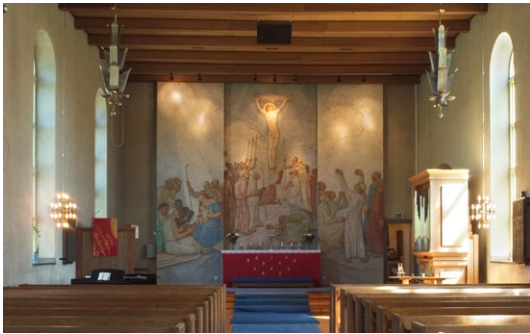
Interiör mot öster. Korväggsrelief © SIMON GATE/BUS 2008

1955 utvidgades församlingssalen med två fönsteraxlar mot söder och breddades mot öster. 1970 byggdes väntrum/brudkammare och serviceutrymmen vid långhusets nordvästra hörn och entré. Öster om koret uppfördes skrudkammare och ny sakristia. Samtidigt anlades församlingsgården öster om denna utbyggnad.