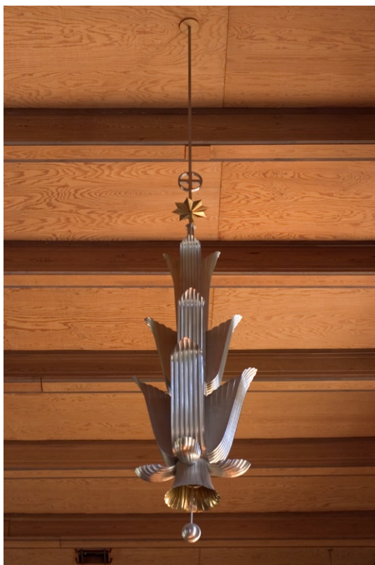
Armatur ritad av John Åkerlund och H Notini.

Orglarna i Breviks kyrka har växlat under årens lopp. Vid invigningen hade kyrkan en elektrisk Hammondorgel, skänkt av AGA. 1943 fick kyrkan en orgel med 13 stämmor som användes fram till 1967. Den nuvarande orgeln är byggd av Åkerman & Lund, Knivsta, och har 22 stämmor. Kororgeln från Grönlunds Orgelbyggeri, Gammelstad inköptes 1980. Den är försedd med 7 stämmor.