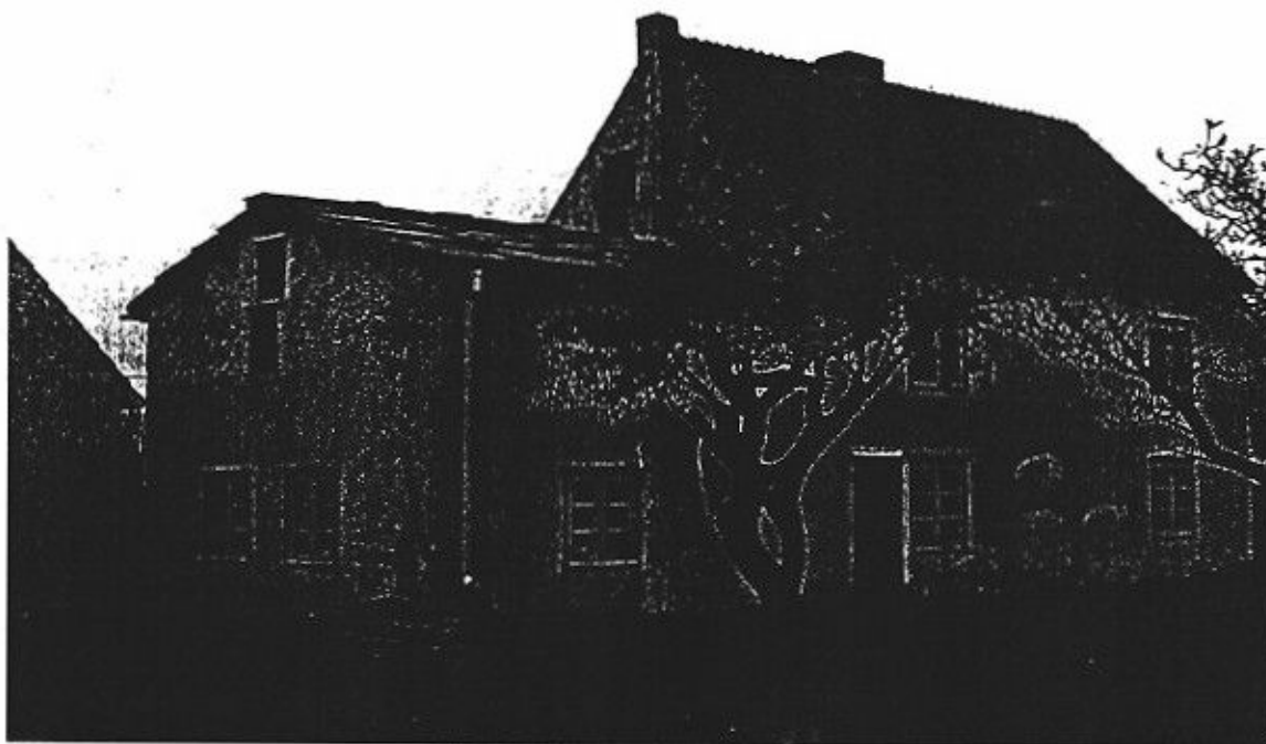
Manbyggnaden efter återläggningen av flistaket år 1999.

Ni har tagit initiativ till byggnadsminnesförklaring (BM) av fastigheten Hallvide 1:21 i Silte socken, Gotland.