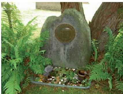
Bland mer speciella gravvårdar inom kvarter F är de som rests över två generationer kopparslagare. Dessa gravvårdar är helt eller delvis formade i koppar.