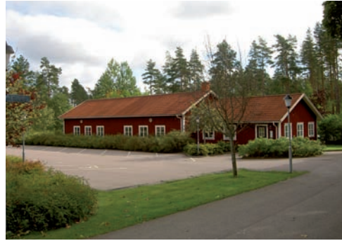
Norr om kyrkogården finns en större parkeringsplats liksom en byggnad med personalutrymmen, redskapsförråd etc för skötseln av kyrkogården.