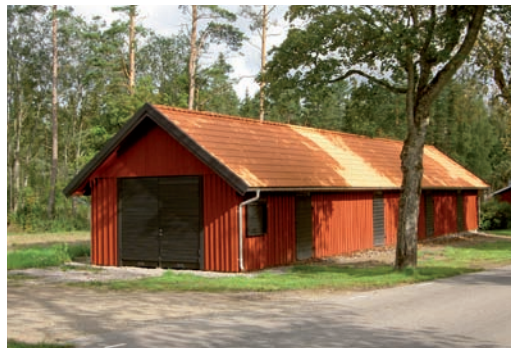
Strax norr om församlingshemmet finns ett magasin och ett fd kyrkstall där det senare idag används som redskapsbod. Kyrkstallet skadades vid stormen 2005 och har återupbyggts till samma utseende det hade tidigare.