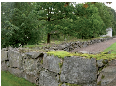
Kyrkogården, förutom skogskyrkogården, är omgärdad av en kallmurad stenmur. På muren växer mossa och fetbladsväxter.