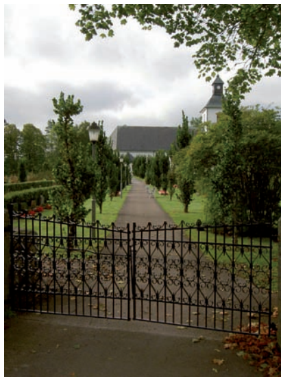
Norra entrén som leder fram till kyrkan.