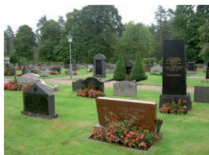
Gravvårdarna i kvarter D och E är främst huggna i diabas och grå granit men det finns även järnhällar och järnkors liksom sådana med detaljer som kors och plattor i marmor.