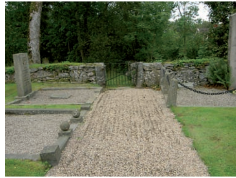
Ytterligare en entré i söder.