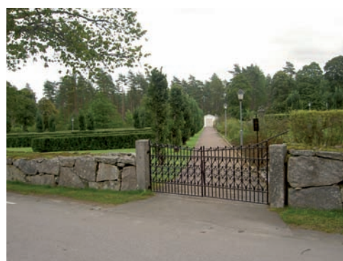
Den västra entrén leder in till den del av kyrkogården som anlades på 1930-talet.