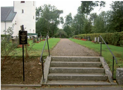
Mellan den ursprungliga delen av kyrkogården och den del som anlades på 1930-talet går en trappa. I kvarteren är gångarna grustäckta medan huvudgångarna, bland annat den som leder upp mot bårhuset, är asfalterade.