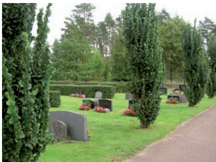
Kvarter G är beläget i den sydöstra delen av det område som anlades 1929. Det är ett avlångt kvarter med familjegravar som är placerade i korta nordsydliga rader.