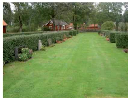
Raderna av gravvårdar i kvarter I står med ryggarna mot häckar av häckoxbär. Häckarna avslutas med en T-form vilket gör att raderna blir mer avskilda och omramade.