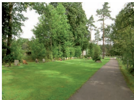
Kvarter M och R är beläget inom den nyetablerade delen, Skogskyrkogården. Kvarter M är långsmalt och placerat inom den sydvästra delen längs med den gamla kyrkogårdsmuren.