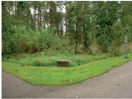
Minneslunden i Skogskyrkogården.