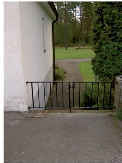
Den östra entrén intill bisättningslokalen som leder ner till skogskyrkogården.