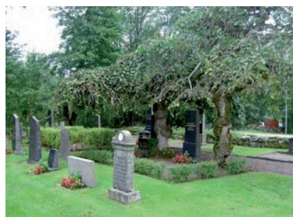
Inom kvarter D och E har de oregelbundet placerade äldre gravplatserna bevarats och några är grustäckta och omgärdade med stenramar eller häckar.

Det är av stor vikt att grustäckta gravplatser omgärdade med stenramar, kedjor eller häckar bevaras och underhålls.