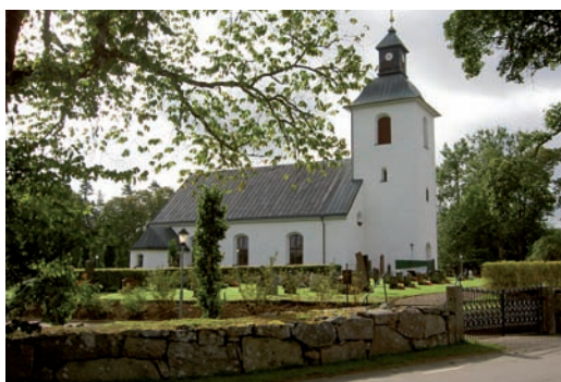
Vislanda kyrka, uppförd 1793-94, ersatte en medeltida kyrka som låg några kilometer öster om Vislanda samhälle.

Vislanda kyrka uppfördes 1793-94, ca fem kilometer öster om den medeltida kyrkplatsen, som en nyklassicistisk kyrka med rektangulärt kyrkorum och tresidig koravslutning i öster. Sakristian är utbyggd och belägen i direkt anslutning till koret i norr. Klocktornet är beläget i väster. Kyrkan är uppförd i sten och utvändigt spritputsad och avfärgad i en vit kulör med slätputsade omfattningar. Taket och lanterninen är klädda med kopparplåt. Ledare för kyrkbygget var prosten Nils Wieselqvist som var kyrkoherde i Vislanda från 1786-1805. Enligt en sägen skall