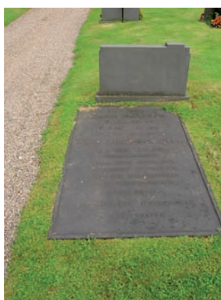
Järnhäll från 1851 i kvarter C.