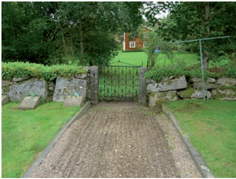
Den södra entrén.