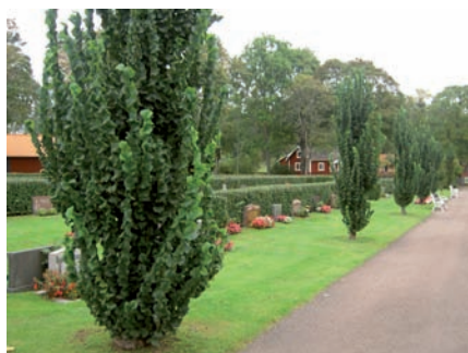
Kvarter J är beläget i den nordvästra delen av utvidgningen från 1929. Längs med kvarterets östra sida står bänkar mellan pelaralmar som ingår i allén längs med den nord-sydliga gången.

För att bevara kvarterens karaktär är det viktigt att rygghäckar med sin speciella form bibehålls och att eventuella nya gravvårdar hålls i samma låga höjd som övriga gravvårdar inom kvarteret. I övrigt är kvarteret relativt okänsligt för nytillskott.