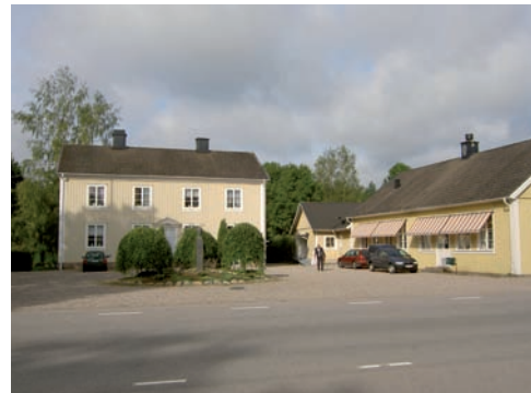
Mitt emot kyrkan ligger sockenstugan som fungerade som småskola och lärarbostad fram till mitten på 1950-talet. Till höger syns en del av församlingshemmet, tidigare en skolbyggnad.