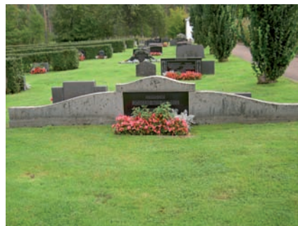
Gravvårdarna är låga, breda, huggna i grå granit eller diabas och ofta är de endast märkta med familjegrav och namn på mannen i familjen samt eventuell titel.