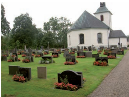
Kvarter C beläget öster om kyrkan är rektangulärt till sin form och gräsbevuxet. De flesta gravvårdarna är huggna i grå granit eller diabas vilket ger området en enhetlig grå/svart färgskala.

Kvarterets karaktär präglas av den grå/svarta färgskalan som ger området ett enhetligt utseende. Vid eventuella kompletteringar bör det ske i samma färgskala.