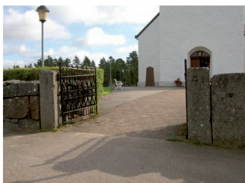
Kyrkogårdens huvudentrén som leder in mot kyrkans entré.