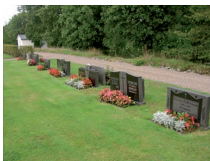
Kvarter C. I östra delen finns ett stort antal gravvårdar från 1950-talet. De är låga, rektangulära och huggna i diabas.