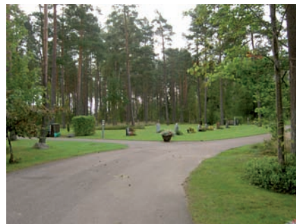
Kvarter M och R är anlagda för kistgravar.