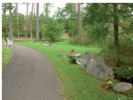
Gravstenarna är låga och där finns såväl liggande naturstenar som gravstenar formade som en bok.