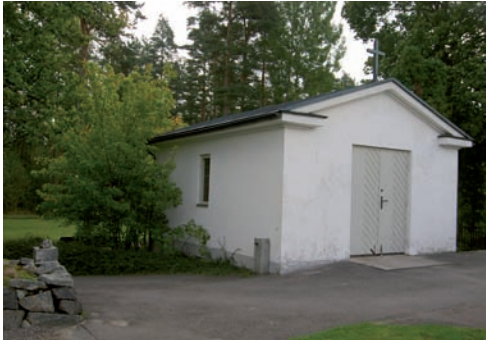
Inom kyrkogården finns en bisättningslokal som är beläget i den norra delen. Bårhuset byggdes omkring 1950 och är ritat av G Erlandsson, Växjö.