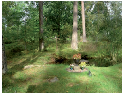
Minneslunden i Skogskyrkogården.