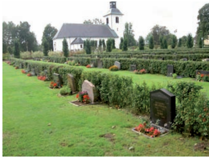
Kvarter H ligger i den nordöstra delen av kyrkogården som anlades 1929. Gravstenarna är placerade i nordsydliga rader med ryggarna mot rygghäckar i häckoxbär.