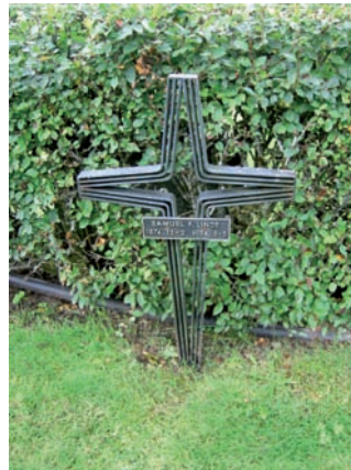
Ovanlig gravvård från 1950-talet i för tiden typisk design.