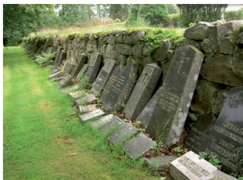
Borttagna gravstenar placeras längs med kyrkogårdsmurens östra sida. De flesta är från 1900-talets början och är huggna i diabas.

Inom kvarter D och E finns ett område med större gravplatser där ett stort antal är ifrån 1800-talets slut och 1900-talets första hälft. Gravplatserna är oregelbundet placerade och många är täckta med grus och omgärdade av stenramar. Kvarteren visar på ett tidigare gravskick som var vanligt från 1800-talets slut och fram till 1950-talet. Kvarter A och B består av en blandning av gravvårdar från 1800-talets slut och fram till dagens gravvårdar. Den norra delen av kyrkogården som anlades på 1930-talet började användas i det nordöstra hörnet och har sedan efter hand utnyttjats vilket gör att där finns gravvårdar kontinuerligt från årtiondena från 1930 och fram till 2000-talet. Inom den nya kyrkogården med minneslund, urnlinje och de nya kvarteren finns 1990-talets slut och 2000-talets individuellt utformade gravvårdar. Inom urnlundens finns det främst liggande naturstenar.