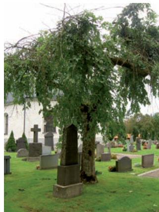
Gravvårdar i kvarter F finns från alla årtionden mellan 1880-talet och 1990-talet vilket innebär att variationen är stor när det gäller form och material.

Det är önskvärt att gravplatser täckta med grus och omramade med stenramar bevaras och underhålls liksom äldre gravvårdar samt de som är resta över två generationers kopparslagare.