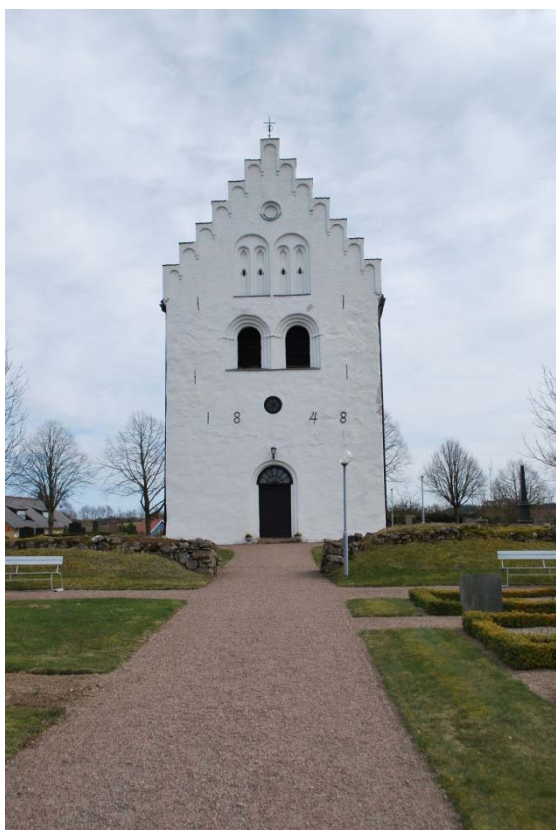
Tornet från 1848 i väster.

Långhusets och korets ursprungliga murar är av obearbetad eller kluven gråsten. I öster i långhuset finns en hörnkedja av sandsten. Runt de ursprungliga fönsteröppningarna ovan valven finns inslag av räfflat tegel och granit. Tegel var ett nytt och exklusivt material vid 1100-talets slut. Närheten till och kontakter med Herrevads kloster kan vara anledningen till tillgången på detta material. De nya fönster och dörrupptagningar som är gjorda på 1800-talet har omfattningar av rött handslaget tegel. Tornet är byggt av kluven gråsten och gavelröstena av rött tegel. Ingen synlig sockel finns på kyrkan men på absiden finns dock en synlig sula med några uppstickande tuktade gråstenar som är svartmålade.