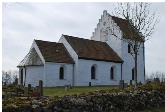
Kyrka och kyrkogård på norrsidan.