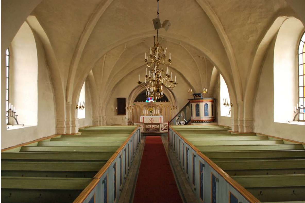
Långhuset mot altaret i öster.

Långhusets väggar och valv är putsade och vitkalkade. Vid bänkkvarteren har ytterväggarna en träpanel på nedre delen av väggen upp till bänkarnas ovankant. Golvet i långhusets mittgång är täckt av viktoriaplattor i svart och grått lagda i diagonalmönster och schackrutigt. Längs kanterna löper två svarta bårder. Under bänkarna finns ett lackat brädgolv och under orgelläktaren ligger ett rött tegelgolv.