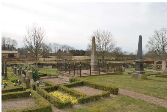
Kyrkogården på södersidan.

Den vanligaste yrkesbenämningen på gravstenarna är lantbrukare.