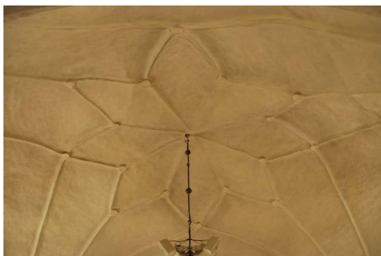
Stjärnvalv i långhuset.

Korvalvets sköld- och gördelbågar samt ribborna utgår från murade pilastrar med kragband. Valvribborna är firsidiga, en halvstens tjocklek och avsmalnande ned mot pilastrarna. Sköldbågarna är murade med en tegelstens tjocklek och en rundstav som följdskift. I valvkrönet avslutas ribborna med en kvadratisk slutsten. Inga eventuella kalkmålningar är framtagna.